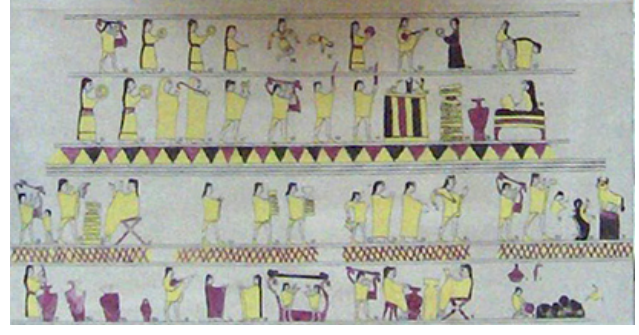
Görsel 6. İnandık Vazosu'nun alt frizi, İÖ. 17. ve 16. yy. (Stringfixer 3, 2022)

Anadolu, arkeolojik buluntular açısından adeta bir açık hava müzesidir. Anadolu uygarlıklarına ait kalıntılar içerisinde müzik, daha çok tören ve ayin betimlemelerinin bulunduğu ya da belirli bir çalgının, müzikle yakından ilişkili mitolojik ya da tarihsel bir kahramanın ya da ölümün betimlendiği orthostat, vazo, kabartma, heykel, lahit, mozaik gibi birçok arkeolojik eserde bulunmaktadır.