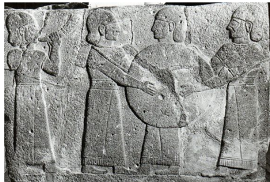
Görsel 8. Karkamış yerleşkesindeki Geç Hitit Dönemi tören yolu kabartmaları: Tef ve boynuz çalan müzisyenler, İÖ 10. ve 9. yy.