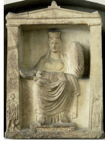
Görsel 15. Elinde def olan Kybele ve Attis, 2. yy. Yunan mermeri, İtalya Museo Arkeoloji Merkezi (Mitolojik Dünya, 2015)