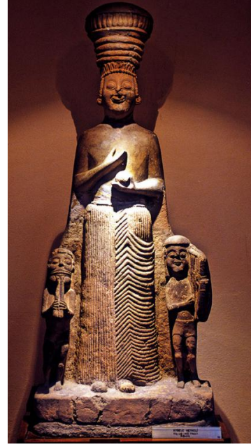
Görsel 19. Ana Tanrıça Kybele, y. 126 cm, kireçtaşı, İÖ 6. yüzyıl Frigya dönemi, Anadolu Medeniyetleri Müzesi (Altuntaş, 2020)

Bugün Anadolu Medeniyetleri Müzesinde bulunan, aslı ise Çorum Boğazköy'deki Hattuşa Antik Kenti'ne ait olan heykel (Görsel 19), bir Frig buluntusu olarak Frigya Dönemi müziksel anlatılarının adeta özeti niteliğindedir. Mitolojik anlatılara göre tanrıça Kybele'nin sol tarafındaki aulos çalan Frigyalı Marsiyas, sağ tarafındaki lir çalan ise İyonyalı Apollon'dur. Bu iki figür, Frigya mitolojisine ait bir müzik yarışmasındaki çekişme ile bilinir (Erhat, 2008, s. 200). Aslında bu çekişme, özünde Frig-İon çekişmesidir. Aşağıdaki heykel ise, tüm Frigya uygarlığını temsilen Marsiyas'ın ve tüm İyonya uygarlığını temsilen Apollon'un her ikisinin de analarının Kybele olduğunu gösterir niteliktedir.