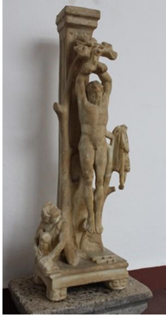
Görsel 18. Asılan Marsiyas, İÖ 6. yy. Roma Dönemi, Manisa, Sarıgöl (Manisa Arkeoloji Müzesi, 2022)