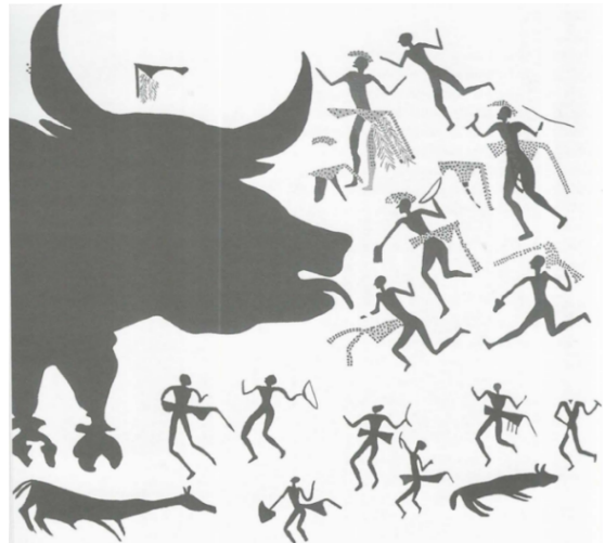
Görsel 4. Çatalhöyük av betimlemeli duvar resimleri, İÖ 7400-6000 (Hodder, 2017, s. 94)

Görsel 4’te verilen resim örneği, ilk müziğin av aletlerinden (ok ve yay gibi), ilk dansın ve vokal-çalgısal icranın av seremonilerinden çıktığını düşündürebilir. Hodder (2017), av seremonilerinin ritüellerle, büyüyle ve sanatla, her şeyden önce de Çatalhöyük yerlilerinin kendine özgü evren ve ruha ilişkin kozmogonik anlayışlarıyla bağlaşıklık olarak betimlendiğini, leopara odaklandığı Çatalhöyük: Leoparın Öyküsü adlı çalışmasında ifade etmiştir. Çatalhöyük ve civarı, Neolitik Dönem’e ait ok ve yaylarla yapılan av seremonisini betimleyen birçok resimli arkeolojik bulgu barındırmaktadır ve birçoğunun ortak noktası, genelde otobur yabancıkları ve (sığır, geyik, yaban domuzu vb.), av malzemeleri (ok-yay) ile bellerinde leopar deseni bulunan ve dans eden avcılarını betimlemesidir. Bunun en büyük nedenlerinden biri, Çatalhöyük topluluklarının, Anadolu leoparlarıyla et açısından ortak bir besin zincirine sahip olduğu için, avın leopar kılığı aracılığıyla leopar ruhunu ve gücünü elde ederek gerçekleşeceğine inanmaları olabilir.