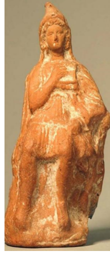
Görsel 12. Attis, Pan flüt çalarken, Helenistik Dönem Tarsus'undan (The British Museum, 1899)