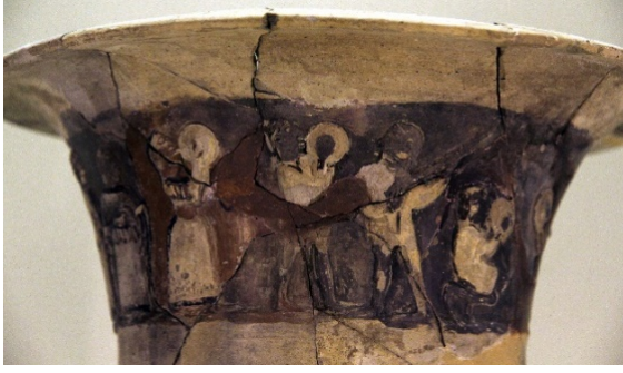
Görsel 5. Dansçıları, zil çaraları ve lutçalarını resmeden Hitit Vazosu, İÖ 16. ve 15. yy., Hüseyin Dede Höyüğü (Stringfixer 2, 2022)