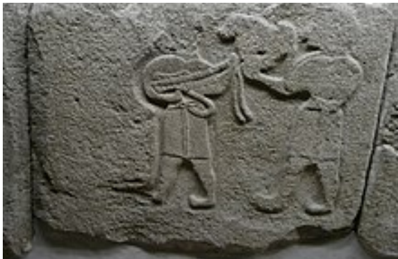
Görsel 7. Çorum Alacahöyük kabartmalarında lutçalarlar, Hitit Dönemi (Alaca Kaymakamlığı, 2022)

Hitit uygarlığına ait arkeo-müzikolojik bulgular, hem organolojik hem de törensel/kültürel açıdan bilgi verebilecek geniş bir veri havuzuna sahiptir. Masalcı Şahin (2020), Hititlerin müziğe ait arkeolojik bulgularını törenler , çalgılar , müzisyenler ve arkeolojik belgeler olarak dört guruba ayırmıştır. Hitit uygarlığına ait arkeolojik bulgular, o dönemdeki müziğin hem çok tanrılı bir kozmogoninin uzantısı olduğuna hem de çalgılara ve müziğe bir kutsiyet atfedildiğine işaret etmektedir. Dolayısıyla Hitit müziğinin kutsal bazı amaçları yerine getirmek için hayatın birçok alanında etkin olarak kullanıldığı söylenebilir. Hititlerin müzik