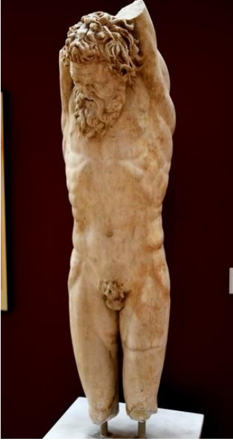
Görsel 17. Asılan Marsiyas, İÖ 3. yy. Roma Devri Tarsus'u, İstanbul Arkeoloji Müzesi (Arkeoloji Dünyası, 2022)