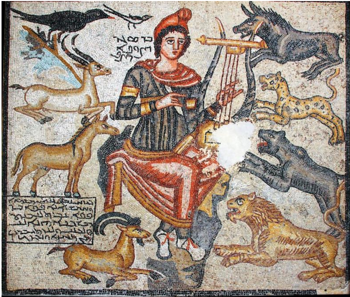
Görsel 22. Orpheus ve hayvanlar mozaiği, 2. yy. Şanlıurfa, Şanlıurfa Arkeoloji Müzesi (Demir, 2019)

Tülek'e (1998) göre aşağıda yer alan Orpheus, Anadolu ve Orta Doğu coğrafyasında daha çok mozaik olarak işleme eğilimindeyken Avrupa'da tıpkı Dokuz Müz, Dionysos ya da müzikle ilgili diğer mevzular gibi mermer lahitler üzerine de işlenmektedir (s. 13). Lahitler üzerine işlenen mitolojik müzik konuları, ölüme ve öte dünya inanışına gönderme yaptığı için, ele alınan inanışların kutsallığını vurgulaması açısından bir kat daha değerlidir.