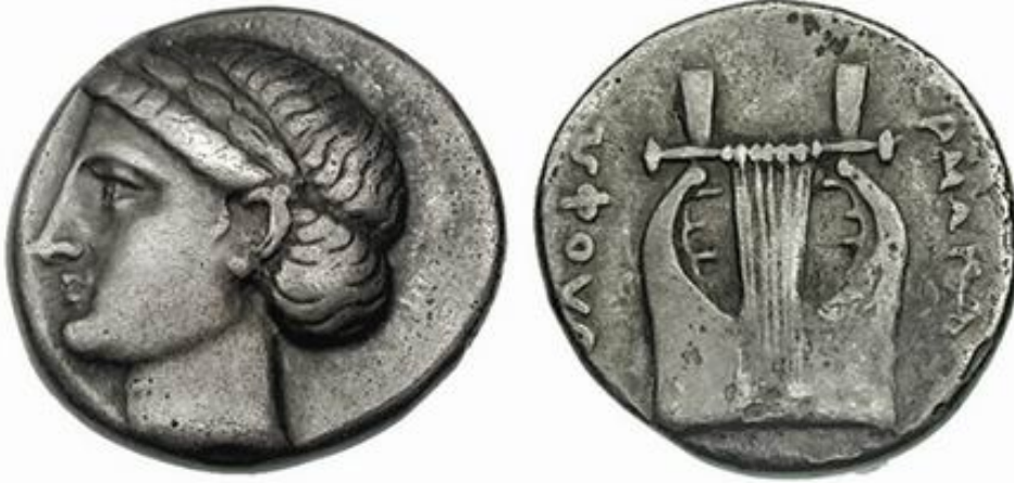
Görsel 21. Kolophon sikkesi, ön yüzünde Apollon ve arka yüzünde çalgısı lirin temsili, İÖ 4. yy. (CoinArchives, 2022)

Arkeolojik buluntular içerisinde müziksel verilere rastlamamak, Anadolu uygarlıkları için olanaksızdır. İşte mitolojik unsurlar olan ve arkeolojik kalıntıları bulunan Orpheus, Dionysos, Müzler, Pan, Marsiyas, Hyagnis, Harmonia ve tüm diğerlerine bu bağlamda bakmak gerekir. Aşağıda, Anadolu uygarlıklarına ve köşüt olarak Avrupa uygarlıklarına ait arkeolojik bulgular içerisinde yer alan ve mitolojik karşılığı olan öğelerin bazılarına ilişkin birkaç somut örnek verilecektir.