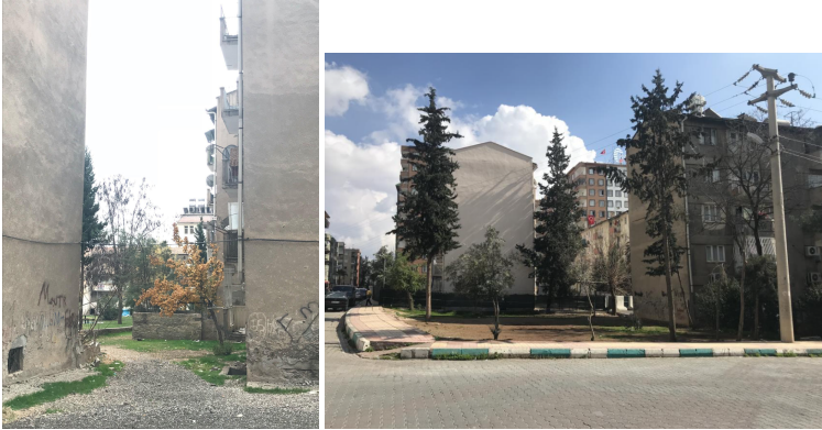
Şekil 15. ve 16. Lojmanlar arası geçiş alanları (Yazar, 2019, yazarın kişisel arşivi).

Damımız çok hoş, temiz, düzenli. Çatı katı değil, enerji de yok. Bir gün köfte yaptık, bir gün çaya çıktık. Biber de yapıyoruz. Ben istedim. Dedim, biber yapacağım. Yasak ama artık güç yettirmiyor. Herkes anahtar çıkardı, gelsin gücü yetiyorsa alsın. Salçamızı, biberimizi çıkarıyoruz, mangal da yapan var. (...) Damın suyunu da kestiler. (Hilal hanım, kişisel iletişim, 6 Mayıs 2022).