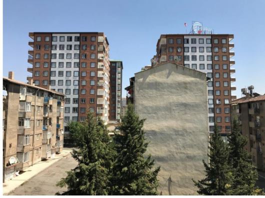
Şekil 19. Adliyeciler lojmanından Polatkan sitesine bakış (Yazar, 2019; yazarın kişisel arşivi).

mayı da beraberinde getirir. “Bu koşullarda haneler, yaşadıkları evlerini istedikleri gibi biçimlendiremezler. Yaşadıkları konutlarda kendini ifade etme imkanı ve tatmin bulamazlar” (Maden ve Marcus, 2021, s. 60).