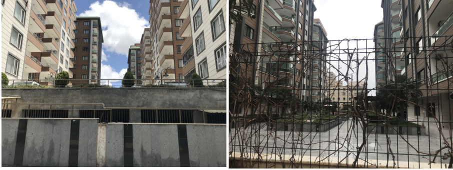
Şekil 17. ve 18. Polatkan Sitesi dış duvarları ve iki siteyi ayıran iç duvarlar (Yazar, 2022; yazarın kişisel arşivi).

dönüşüm politikalarının bir sonucudur. Mahalle zaten ‘değerli’, o sitenin orada olması mahallenin değerini/kentsel niteliğini arttırmamakta; ama sitenin “ekonomik” değeri sürekli artmaktadır. Sonuçta üretilen şey, kentsel bir çelişkiye de işaret eder.