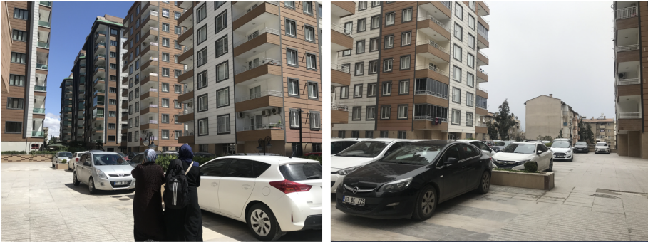
Şekil 24. ve 25. Otopark alanı, bloklar arası alan (Yazar, 2022; yazarın kişisel arşivi).

Tüm bu olumsuzluklarla birlikte, sitede yaşamın en konforlu taraflarından birinin “güvenlik” olduğunu söyler, neredeyse bütün görüşmeciler. Lojmanda otururken herhangi bir problemle karşılaşp karşılaşmadıkları sorulduğunda ise, orasının da güvenli olduğunu, bir problemle karşılaşmadıklarını belirtirler. Emniyet binasının hemen arka sokakta, yakınlarda polis lojmanları bulunmasına rağmen, güvenlikle ilgili bu “algı”, “güvenlikli site” pazarlama stratejileriyle de ilişkilidir.