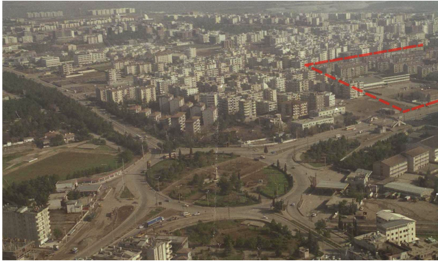
Şekil 6. Abide Kavşağı ve 90'lı yıllarda Yenişehir mahallesi. Kırmızı ile belirtilen alan lojmanların kentleşme dokusundaki yerini gösterir. (A. Cihat Kürkçüoğlu arşivi, Şanlıurfa Koruma Kurulu'ndan erişilmiştir).