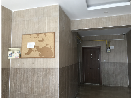
Şekil 20. ve 21. Site girişi ve bina girişi.