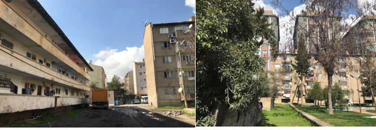
Şekil 3. ve 4. Küme ev ve lojman ilişkisi (solda) ve küme evlerden Polatkan sitesine bakış (sağda). (Yazarın kişisel arşivi).