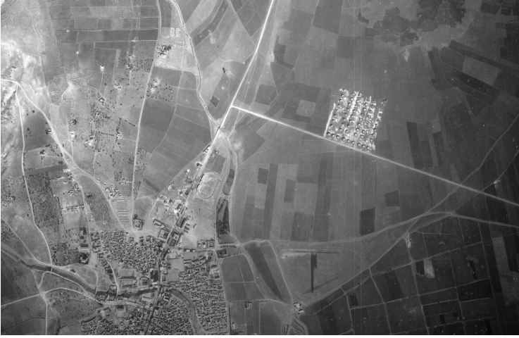
Şekil 5. 1955 tarihli hava fotoğrafında kentin kuzeydoğu yönündeki ilk yerleşmeler görünmekle birlikte henüz sosyal konutlar inşa edilmemiştir..