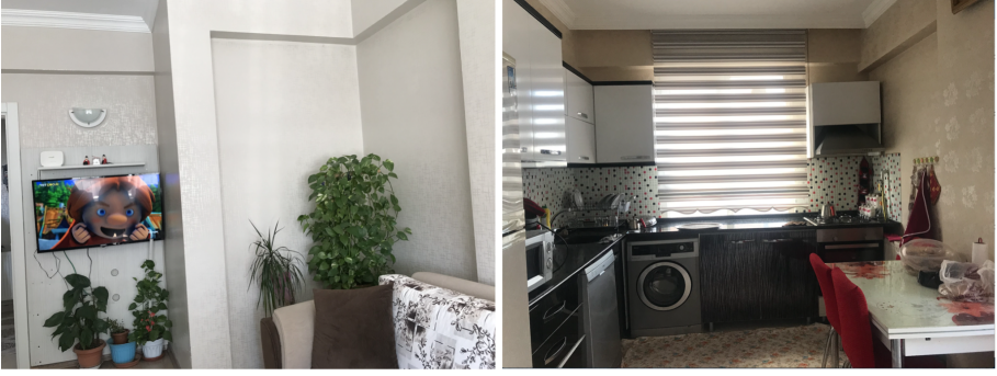
Şekil 22. ve 23. Hilal hanımın evinin salonu, Şule hanımın evinin mutfuğu (Yazar, 2022; yazarın kişisel arşivi).

Şekil 20.'de, site girişinde araçların girip çıkması sonucu kırılan parke taşları; Şekil 21.'de, bina iççiliğindeki özensizlik görülür. Şekil 22. ve 23.'te ise, görüşmecilerin ikisinin salon ve mutfaklarından fotoğraflarda, yine tasarım sorunları ve yaşayanların bununla mobilya/eşyaları yerleştirme yöntemiyle baş etme çabaları görülmektedir. Salonda tv ünitesi yerleştirecek “düz” bir duvarın bulunmaması, bitkileri yerleştirmek suretiyle mekânı “güzelleştirme” çabası dikkat çeker. Mutfakta balkon olmaması en çok vurulanan ve yaşayanların alışkanlıklarını en çok zorlayan sorunlardan biridir.