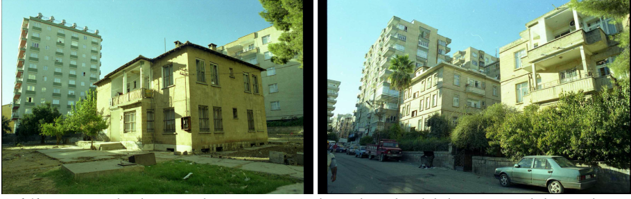
Şekil 1. ve 2. 90'larda Yenışehir semti. Yenışehir evleri olarak bilinen müstakil taş evler ve apartman dokusu bir aradalığı görülmektedir (A. Cihat Kürkçüoğlu arşivi, Şanlıurfa Koruma Kurulu'ndan erişilmiştir).

kopuk bir yerleşim özelliği gösteren, önemli bulvarların kesiştiği Abide kavşağına yürüme mesafesinde bulunan bu alan, zamanla şehrin en 'modern' mahallelerinden biri konumuna gelir. Günümüzde de parkları, kentsel donatı alanları ve nüfusun dengeli bir ilişki içinde olduğu, beş katı geçmeyen apartmanlarıyla kentin en 'gözde' mahallelerinden biridir.