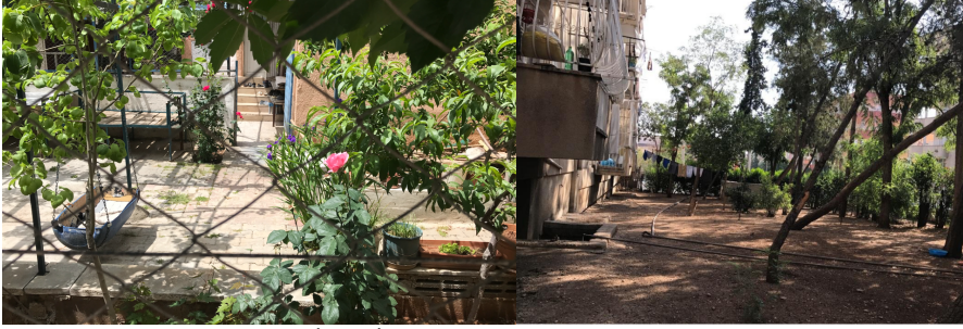
Şekil 13. ve 14. İmar-İskan ve Adliyeciler lojmanının bahçeleri.

Bahçemizi özlüyoruz. Biberimizi kurutuyorduk. Birlikte kahvaltı yapıyorduk. Merdivenleri yıkıyorduk sırayla. Hepimizin apartmanının önüydü, bakıyorduk bahçeye, apartmana. Biz orada keyif ediyorduk. Şimdi bir mangal yapmana izin vermiyorlar. Ekmek yapmayı bırak. Sofi emmi, o ağaçlara evlat gibi bakardı. (Şule hanım, kişisel görüşme, 7 Mayıs 2022).