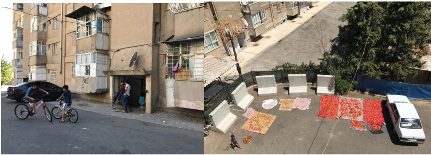
Şekil 11. ve 12. Lojmanda gündelik hayat (Yazar, 2019; yazarın kişisel arşivi).

Bahçesinde kahvaltı yapılan, ikindi çayları içilen, salça-biberin kurutulduğu, ihtiyacı olana elbirliğiyle ekmek yapılan, çocukların bahçede ip atladıkları, top oynadıkları bir gündelik yaşamdan “damda mangal yapmaya bile izin verilmeyen” bir gündelik yaşama geçilmiş oldu. Bir mahalledeki, bir konuttaki komşuluk ilişkileri farklı dinamiklerle birlikte zamanla dönüşür. Nitekim buradaki dönüşüm yaşayanların kendi iç dinamikleriyle değil; konut üretiminde izlenen yöntem dolayısıyla gerçekleştirilir.