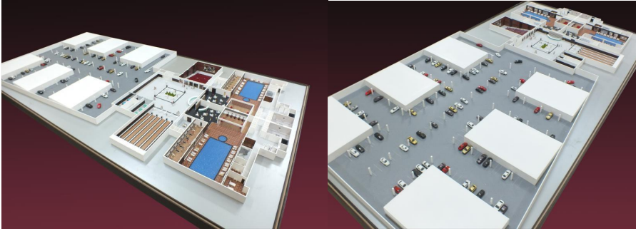
Şekil 7. ve 8. Polatkan Sitesi tanıtım-pazarlama maketi bodrum kat plan perspektifleri (Er Maket, 2011).

Polatkan bize çok oyun oynadı. Altta hamam var, yüzme havuzu var. Kadınlar yürüyüş yapıyor, ne istiyorsan var. Bize dedi ki hepsinden siz de faydalanacaksınız. Dedi arabalarınız otoparkta olacak. Kadınlara ayrı, erkeklere ayrı yüzme havuzu var. Cafe var. Bizi oradan kesti, ayırdı. O tarafa bütün bunları verdi. Git bak nasıl onun tarafı, bir acayip. Kimler kimler oturuyor. Bize dedi 125 metrekare olacak daireleriniz. Biz de inandık. 125 yeter, ne yapacağız. Asansör ortada olacağına, bizim evlerimizden çıkardılar. Odalar küçük, mutfak küçük. Biz mutfakla yanındaki odanın duvarını yıktık, 1 mutfak ettik. Gidenimiz gelenimiz çok. Nasıl ettiler, bizi kandırdılar. (Hilal hanım, kişisel görüşme, 6 Mayıs 2022).