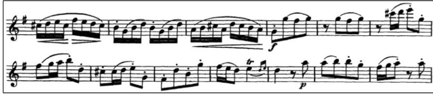
Örnek 8: J. J. Quantz Sol Majör Flüt Konçertosu 3. bölüm 65-77. ölçü 23

Üçüncü bölümün 39. ölçüsüyle duyurulan ilk cümle, Örnek 9'da da gösterildiği gibi 114. ölçü itibariyle re majörün dominantıyla başlayarak tekrar etmekte ve 119. ölçü itibariyle ilk temaya dönüş yapmaktadır. Yürüyen ve tekrar eden notalar birçok kez kullanılmıştır. Üçüncü bölümdeki birçok motif, birinci bölümlerle benzerlik göstermektedir. Oldukça atik ve dinamik çalınması gereken bu bölüme hâkim olabilmek için gam, arpej ve üçlü çalışmalarına ağırlık verilmesi önerilmektedir. Pasajlar metronomla titiz bir şekilde çalışılmalı; farklı hız, dil, bağ ve tartımlarla çeşitlendirilerek pekiştirilmelidir.