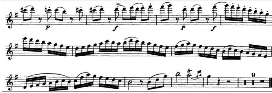
Örnek 4: J. J. Quantz Sol Majör Flüt Konçertosu 1. Bölüm 138-156. ölçü 19

Bestecinin senkoplarda kullandığı aksanlar ve piano-forte atışmaları esere kıvrak ve şakacı bir ruh verirken; minör tondaki temalar bölüme duygusallık katmıştır. Konçertonun birinci bölümü gösterişli bir trille sol majör tonda sona ermektedir.