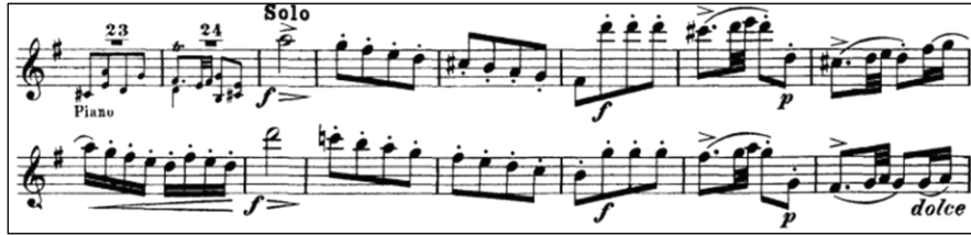
Örnek 9: J. J. Quantz Sol Majör Flüt Konçertosu 3. bölüm 112-126. ölçü 24

Üçüncü bölümün 39. ölçüsüyle duyurulan ilk cümle, Örnek 9'da da gösterildiği gibi 114. ölçü itibariyle re majörün dominantıyla başlayarak tekrar etmekte ve 119. ölçü itibariyle ilk temaya dönüş yapmaktadır. Yürüyen ve tekrar eden notalar birçok kez kullanılmıştır. Üçüncü bölümdeki birçok motif, birinci bölümlerle benzerlik göstermektedir. Oldukça atik ve dinamik çalınması gereken bu bölüme hâkim olabilmek için gam, arpej ve üçlü çalışmalarına ağırlık verilmesi önerilmektedir. Pasajlar metronomla titiz bir şekilde çalışılmalı; farklı hız, dil, bağ ve tartımlarla çeşitlendirilerek pekiştirilmelidir.