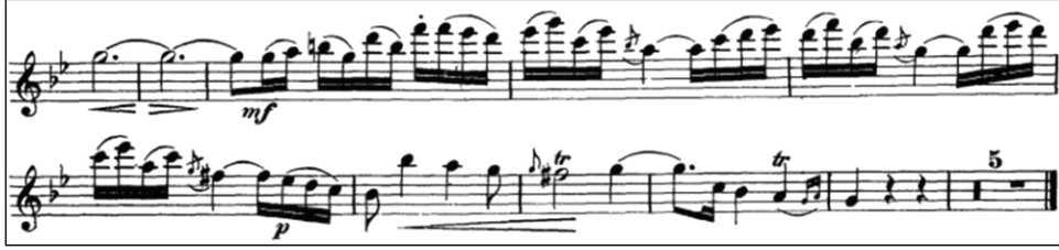
Örnek 6: J. J. Quantz Sol Majör Flüt Konçertosu 2. bölüm 56-70. ölçü 21