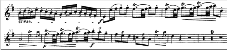
Örnek 2: J. J. Quantz Sol Majör Flüt Konçertosu 1. Bölüm 48-63. ölçüler 17

24. ölçüde duyduğumuz sol majörle başlayan ana tema, 65. ölçüde, Örnek 3'te de görüldüğü üzere re majör arpej motifiyle gelmektedir. Tril, gam ve onaltılık notaların sıkça kullanıldığı bu bölüm, neşeli ve görkemli bir ritmik ve melodik yapıya sahiptir.