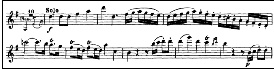
Örnek 3: J. J. Quantz Sol Majör Flüt Konçertosu 1. Bölüm 64-72. ölçüler 18

Bestecinin senkoplarda kullandığı aksanlar ve piano-forte atışmaları esere kıvrak ve şakacı bir ruh verirken; minör tondaki temalar bölüme duygusallık katmıştır. Konçertonun birinci bölümü gösterişli bir trille sol majör tonda sona ermektedir.