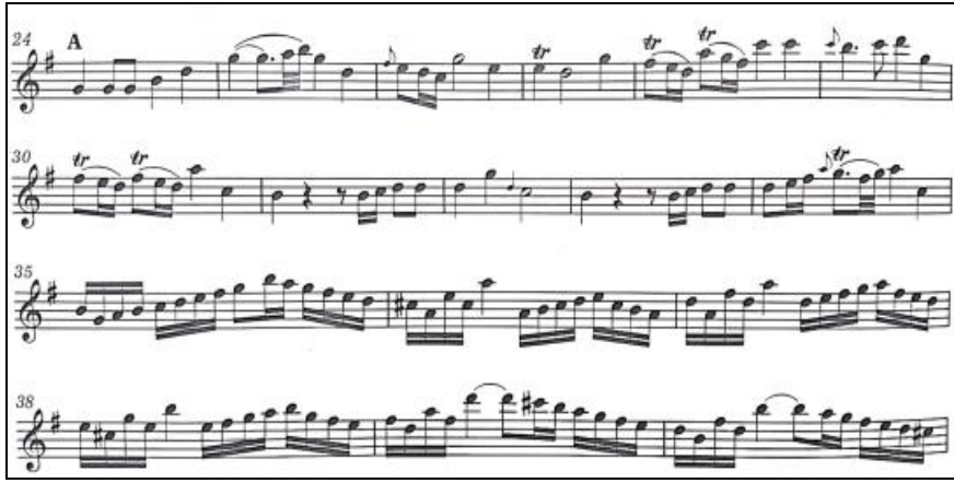
Örnek 1: J. J. Quantz Sol Majör Flüt Konçertosu 1. Bölüm 24-40. ölçüler 16

4/4'lük ölçü biriminde allegro assai tempoda sol majör arpej motifiyle başlayan ilk bölüm, do diyezın sıklıkla kullanıldığı dizilerle kulağımızı re majöre hazırlamakta; triller, onaltılıklar ve üçlemelerle birlikte re majör tonuna ulaşmaktadır. Süsleme, staccato , dil, bağ, nüans çeşitliliği Örnek 1 ve Örnek 2'de gösterilmektedir.