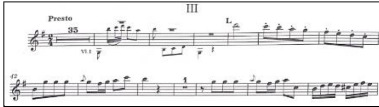
Örnek 7: J. J. Quantz Sol Majör Flüt Konçertosu 3. bölüm ilk 48 ölçü 22

Üçüncü bölüm 2/4'lük ölçüde presto yazılmış olup, ilk bölüme kıyasla daha hızlı ve canlı çalınmaktadır. Flütün ilk cümlesi, sol majörün beşlisiyle başlamaktadır. Örnek 8'de 65. ölçü itibariyle re majöre dönmektedir.