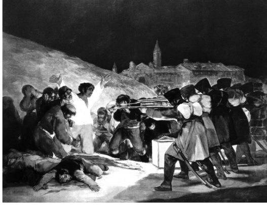
Resim 1. Francisco de Goya Lucientes "3 Mayıs Kurşuna Dizilenler" 268x347 cm, 1814

Betimleme: Eserde, karanlık bir gecede silahlı insanlar (askerler) tarafından öldürülen bir grup insan yer almaktadır. Yağlıboya yöntemiyle yapılan tablonun sol alt köşesinde üst üste düşmüş iki ceset, hemen üstlerinde ellerini açıp bir şeyler anlamaya çalışan beyaz gömleklili bir genç ve gençle ölümler arasında yine silahlı kişilere bir şeyler anlatmaya çalışan beş adam yer almaktadır. Silahlı kişilerin önünde ise çevresine ışık saçan sarı renkte bir kuru vardır. Resmin ana karakteri olarak görülen beyaz gömleklili genç adamın sol tarafında ise manzara karşısında korkuyla yüzünü kapatmış, korkan insanlar bulunmaktadır. Figürlerin kıyafetlerinden köylü oldukları anlaşılmaktadır. Olay bir tepenin önünde gerçekleşmekte ve tepenin hemen arkasında ise bir şehir silüeti görünmektedir.