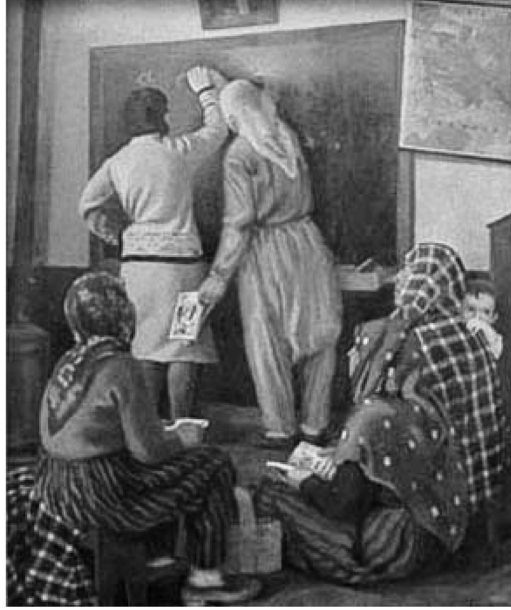
Resim 5. Şeref Akdik "Millet Mektebi"

Betimleme: Eserde sırtı dönük beş kadın ve bir çocuk görülmektedir. Kadınlardan ikisi ayakta üçü oturuyor durumdadır. Kadınlardan dördü örtülü ve yerel kıyafetleriyle, biri ise modern tarzda giyinmiştir. Modern görünümlü kadınla birlikte yerel kıyafetli bir kadın duvarda asılı duran tahtada yazı yazmaktadırlar. Diğer oturan üç kadın ise onları izlemektedir. Tüm kadınların ellerinde de kitap bulunmaktadır. Duvarda bir yazı tahtası, tahtanın bir yanında soba ve diğer yanında da harita bulunmaktadır.