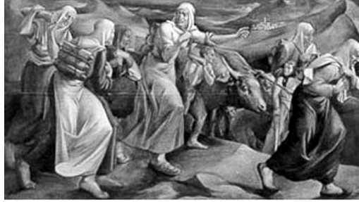
Resim 4. Halil Dikmen "İstiklal Savaşı'nda Mermi Taşıyan Kadınlar" 1933

Betimleme: Eserde altı kadın ve iki çocuk görülmektedir. Tüm figürler ileri doğru ilerlemektedir. Kadınların tümü başörtülü ve uzun kıyafetler giymiştir. Tüm kadınların sırtında mermi vardır ve mermi çoğunlukla taşımaktadırlar.