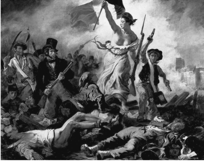
Resim 2. Ferdinand Victor Eugène Delacroix "Halka Yol Gösteren Özgürlük" 260x325 cm, 1830

Betimleme: Tablonun sağ ortasında sağ elinde bayrak, sol elinde tabancayla ileri doğru koşan yarı çıplak bir kadın ve yanında elinde silah olan bir çocuk bulunmaktadır. Kadının başında ise bir başlık görülmektedir. Bu başlık kırmızı renkli, koni biçiminde ve tepesi kıvrımlı bir başlıktır. Kadının sol arkasında ise elinde tabancası, üstünde temiz kıyafetleri ve şapkasıyla aristokrat olduğu anlaşılan bir adam ve hemen arkasında heyecanla koşan elleri silahlı köylü erkekler bulunmaktadır.