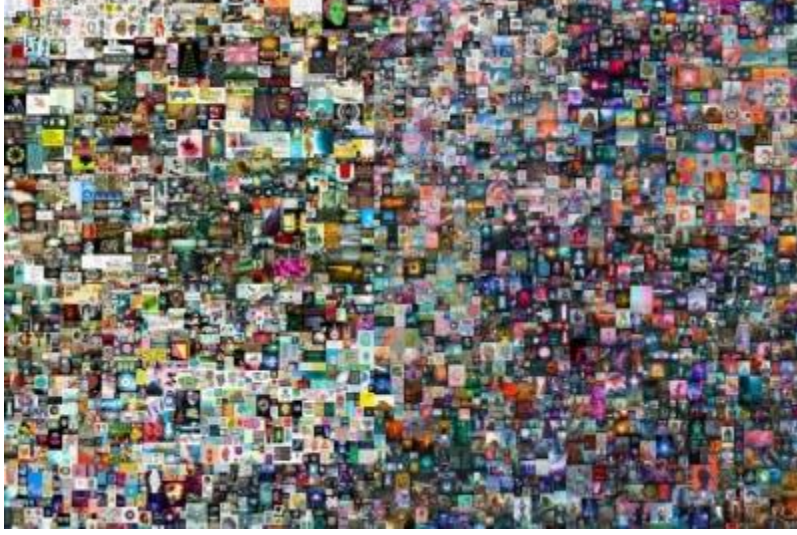
Görsel 3: Everydays: The First 5,000 Days – Beeple

Projenin başlangıcında temel çizimlerden oluşan Everydays, son yıllarda dijital fotoğrafların ve 3D tasarımlardan oluşan güncel olaylara tepki veren soyut temalara dönüşmektedir. “Artık neredeyse ona politik bir karikatüristmişim gibi bakıyorum” diyen Beeple, "eskizler yapmak dışında, güncel olaylar hakkında neredeyse gerçek zamanlı olarak yorum yapmak için en gelişmiş 3D araçlarını kullandığını" söylüyor (Christie’s, 2021).