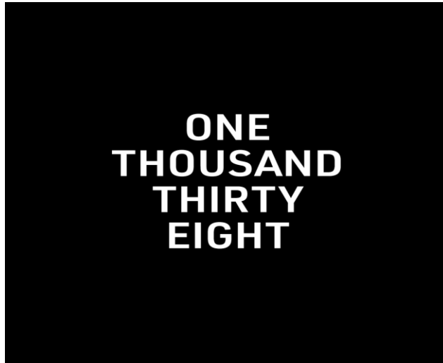
Görsel 4: Clock adlı NFT eser, Julian Assange'in ne kadar süredir hapiste kaldığını göstermek için her gün güncellenmektedir.

'Saat', Pak ve Julian Assange tarafından yaratılmış bir eser olup WikiLeaks'in kurucusu Assange'in hapsedildiği günleri sayan saat görevi görmektedir. Assange'in yasal savunmasına para toplamak amacıyla üretilen NFT'yi satın almak ve Assange'ı desteklemek için 10.000'den fazla kişi paralarını bir araya toplayarak 53.1 milyon ABD dolarına eseri satın aldı (Reuters, 2022 Şubat 9).