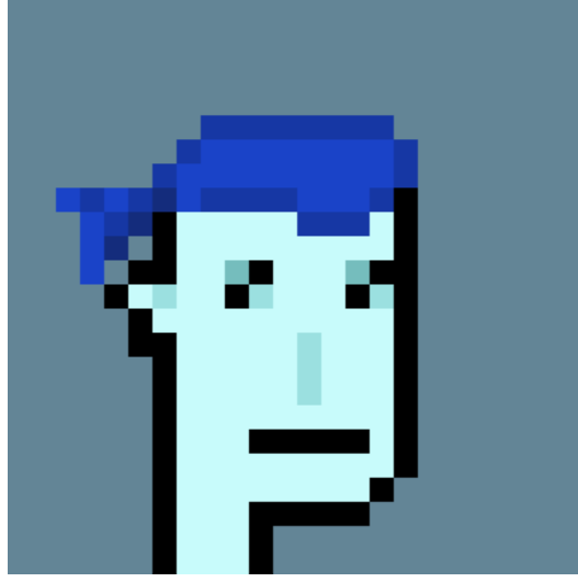
Görsel 6: CryptoPunk #5822

Şubat 2022’de CryptoPunks Bot Twitter hesabından yapılan resmi açıklamada CryptoPunk #5822 isimli NFT, CryptoPunk’ın tarihindeki en büyük NFT satın alımının yapıldığı belirtildi. #5822 isimli NFT, Ethereum blok zincirinde Deepak.eth adıyla bilinen Chain CEO’su Deepak Thapliyal tarafından 8.000 ETH karşılığı yani yaklaşık 23,7 milyon dolara satın alındı (Brown, 2022 Nisan 25).