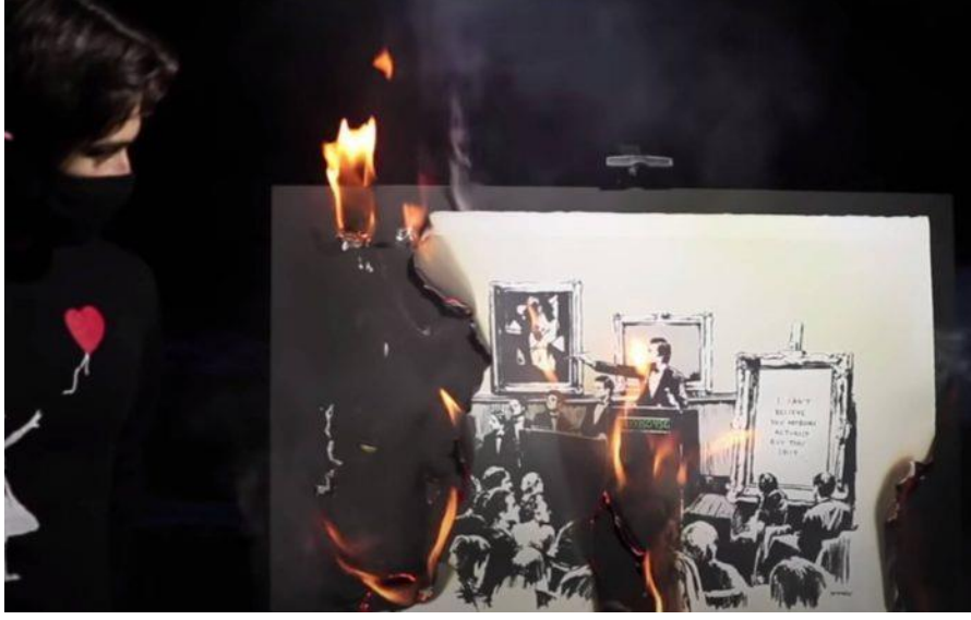
Görsel 1: Orjinal Banksy sanat eseri, canlı yayınlanan bir videoda yakıldı.

İlk NFT eserin ne olduğu veya dijital eserlerin ne zaman meta olmaktan çıkıp sanat eseri sayıldığı tartışılmaktadır ancak, Haziran 2017’de NFT pazarında işlemlere başlayan CryptoPunks bilinen en eski proje kabul edilmektedir. Kasım 2017’de prömiyeri yapılan CryptoKitties ise 2.251 işlem ve 73,3$ değerle günlük en çok işlemin yapıldığı projedir (Ante, 2021: 5). Bu ürünlerin pazarlanabilmesi için 2018 yılından beri SuperRare, OpenSea, Nifty Gateway ve MakersPlace gibi NFT platformları faaliyetlerini sürdürmektedir.