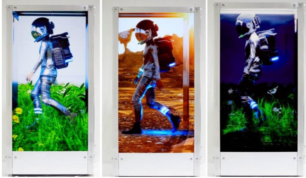
Görsel 5: Human One, dijital ve fiziksel hibrit heykel olma özelliğine sahip

Beeple'in bir başka çalışması olan Human One, sanatçının yaşamı boyunca yaratıcı bir şekilde eklemeyi ve geliştirmeyi amaçladığı, dinamik olarak değişen fiziksel ve dijital bir melez parça olan üretken bir sanat eseri olarak tasarlanmıştır. Eserin yaratıcısı Beeple, bu sanat eserine uzaktan erişim yetkisine sahip ve içeriğini sonsuza kadar değiştirebilmektedir. Human One, yavaş yavaş dönen LED ekranlardan bu değişikliklerin hepsini sergilemektedir.