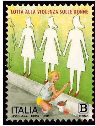
Şekil 1: Kadına Karşı Şiddetle Mücadele, İtalya, 30x40 mm

15 Ekim 2013 tarih ve 119 sayılı yönetmelik İtalya'nın, cinsiyete dayalı şiddetle mücadelesinin temel hukuki gerekçelerini oluşturmaktadır. Israrlı takip ve cinsiyete dayalı şiddet konularına açıklık getiren bu yönetmelik, başta; önleyici ve koruyucu tedbirlere, sonrasında cezai yaptırımlara yer vermektedir. Bu bağlamda en ağır cezai yaptırımlar, savunmasız konumunda olan hamile kadınlara yönelik işlenen suçları kapsamaktadır. Yönetmelik, 18 yaş altı çocukların yanında işlenen suçlara da ayrıca ağır cezai yaptırımların uygulanması gerektiği konusu üzerinde durmaktadır (Palmén vd., 2016: 17-18).