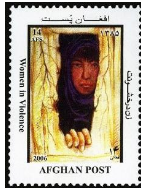
Şekil 7: Kadına Karşı Şiddet 1, Afganistan 28,5x38x5 mm

Otuzdan fazla savaş deneyimi olan Afganistan, günümüzde hâlâ sıradan bir gününü dahi savaş psikolojisiyle yaşayan bir ülkedir. Afgan toplumunda kadınlar tamamen yasaklar altında yaşamaktadırlar. Afgan vatandaşlar arasındaki ayrımcılığı yasaklayan Anayasasının 22. Maddesi, aynı zamanda kanun önünde kadının ve erkeğin eşit hak ve ödevlere sahip olduğunu da vurgulamaktadır. Ancak uzun yıllar şiddetin gölgesinde kalan Afgan toplumu, tamamen yasaklar içerisinde yaşayan bir kadın profili üretmekten geri kalmamıştır. Çocuk yaşta evlilik, taciz ve cinsel suçlar başlıca şiddet tiplerini oluşturmaktadır (Waheed, 2020: 144).