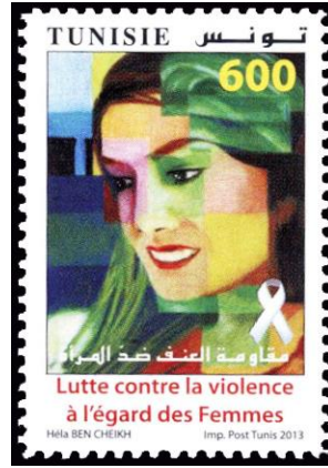
Şekil 6: Kadına Yönelik Şiddetle Mücadele, Tunus

Şekil 6'da 2013'te Tunus'ta tedavüle çıkarılan ve Kadına Yönelik Şiddetle Mücadele temasıyla hazırlanan bir pula yer verilmiştir. Pul, 4 renkli ofset baskı yöntemiyle basılmıştır. Pulun baskı sayısını veya bir seriye mi ait olduğunu gösteren herhangi bir bilgiye rastlanmamıştır. Tasarımcısının ise Héla BEN CHEIKH olduğu pulun üzerinde belirtilmiştir. Pulun üzerinde Kadına Yönelik Şiddetle Mücadele anlamına gelen Fransızca metin, kırmızı renkte ve nispeten büyük puntolarla yazılmıştır. Pulun üzerinde ülke ismi belirtilmiştir. Diğer pullarda olduğu gibi bu tasarımda da marjlara kadar basım gerçekleştirilmemiş, sınırları belli olan, daha sade bir düzen tercih edilmiştir. Pulda kullanılan görsel, ince siyah çizgi içine alınmış illüstratif bir çalışmayı yansıtmaktadır. Bu alandaki kadın figürü üzerinde, bilinçli olarak yerleştirilen canlı renklerin haricinde, daha koyu tonlarda ve lekesele renklerde bulunmaktadır. Bu lekesele koyuluklar, kadına karşı şiddetin sanatsal bir tezahürü olarak nitelendirilebilir. Yine aynı sınırlı alan içerisinde pulun değeri belirtilmekte, Arapça bir ibareye yer verilmekte ve beyaz kurdele kullanılmaktadır. Bilindiği üzere beyaz kurdele, 1990'lı yıllarda Kanada'lı üç erkeğin kadına yönelik şiddete karşı öncülük ettiği bir hareketin sonucunda ortaya çıkan semboldür.