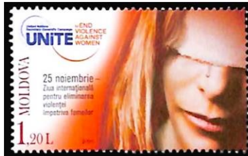
Şekil 3: 25 Kasım Kadına Yönelik Şiddete Karşı Uluslararası Mücadele Günü, Moldova, 46x27,50 mm

2000’li yıllar Moldovalı kadınlar üzerindeki cinsiyet ayrımcılığının veya kadına yönelik şiddet hadiselerinin dünya çapında duyulmaya başlandığı dönemdir. Ağır ekonomik koşullar altında ezilen ve iş bulma umuduyla başka ülkelere göç eden Moldovalı kadınlar, özellikle bu dönemden sonraki süreçte insan ticareti, kaçırılma ve şiddet gibi olaylarla karşı karşıya kaldılar. Ülkelerine dönen kadınlar üzerinde yapılan araştırma sonuçları, Moldovalı kadınların ayrımcılığa uğradığını göstermektedir. Ayrıca Moldovalı kadınlar, genel olarak Moldova’da erkek yönlü bir egemenlik anlayışının olduğunu düşünmektedirler (Abiala, 2014: 270-282).