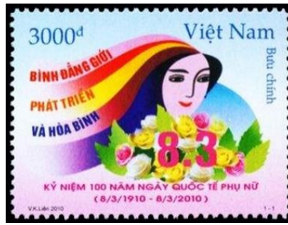
Şekil 5: Vietnam Dünya Kadınlar Günü'nün 100. Yılı Kutlaması, Vietnam, 43x32 mm

Birleşmiş Milletler, kadınlara ve kız çocuklarına yönelik şiddetin sona erdirilmesi konusunda Vietnam'a yönelik vaka çalışması yapmış ve bunu bir rapor halinde paylaşmıştır. Raporda, eşi olan tüm kadınlara, eşleri tarafından belirli fiziksel, cinsel, duygusal veya ekonomik şiddet eylemleri yaşayıp yaşamadıkları sorulmuştur. Genel olarak, evlenmiş kadınların %32'si hayatları boyunca fiziksel şiddete maruz kaldığını ve %6'sı son 12 ayda fiziksel şiddete maruz kaldığını bildirmiştir. Evlenmiş kadınların %10'u yaşamları boyunca, %4'ü ise son 12 ayda cinsel şiddete maruz kaldıklarını söylemişlerdir. Kadınların %54'ü yaşam boyu duygusal istismarı %25'i ise mevcut duygusal istismarı bildirmektedir. Bu rapordaki ekonomik istismarın yaygınlık oranı %9 olarak saptanmıştır (United Nations, 2010: 15-17).