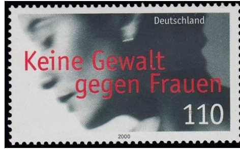
Şekil 13: Kadına Karşı Şiddete Hayır, Almanya

Şekil 13'te 2000'de Almanya'da tedavüle çıkarılan ve Kadına Karşı Şiddete Hayır temasını betimleyen bir pula yer verilmiştir. Pula ait baskı sayısı, tasarımcı ve forma bilgilerine ulaşılamamıştır. Fakat yukarıda belirtilen tecavüz, istismar, şiddet vb. nedenlere dayalı olarak pulun tam ortasına kan kırmızı renginde ve semi-bold (orta kalınlıkta) Kadına Karşı Şiddete Hayır anlamına gelen Almanca ibarenin yerleştirildiği görülmektedir. Hemen altında pulun değeri neredeyse aynı büyüklük ve ağırlıkta verilmiştir. Bu tasarımda hiyerarşinin olmaması aslında kadına karşı uygulanan şiddetle buradan elde edilecek olan miktarın (parasal kazanımın) eş değerde tutulduğunu düşündürmektedir. Forma alanını oluşturan siyah beyaz fotoğrafta ise bakımlı olduğu kadar endişeli görünen bir kadın figürünün kullanıldığı tahmin edilmektedir. Fotoğrafın bulanık ve kadrajlama hatasına sahip olması, figürün jest ve mimiklerini okumayı zorlaştırmakla birlikte duruşun belirlenmesinde ve dolayısıyla verilmek istenen görsel mesajın algılanmasında sorunlara neden olmaktadır. Aynı zamanda yine forma üzerine konumlandırılmış ülke ibaresi bulunmaktadır. Marjda ise emisyonu yapıldığı yıl bilgisine yer verilmiştir.