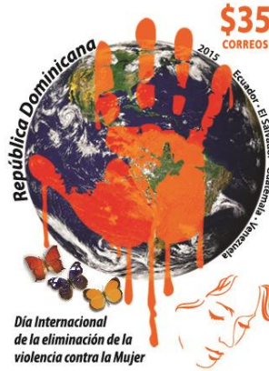
Şekil 12: Uluslararası Kadına Yönelik Şiddetle Mücadele Günü, Dominik Cumhuriyeti, 30x40 mm