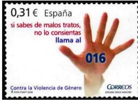
Şekil 2: Cinsiyete Dayalı Şiddete Karşı, İspanya

Şekil 2’de 2008’de İspanya Posta İdaresi tarafından tedavüle çıkarılan ve Cinsiyete Dayalı Şiddete Karşı temasını betimleyen bir pula yer verilmiştir. Jesús Sanchez tarafından tasarlanan bu pulda 4 renk kullanılmış ve marjlara kadar tasarım uygulanmıştır. Buna rağmen pulun forması bilinmemektedir. Pula yukarıdan aşağıya doğru bakıldığında; sol üst köşede semi-bold (orta kalınlıkta) değer ibaresi ve hemen yanında ise biraz daha küçük puntoya sahip ülke adı belirtilmektedir. Bir alta geçildiğinde ise kırmızı ve mavi olmak üzere iki renkten oluşan Kötü muameleyi biliyorsanız, buna rıza göstermeyin, 016’yı arayın anlamına gelen İspanyolca ibare yer almaktadır. Bu belirteç akıllara Türkiye’de faaliyet gösteren Alo 183 Aile, Kadın, Çocuk ve Engelli Sosyal Danışma Hattı ’nı getirmektedir. 016 numarası diğer kelimelere göre daha kalın ve büyük puntolu yazılmış ve aynı zamanda arka planda yardım istercesine uzanan bir kadın elinin ortasına konumlandırılmıştır. Kadın eli, yatay ekseninde pulun yarısını kaplayacak büyüklükte kullanılmış ve pulun sağına konumlandırılmıştır. Pulun en altında sol tarafa bakıldığında Cinsiyete Dayalı Şiddete Karşı temasının adı bulunmakta hemen altında ise M RCM-FNMT 2008 ibaresi yer almaktadır. Sağ tarafta ise İspanya Postanesinin logotype’ı ve hemen altında tasarımcısının ismi bulunmaktadır. Ayrıca yazıların okunurluğunu artırmak ve tasarıma dikkat çekmek için arka plan rengi beyaz zeminde kurgulanmıştır.