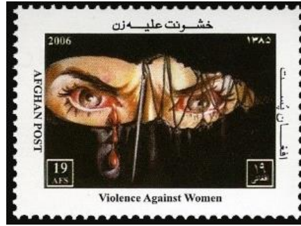
Şekil 8: Kadına Karşı Şiddet 2, Afganistan 38,5x28x5 mm

Görsellerde 2006'da Afgan Postanesi tarafından tedavüle çıkarılan ve Kadına Karşı Şiddet temasını konu alan 3'lü pul serisinden ikisine yer verilmiştir. Pullar 4 renkli ofset baskı yöntemiyle basılmıştır. Marjlara geniş yer bırakılmış ve bu alanın etrafına İngilizce ve Arapça ibareler yerleştirilmiştir. İki pulda da illüstratif betimlemeye yer verilmiş olduğu görülmektedir. Görsel 7'de yer alan pulun değeri 14, Görsel 8'de yer alan pulun değeri ise 19 Afgani olarak belirlenmiştir. Görsel 7'de yer alan pulda betimlenmiş olan kadın figüründe korku ve sinmişlik hissi açıkça belirtilmiştir, fakat meraklı olma durumu da bir o kadar barizdir. Aynı zamanda hayata çok küçük bir yerden bakması da genel olarak Afgan kadınların durumunu ortaya koymaktadır. Görsel 8'de yer alan pul, diğerinin aksine kadının öfkesini apaçık ortaya koymaktadır. Sadece gözlerinin açık olduğu çarşafında, göz bölgesinin bile dikilmeye çalışılması, kadınlara karşı uygulanan yasakların hangi seviyede olduğuna dair fikir vermektedir. Bunun yanı sıra gözden akan kan damlaları bakışlarla birlikte ele alındığında, kadının yasaklamalara karşı direnip şiddet gördüğünü düşündürmektedir.