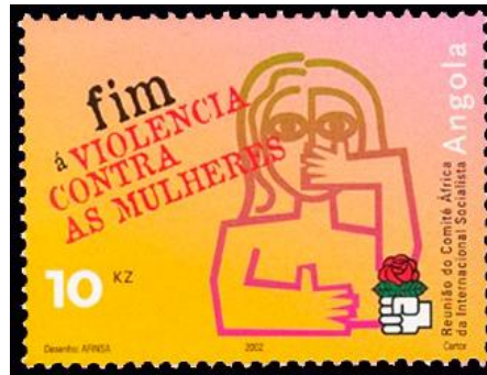
Şekil 10: Kadına Şiddete Son, Angola

Kadına yönelik şiddet hadiselerinin yaygın olarak görüldüğü ülkelerden biri de Angola’dır. Son dönemlerde yapılan araştırmalar, bu bölgedeki şiddet olaylarını daha çok yoksullukla ilişkilendirmektedir. Dünya Bankası’nın yayınladığı Dünya Kalkınma Raporuna göre Angola, 188 ülke arasında 112. sırada yer almaktadır. Her ne kadar kentleşme oranı %62,6’lara ulaşmış olsa da altyapı yetersizliği, çarpık kentleşme, sağlıksız yaşam koşulları ve kamu hizmetlerine erişimde yaşanan kısıtlılık hâlâ Angola’nın temel sorunlarını oluşturmaktadır. Örneğin aile içi şiddet konusu yakın zamana kadar Angola’da yasal bir suç olarak görülmemekteydi. Ancak parlamento’nun 2011 yılının Temmuz ayında çıkardığı yasayla birlikte bu tanım üzerinde değişiklik yapılmıştır. Yeni yasa, cinsiyete dayalı şiddet suçu işleyenlere cezai yaptırımların önünü açmıştır (Asedotter Stronen ve Nangacoive, 2016: 2).