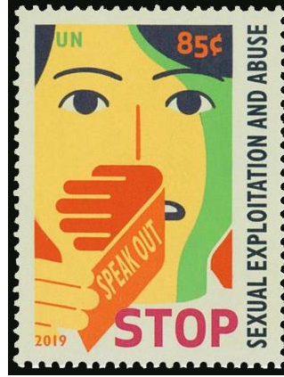
Şekil 11: Cinsel Sömürü ve İstismarı Durdurun, Birleşmiş Milletler 40x30 mm

özgürlüğün kısıtlanması, kamusal ve özel yaşamdan mahrum bırakma gibi eylemler ise şiddetin kapsamını belirlemektedir (World Health Organization, 2021).