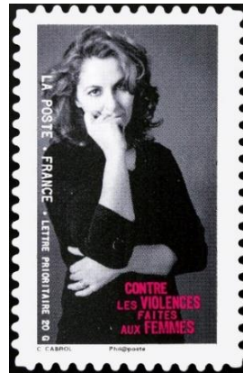
Şekil 9: Kadına Karşı Şiddet, Fransa 25x39 mm

Kadın hakları konusunda bir hayli mesafe kateden Fransa, ilk olarak 1980'lerde aile içi şiddet ve tecavüz olaylarını, feminist aktivistlerin başarılı çabalarıyla siyasi gündeme taşımıştır. Bu bağlamda en büyük ölçekli çalışma 1997'de gerçekleşmiştir. Buna göre toplumun örtülü kalan yönleri ve özellikle banliyöde yaşanan aile içi şiddet, tecavüz, kadın sünneti ve kadın ticareti gibi hadiseler medyanın gündemine taşınmıştır. Ayrıca Fransa'nın kendi halkının en temel problemi, partner şiddetidir. 2011'de Avrupa Konseyi tarafından kabul edilen İstanbul Sözleşmesi'ni Fransa üç yıl aranın ardından 2014'te onaylamıştır. Kadına yönelik şiddeti ortadan kaldırarak toplumsal cinsiyet eşitliğini tesis etmeye çalışan bu bütüncül yaklaşım, aynı yıl kısmen de olsa Fransız hukukuna dâhil edilmiştir (Allwood, 2016: 379).