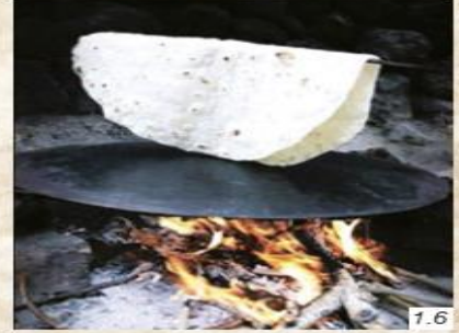
Sacda pişen yufka

Havza'da ev hanımları, kış mevsiminde tüketecekleri yiyecekleri imece usulüyle hazırlıyorlar. Günümüzde birçok gıda ürünü marketlerde hazır olarak satılmasına rağmen geleneksel gıdalar arasında yer alan yufka, Havza'da ev hanımları tarafından hâlâ geleneksel yöntemlerle hazırlanıyor. İlçede kış aylarında tüketilen yufkayı komşular bir araya gelerek el birliğiyle açıyor ve pişiriyor. Kuru hâlde muhafaza edilen yufka, tüketileceği zaman ıslatılıp yenmeye hazır hâle getiriliyor. Mahalleli kadınlar, "Yılda iki kez yufka açıyoruz. Ramazan öncesi ve kış öncesi yiyeceğimiz yufkayı birlikte yapıyoruz. Birkaç kadın mahallede kime yufka açacaksak onun evinde toplanıyoruz. Kimimiz hamur yoğuruyor, kimimiz yufka açıyor, kimimiz yufkaları pişiriyor (Görsel 1.6), kimimiz de iş yapanlara yemek hazırlıyor. Yaptığımız yiyecekler marketlerde hazır satılıyor ama biz yufka, turşu, salça, tarhana gibi pek çok yiyeceğimizi kendimiz yapıyoruz." dedi.