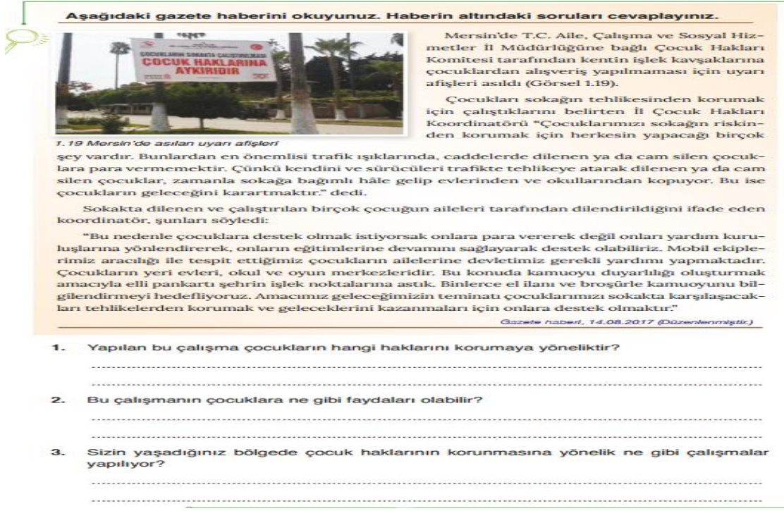
Şekil 3. Beşinci Sınıf Ders Kitabında Yer Alan Gazete Haberi 1

Beşinci sınıf “Bir Bütünün Parçasıyız” ünitesi “Haklarımla Varım” başlığı altında çocuk hakları ile ilgili aşağıdaki (Şekil 3) gazete haberi (s.27) verildikten sonra haber ile ilgili sorular yer almaktadır.