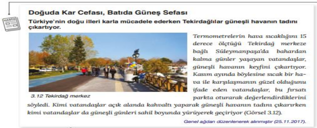
Şekil 4. Beşinci Sınıf Ders Kitabında Yer Alan Genel Ağ Haberi 2

Beşinci sınıf “İnsan ve Çevre” ünitesi “İklimin Yaşamımıza Etkisi” başlığı altında iklimin toplumsal yaşama etkisini göstermek amacıyla aşağıdaki (Şekil 4) genel ağ haberi (s.65) verilmiştir.