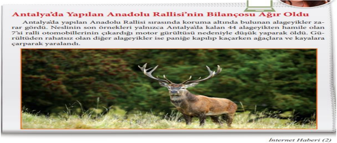
Şekil 2. Dördüncü Sınıf Ders Kitabında Yer Alan Genel Ağ Haberi 2

Dördüncü sınıf "İyi Ki Var" ünitesi "Zarar Vermeden Kullanalım" başlığı altında çocuklarda farkındalık oluşturmak amacıyla aşağıdaki (Şekil 2) genel ağ haberi (s.118) verilmiştir.