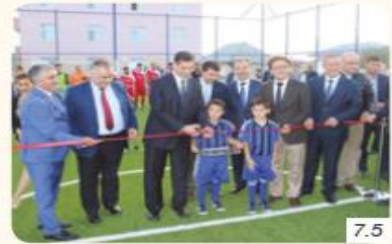
Halı sahanın açılış töreni

Türk İşbirliği ve Koordinasyon Ajansı Başkanlığı (TİKA) Azerbaycanlı gençlerin zararlı alışkanlıklardan korunmasına, Azerbaycan'ın geleceğinin sağlam temeller üzerinde inşa edilmesine katkı sağlayacak eğitim, spor ve kültür faaliyetleri çerçevesinde üniversite öğrencileri ve gençlerin kullanımı için halı saha kurdu. Açılış töreninde (Görsel 7.5) konuşan T.C. Bakü Büyükelçisi, "Türkiye ile Azerbaycan iki devlet, bir millettir. Türkiye'nin gücü Azerbaycan'ın, Azerbaycan'ın gücü ise Türkiye'nin gücüdür. Birlikte her zaman daha güçlü ve daha ileride olacağız." dedi. Büyükelçi, Azerbaycanlı gençlerin desteklenmesi adına Azerbaycan'da yapılan çalışmalardan dolayı TİKA'ya teşekkürlerini dile getirdi.