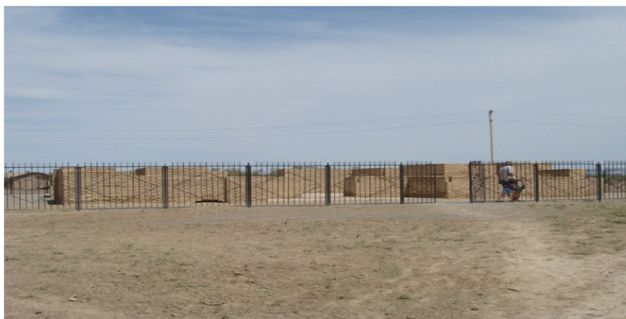
5-сурет. Кесенені қалпына келтіру кезі

Келешекте бұл екі Нисамиддиннің ғибадатханасы тұрғызылып біткенде Нисамиддин бабаның ұрпақтары осы бабалары жатқан ғибадатханаға тәуіп ететін болады.