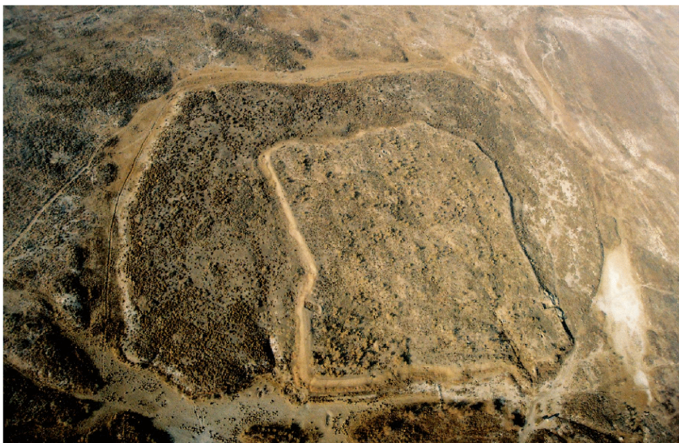
1- сурет. Сығанақ қаласының авиафотосуреті

X ғ. атақты араб жағрафиятанушы, ғалым Ал-Идриси Сырдария бойындағы ғұндардың (оғыздардың – С.Ж.) қалаларының көптігін жаза келіп, олардың ішіндегі Сауран, Сүткент, Сығанақ қалаларын ірі қалалар еді, ал, Сығанақ пағыз сауданың қайнаған ортасы деп ерекше көрсеткен. Сығанақ қаласынан зиялы білімді ғалымдарда шыққан: Шайқы баба Сығанаки алғаш Хорезмде тұрса кейін осы сығанақта тұрған, біраз жыл Жент қаласында да тұрған. Бұл қаладан Хусам ад Дин ас Сығанаки осы ғалымның үлкен атасы нисамиддин де (1132-1199) өмір сүрген. Бұл ғалым өзінің атақты діни шығармалары «Нихая» мен «Хидая» кітаптарын осы қалада жазған. Бұл еңбектерге оның немересі Хусамаддин талдау жасаған.