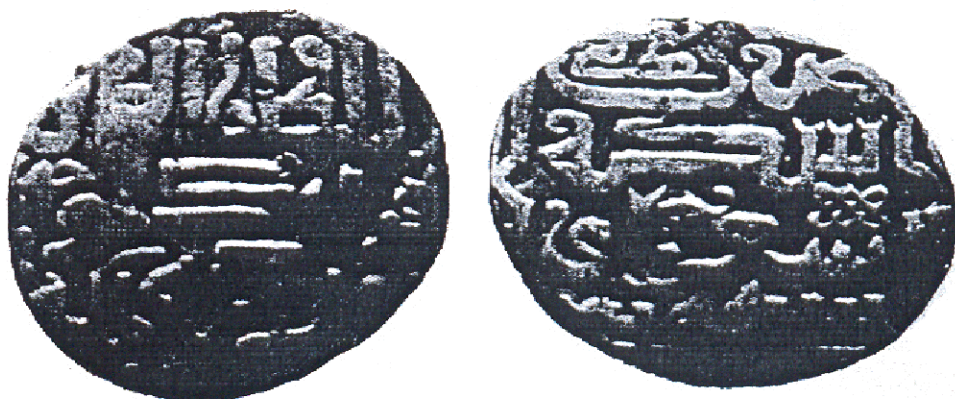
2-сурет. Мубарак ходжа хан шығарған теңгесі (1358 ж.)

бастаған. Бұл кез Ақ Орданың ханы болған Ерзен ханның кезі, белгісіз автор Искендірдің дерегіне қарағанда Ерзен хан қалаларға мешіт, медреселер салдырған. Өзі Сығанақта қаза болып, осы қалаға жерленген. Міне осы Ерзеннің кезінде қалада ақша (теңге) шығарылып, сауда жұмысы жанданған. Сығанақта да мешіт, ханака (ғибадатхана) медреселер салынған. Қалаға зерттеу кезінде оның оңтүстік-батыс жағынан үлкен мешіттің орны ашылды. Қаладан табылған теңгелерге қарағанда Мұбарак ходжа хан кезінде Сығанақта және Ұрыс ханның кезінде жаңа Сығанақта ақша шығарылған (сурет 2 Иштван Вапари Отан тарихы № 2 (242)).