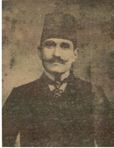
Resim 1 Polis Mecmuası, sy.112.