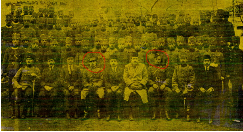
Resim 3 İstanbul Polis Mektebi 19. dönem tahsilinde yer alan itilaf polis eğitimcilerine dair görüntü. Polis Mecmuası, sy.124.

Mütareke Dönemi'nin önemli gelişmelerinden birisi Umumi Harp nedeniyle eğitimine bir müddet ara veren İstanbul Polis Mektebinin yeniden açılışı ve bu süreçteki ilk mezuniyet töreni ile törene katılımcılardır. Özellikle İtilaf güçlerinin önde gelenlerinin katılımı ve tavsiyesi ile gerçekleştirilen törene Florinalı Nazım Bey de katılmıştır. Bu nedenle Florinalı Nazım Bey, kamuoyuna yansıyan polis okulu töreni hakkında Polis Mecmuasının 120. sayısında “Dersaadet Polis Mektebinin Zabıtamıza Yeni Bir Sahifesi” (Polis Mecmuası, 1 Kanun-ı evvel 1335: 370) başlıklı bir yazı kaleme almış ve yazısında tören sırasında gördüklerini, görüş ve düşüncelerini ifade etmiştir.