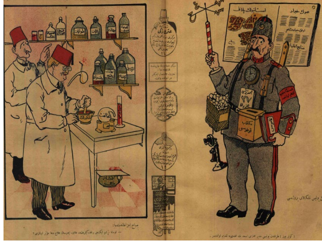
Görsel 4 Yeni Polis Teşkilatı Projesi (Güleryüz, 1921:4).