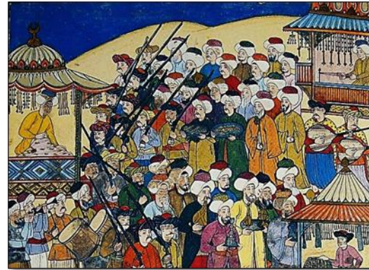
Resim 1. ( sol) Kanuni'nin Topkapı Sarayı'ndaki Culus Töreni, Seyyid Lokman, Hünername, II, TSMK, H.1527, y.25b-26a.