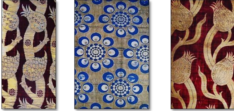
Resim 29. XVI. yy Osmanlı Kumaş Desenleri.

15.yy dan itibaren Osmanlı sanatının bütün dekoratif sanat kollarında uygulanan pars beneği motifinin içine 16.yy'dan sonra ikinci bir yuvarlak yerleştirilerek elde edilen dekoratif motif kumaşlarda olduğu kadar çini, seramik, işleme, sedef işçiliği, halı gibi birçok süsleme sanat eserlerinde kullanılmıştır. Sarayda en çok kullanılan kumaşlardan olan kemha, çatma ve en kıymetli kumaş olan seraser kumaşlarında bu motif teknik özelliklerinden dolayı farklı şekillerde uygulanmıştır. Çatmalarda eni kaplayacak kadar büyük yuvarlakların içine ikinci bir yuvarlak yerleştirilmesi ile elde edilen büyük madalyonların, değişimli sıralar halinde kullanılmasından oluşan bir desen gösterdiği halde, kemhalarda iç içe benek motif daha çok üçlü olarak kullanılır. Ay motifi Türk sanatında 14.yy dan itibaren sancak, bayrak ve cami alemlerinde kullanılmaya başlanmış sonrasında Türklerle ilgili bir sembol haline gelmiştir.