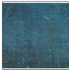
Resim 8. (sol) Bogasi Dokuma Kumaş Örneği.

Kirpas: Bogasi’ya nazaran daha kaba dokunmuş bir kumaştır. Bugünkü branda bezleri ayarında olup, daha çok ordu ihtiyacında ve Otağ-ı Hümayun denilen sultan çadırlarının yapımında, cami, türbe gibi yapıların kapı perdelerinde kullanılmıştır. 16