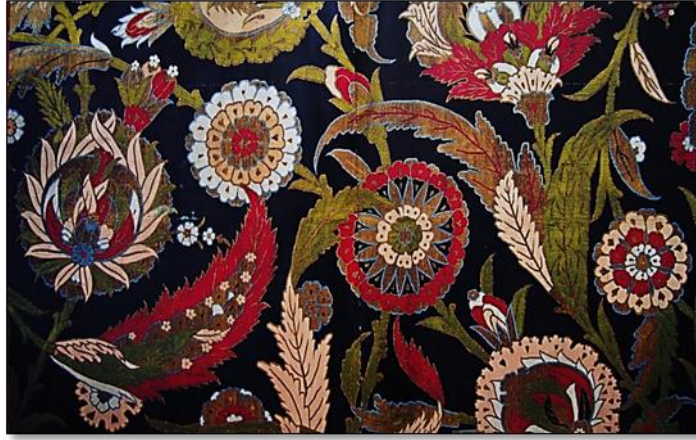
Resim 30. XVI. yy Osmanlı Kumaş Deseni (Saz Üslubu).

16. yy süsleme sanatlarındaki üslup çeşitliliği ve zenginliği içinde oval madalyonlu desenler öne çıkmaktadır. Oval madalyonlar bütün dekoratif sanat eserlerine uygulanarak 17. yy yarısına kadar en verimli çağını yaşamıştır. Desen, oval madalyonların tekrarlanmasından dolayı, geniş satır isteyen bir süsleme tarzıdır. Kemha ve çatmalarda kendi teknik özellikleri içinde çok çeşitli şekillerde kullanılmıştır. Oval madalyonlar nar motifi, lale motifi, taç motifi gibi diğer desenlerle de ortak kompozisyonlar oluşturularak kullanılmışlardır. Taç motifi çatmalarda 16. yy başlarından itibaren görülmeye başlamıştır. Taç ve nar motifleri bu dönemde Türk ve İtalyan kumaşlarında fazlaca kullanılmıştır.