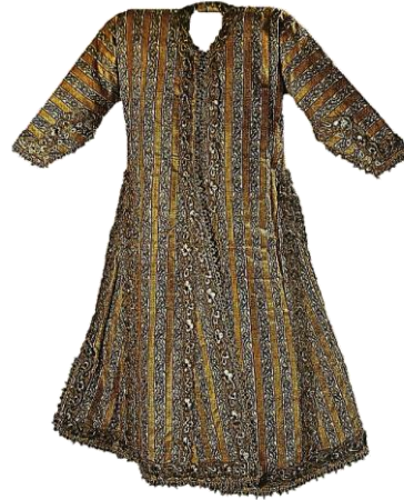
Resim 20. Selimiye Dokuma Kumaş ve Kaftan Örneği.

Şib: İpekli olup tel ile dokuması zenginleştirilmiştir bir kumaştır. İstanbul'un telli ve sade Şib'i meşhurdur. Anadolu Şibleri, ipekten, atlas zemin üzerine telin de kullanıldığı yerel zevki aksettiren dokumalardır. 29