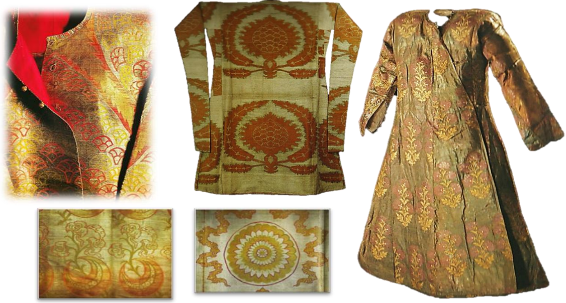
Resim 24. Seraser Dokuma Kumaş ve Kaftan Örnekleri.

İpekli kumaşları özellikle de seraseri, padişah ve şehzadelerin atlı veya yaya olarak geçecekleri yola sermek Osmanlı'da saygı ve bağlılığı ifade etmenin etkili bir yolu olmuştur. İpekli yer örtülerine payendaz denmiştir. Şehzade Mehmed'in 1582 yılında sünnet düğünü için gittiği İbrahim Paşa Sarayı'na girerken atının ayakları altına, altın ve gümüşle dokunmuş seraser serilişi hem Surname'de hem de Şehinşahname'de görülmektedir. 33 Arşiv kayıtlarına ancak 16. Yy ortalarında saraya bağlı İstanbul atölyeleriyle beraber geçmiştir. Hükümet ferman ve kanun maddeleriyle bu pahalı kumaşın kalitesini daima korumaya çalışmış ve atölye sayısını 100'le sınırlı tutmuştur.