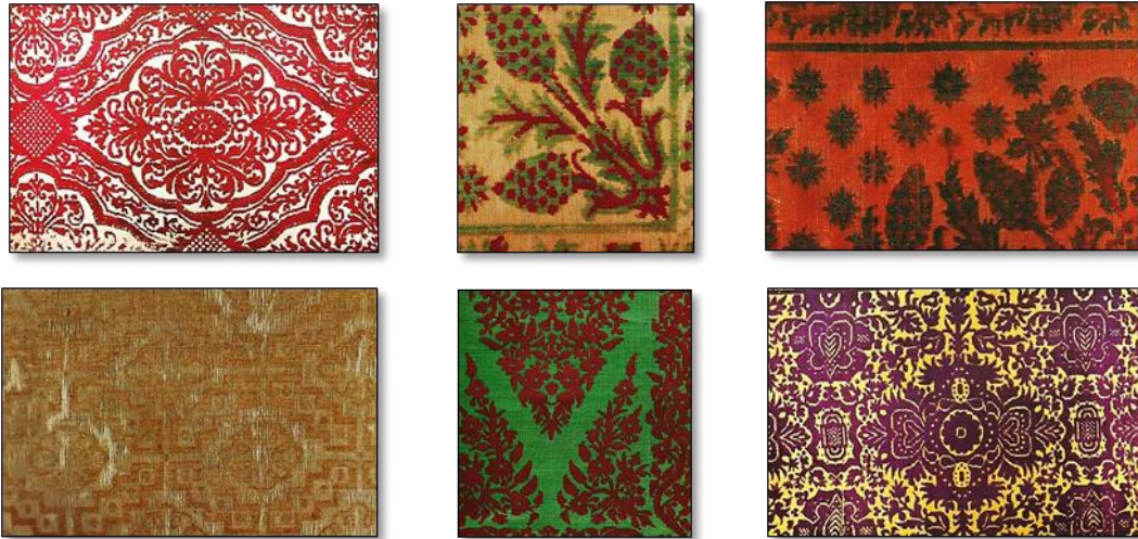
Resim 15. Çatma Dokuma Kumaş Örnekleri.

Bursa, Bilecik ve Üsküdar çatmaları dünyaca ün yapmışlardır. Sade çatma, münakkaş çatma (desenli), müzehhep çatma (gümüş ve altın alaşımli tellerle dokunmuş) olarak isimlendirilen bu çatmaların (1481-86) sancağa çıkan şehzadelere verilen eşyalar arasında “Mirahuri Kaftan Bursa Çatma Kadifesindedir ki altunludur” şeklinde arşiv kayıtları bulunmaktadır. 22