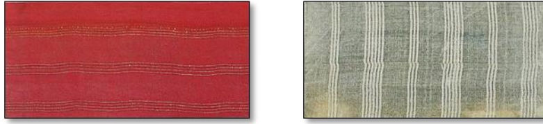
Resim 19. Canfes Dokuma Kumaş Örnekleri.

Canfes: Bir tek kat çözgü, tek kat atkı sıra ile örgü gibi dokunur. Eskinin mat, düz ipekli kumaşlarındandır. Kadın elbiseleri ve kaftanlarının etek içi, kol ağzı ve önlerini astarlamak için kullanılır. Yanar döner, kumru göğsü, dama taşı gibi çeşitleri bulunmaktadır. 27