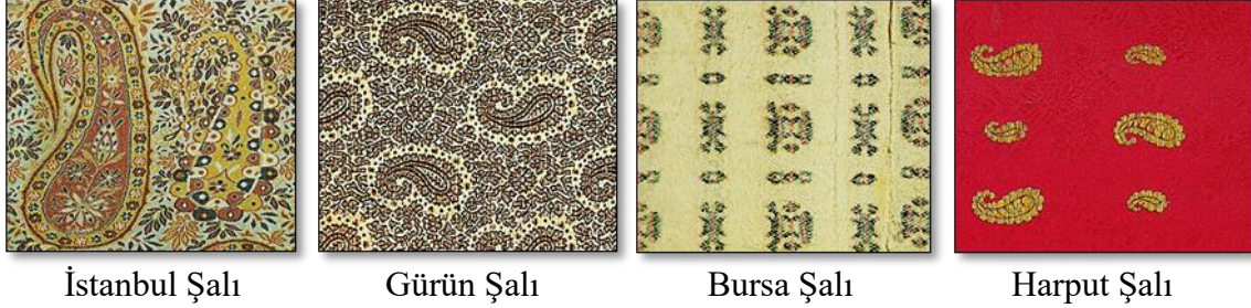
Resim 10. Şal Dokuma Kumaş Örnekleri.

da dokunmuştur. Çubukların incelik ve kalınlığına, renklerine, badem şekilli çiçek motiflerinin kompozisyonlarına göre de şallar “anberser”, “göbekli”, “rizâî”, “potalı”, “valide şalı” gibi isimler almışsa da daha çok dokundukları yere göre aldıkları isimlerle gruplandırılmaktadır. Nebâti boyalarla boyanan şalların renklerini asırlar boyunca koruduğu ve kumaş olarak da kolay eskimeyeceği görülmektedir. Şal taklidi dokunmuş kumaşlara “Şalâki” dendiği gibi yine tiftik yapığadan dokunmuş ancak deseni şala benzemeyen kumaşlara da “Şali” denmektedir. Şalın, kaftandan kavuk sargısına, kuşağa, seccadeden yatak örtüsü, perde, bohça ve yorgan yapımına kadar geniş bir kullanım alanı bulunmaktadır. 17