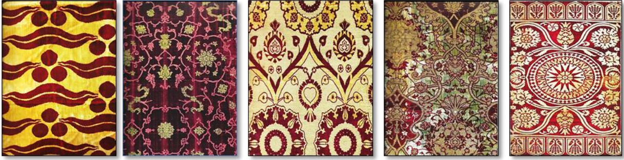
Resim 14. Kadife Dokuma Kumaş Örnekleri.

Çatma: Dokunuş ve tekniği itibariyle kadifenin bir cinsi olup, kabartma desenlidir. Çatmanın kadifeden farkı, zemine oranla süsleme havının yüksek oluşudur. Çatmalar kaftan yapımında, divan, yastık yüzleri gibi mefruşat eşyası olarak, at koşumlarında, kitap ve silah kapları, yorgan yüzleri olarak da kullanılmıştır.