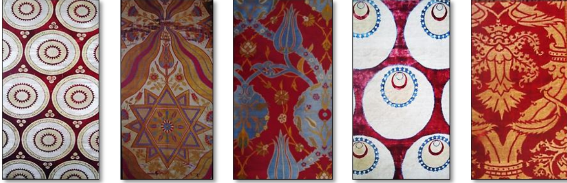
Resim 28. XVI. yy Osmanlı Kumaş Desenleri.

Daha çok 17.yy ilk yarısına ait çatma ve yastık yüzlerinin özelliğini teşkil eden ve sayısız örnekleri özellikle batı müze ve koleksiyonlarında bulunan bu grubun daha erken örnekleri, açık kırmızı zemini sık ve ince dokunmasıyla dikkati çeker. 35 15.yy ikinci yarısına ait kaftanların pars beneği ve kaplan çizgisi deseni, 16.yy başında da kumaşları süslemiştir. Bu dönemin kumaş desenlerinde üçlü benekler yalnız olarak tercih edilmiştir.