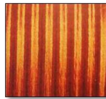
Bağlamalı Sarı Tas