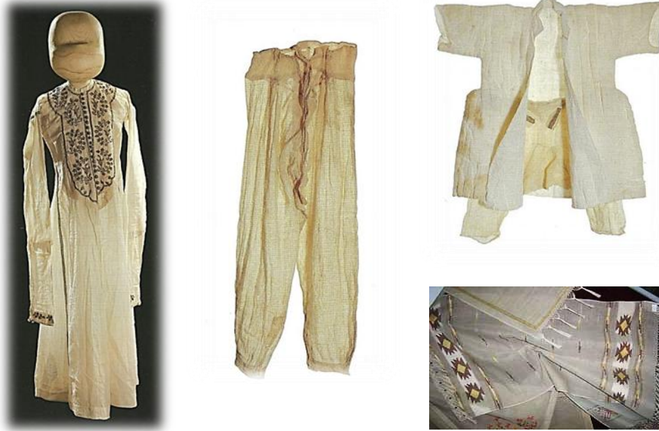
Resim 3. Pamuklu Dokumaların Kullanım Alanlarından Örnekler.

Anadolu'da pamuklu kumaş sanayiinde uzmanlaşmış belli bölgeler, iç talebi karşıladıktan sonra bir dereceye kadar dış pazarlar, özellikle de pamuk yetişmeyen kuzey memleketleri ve Avrupa için üretim yaparlardı. Üretim ve ticaret boyutları ile pamuklu sanayii hububattan sonra ekonominin en önemli sektörünü oluşturmaktaydı. 7