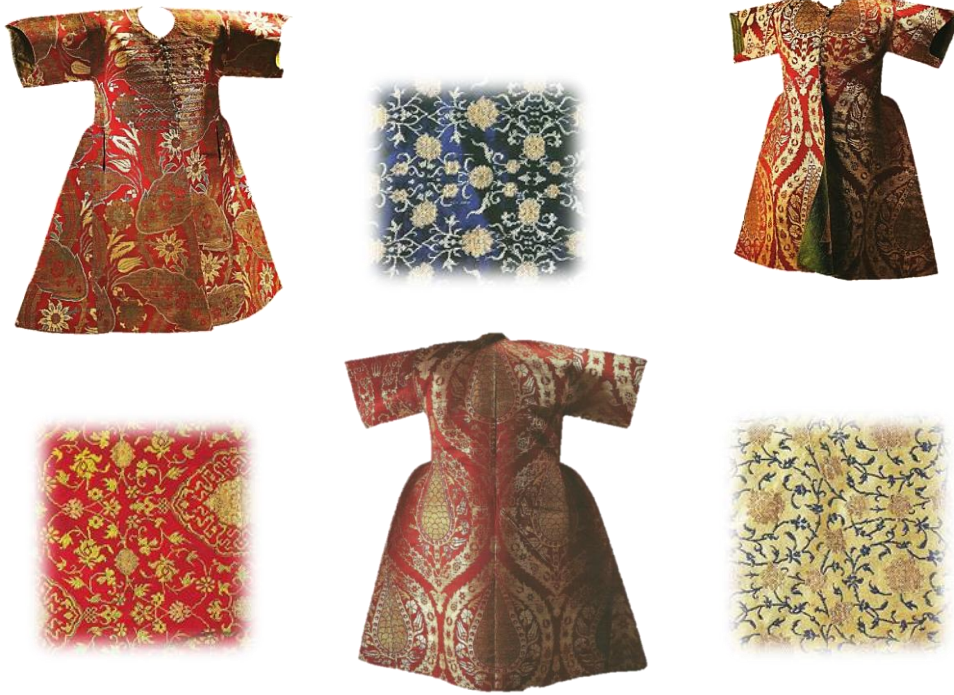
Resim 13. Kemha Dokuma Kumaş ve Kaftan Örnekleri.

İstanbul'daki saraya bağlı dokuma atölyelerinin yanı sıra, Bursa, Edirne ve Amasya'da dokunmuştur. 20