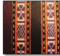
Çiçekli Vişneli Ful