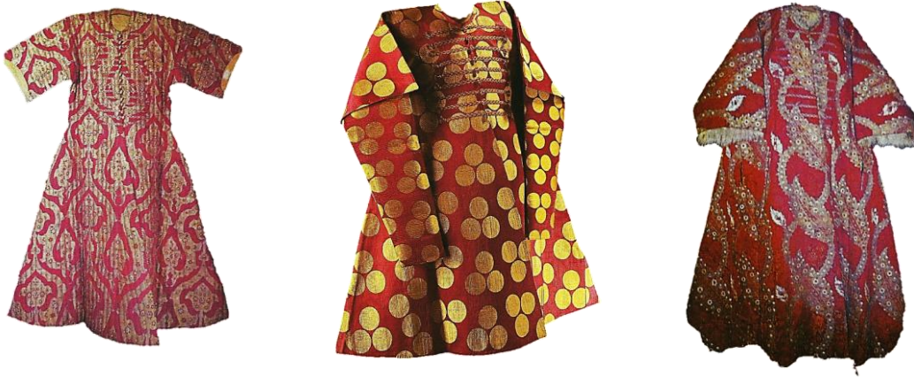
Resim 22. Serik Dokuma Kaftan Örnekleri.

Serik: 16. yy dan sonra rastlanan, kaftan yapımında, tel yerine sarı ipek kullanılan kalın desenli bir kumaştır. Desenler ekseri çiçek veya beneklerden oluşur ve dokunmasında zengin malzeme kullanılır. Serik, aslında üç renk anlamına gelir, fakat sonradan daha çok renk kullanılmış ve altın tel yerine sarı ipek kullanılan kumaşa bu ad verilmiştir. 30