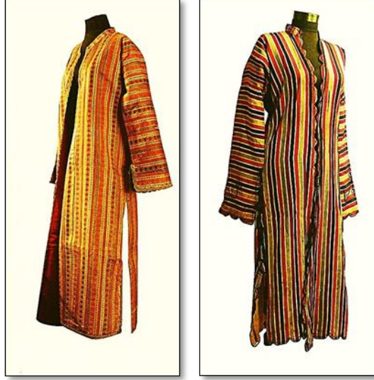
Resim 5. Kutnu Dokuma İle Hazırlanmış Kadın Giysileri.

Kutnu dokumaların kadın giyiminin yanı sıra kürklerin astarlanmasında, dekoratif amaçlı olarak, perde, koltuk, kanepeler, yastık örtüleri yapımında da kullanıldığı görülmektedir.