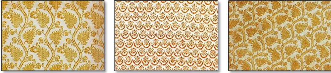
Resim 16. Abanî Dokuma Kumaş Örnekleri.

Atlas: Avrupa'nın saten dediği en eski ipekli dokuma tekniğidir. Atkı telleri gizli kaldığından çözümlü ipleri yan yana gelerek parlaklık verir. İpeğin parlaklığını en iyi gösteren kumaş türü olduğundan özellikle 14. Ve 15. Yy larda ipek dokuma ile uğraşan bütün ülkeler atlas dokumaya yönelmişlerdir. 25 Osmanlılar 17. Yy'a kadar bu dokuma türüne rağbet etmemişler İran, Şam ve Venedik'ten getirtilen atlasları tercih etmişlerdir. Daha sonraları Bursa, İstanbul, Alaşehir ve Maraş imparatorluk içinde atlas dokuyan merkezler olmuşlardır. Padişah kaftanlarında kırmızı, mavi, yeşil kullanılmış olup desenli, taraklı ve yollu atlas çeşitleri dokunmuştur. 26