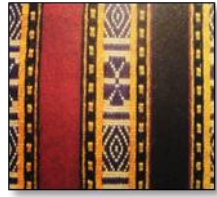
Çiçekli Kırmızılı Ful