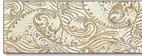
Resim 12. İpek Klaptan Örnekleri.

Kemha: Arşiv kayıtlarında çatma ve kadife ile beraber çok sık adı geçen ve özellikle kaftan yapımında kullanılan bir kumaş türüdür. Kemhanın çözgüsü ve atkısı ipek, deseni yapan takviye atkısında ayrıca gümüş veya altın alaşımlı telle çok sık dokunmuş ipekli bir kumaştır. Kemhanın deseni çözgü yüzlü saten üzerine ipek ve klaptan takviyesiyle dokunur ve çok kompleks bir teknik gösterir. Kalın ve sık dokunmuş olması sebebiyle, üst kaftan yapımına çok elverişlidir. Avrupa'da "Ottoman Gros Grain" adı ile ünlenmiştir.