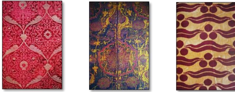
Resim 27. XV. yy Osmanlı Kumaş Desenleri.

Kumaş dokuma sanatı, deseni yaratan nakkaşların ve o deseni dokuyan dokuma ustalarının uyumlu çalışmalarından oluşan kompleks bir sanat koludur. Ustalıkla çizilen desenlerin uygulanması, ancak usta dokumacılar sayesinde gerçekleştirilir. Osmanlı imparatorluğunda sanat erbabının iyi örgütlenmesi sayesinde usta-çırak ilişkileri çok iyi gelişmiş ve çok sayıda hünerli usta ve sanat erbabı yetişmiştir. Fatih Sultan Mehmet'in kurduğu merkezîyetçilik sistemi içerisinde Yeni Saray da kurulan Saray nakkaşhanesi imparatorluk sınırları içinde değişik sanat kollarında değişken olmayan üslup ve bezeme motiflerinin egemen olmasını sağlamıştır. Beylikler devri diye adlandırılan, Osmanlı devletinin kurulduğu ve kısa zamanda geliştiği 14.yy Anadolu'nun tam bir kargaşa, savaş ve istila dönemine rastlar. Selçuklu kültürünü devralan ve ona kendi sanat anlayışını katarak Osmanlı sanat ve kültürünün temellerini atan Erken Osmanlı devrine ait diğer sanat dallarındaki eserler zamanımıza kadar geldiği halde, kumaş örnekleri zamanımıza ulaşmamıştır.