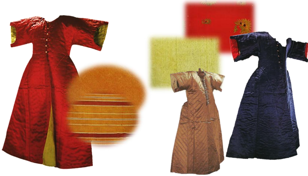
Resim 17. Atlas Dokuma Kumaş ve Kaftan Örnekleri.

Atlas: Avrupa'nın saten dediği en eski ipekli dokuma tekniğidir. Atkı telleri gizli kaldığından çözümlü ipleri yan yana gelerek parlaklık verir. İpeğin parlaklığını en iyi gösteren kumaş türü olduğundan özellikle 14. Ve 15. Yy larda ipek dokuma ile uğraşan bütün ülkeler atlas dokumaya yönelmişlerdir. 25 Osmanlılar 17. Yy'a kadar bu dokuma türüne rağbet etmemişler İran, Şam ve Venedik'ten getirtilen atlasları tercih etmişlerdir. Daha sonraları Bursa, İstanbul, Alaşehir ve Maraş imparatorluk içinde atlas dokuyan merkezler olmuşlardır. Padişah kaftanlarında kırmızı, mavi, yeşil kullanılmış olup desenli, taraklı ve yollu atlas çeşitleri dokunmuştur. 26