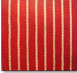
İnce Kalem Meydaniye

İnce Kalem, Şalşapik, Enli Şalşapik, Kırmızılı Osmaniye, Elvanlı, Dişli, Yeni çizgi gibi bugün hala dokunan, Kürdiye, Rahvancı, Bağlamalı Meydaniye gibi artık üretilmeyen çeşitleri bulunmaktadır. 14