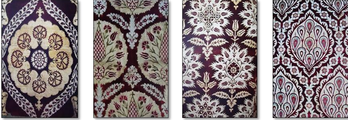
Resim 31. XVII. yy Osmanlı Kumaş Desenleri.