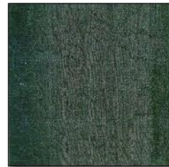
Resim 9. (sağ) Kirpas Dokuma Kumaş Örneği.

Şal: Tiftik keçisi yününden dokunmuş ve çubuklar arasında resmedilmiş çiçek motifleri ile özellikle badem şekilli motifleri kendine has güzellikte yünlü bir kumaştır. İpek karıştırılarak