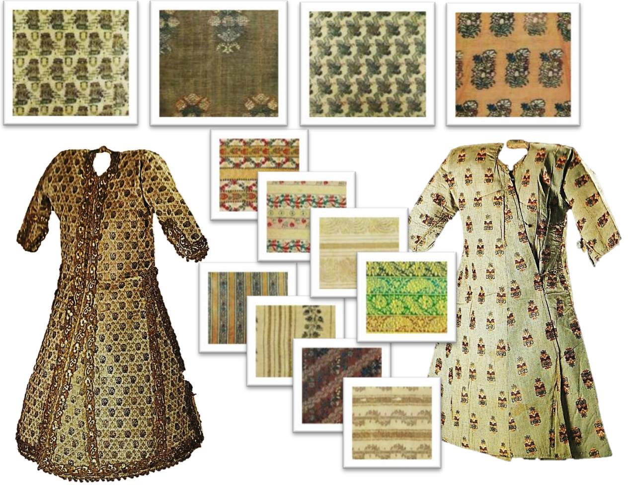
Resim 23. Savaî Dokuma Kumaş ve Kaftan Örnekleri.

Seraser: Bu dokuma türünde desen, altın alaşımlı telin sarı ipeğe, gümüş telin ise fildişi renginde ipek iplik etrafına sarılması ile dokunur. Bunun sebebi, değerli metali israf etmemek içindir. En pahalı ve değerli kumaş olan seraserin çözgüsü ipek, atkısı altın alaşımlı gümüş veya doğrudan doğruya gümüş veya altın tel kullanılarak dokunur. Seraser ile kemha arasındaki fark, seraserin telle, kemhanın ise klaptanla dokunması ve desenlerinin farklı olmasındandır. Seraser adı, “baştanbaşa” anlamına gelir ki, desen bir eni kaplayacak şekilde ve kumaşın değerli tellerini gösterecek tarzda çizilmiştir. Seraser kumaşının en göze çarpan özelliği, altın ve gümüş tellerin hakimiyeti, konturların bir renk ipekle belirtilmesi, desenin şaşılacak kadar sade, fakat görkemli oluşudur. Sultanların yabancı hükümdar veya elçilere verdiği kıymetli hediyeler arasında seraser kaftanlar başta gelirdi. 32