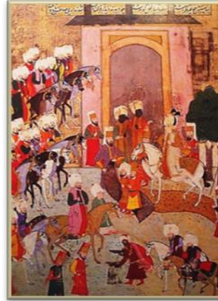
Resim 25. (Sol) Şehzade Mehmed'in At Meydanı'ndaki İbrahim Paşa Sarayı'na Gelişi, Surname, TSMK, H.1344, y.12a.