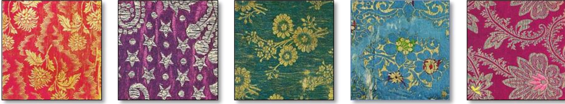
Resim 21. Şib Dokuma Kumaş Örnekleri.

Serik: 16. yy dan sonra rastlanan, kaftan yapımında, tel yerine sarı ipek kullanılan kalın desenli bir kumaştır. Desenler ekseri çiçek veya beneklerden oluşur ve dokunmasında zengin malzeme kullanılır. Serik, aslında üç renk anlamına gelir, fakat sonradan daha çok renk kullanılmış ve altın tel yerine sarı ipek kullanılan kumaşa bu ad verilmiştir. 30