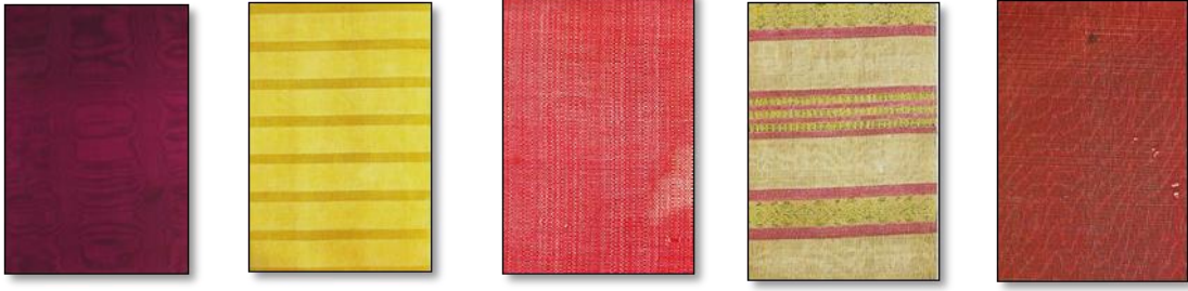
Resim 18. Gezi Dokuma Kumaş Örnekleri.

Canfes: Bir tek kat çözgü, tek kat atkı sıra ile örgü gibi dokunur. Eskinin mat, düz ipekli kumaşlarındandır. Kadın elbiseleri ve kaftanlarının etek içi, kol ağzı ve önlerini astarlamak için kullanılır. Yanar döner, kumru göğsü, dama taşı gibi çeşitleri bulunmaktadır. 27