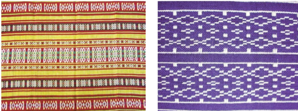
Şekil 6. Beledi Dokumaları, malzeme, pamuk, ipek. Saim Bayrı, 2005.

Tire Beledi Dokumaları diğer geleneksel el dokumalarından farklı olarak çift katlı dokumalardır. Kumaşın alt katı astar olarak nitelendirilebilirse de iki yüzü de kullanıma uygundur. Dokumanın alt tarafı, ikinci katın çözgüsünün beyaz olması nedeniyle ve desen özelliklerine de bağlı olarak beyaz renk ağırlıklıdır. Birinci katın çözgü renginin siyah olduğu özgün örneklerde atkı rengi olarak en çok kırmızı sarı, yeşil, lacivert ve mavi kullanılmaktadır. Renkler desen özelliğine göre bir arada kullanıldıkları gibi, özellikle beyaz çözgü rengi ile zıtlık oluşturacak şekilde tek başlarına da kullanılmıştır. Örgüsü bezayağı olan dokumalar enine çizgili özellik göstermekte olup, desenli kısımların olduğu bölümler dışındaki alanlar çift katlı torba yapıdadır. "Eski örneklerini incelediğimizde Beledi dokumalarının eni 1304 ya da 1306 çözgü telinden oluşan, 62 cm genişliğinde, çift katlı dokunmuş kumaşlar olduğunu görmekteyiz" (Sürür, 1984, aktaran; Özdemir, 2022, s. 117). "Bu dokumalarda görülen başlıca motifler bademli, kutulu, celepiş, tireiş, aynalı ve yıldızlıdır. Bunların dışında farklı isimlerle adlandırılan ve hiç isim verilmemiş motifler de vardır" (Sürür, 1984'den aktaran; Özdemir, 2022, s. 117).