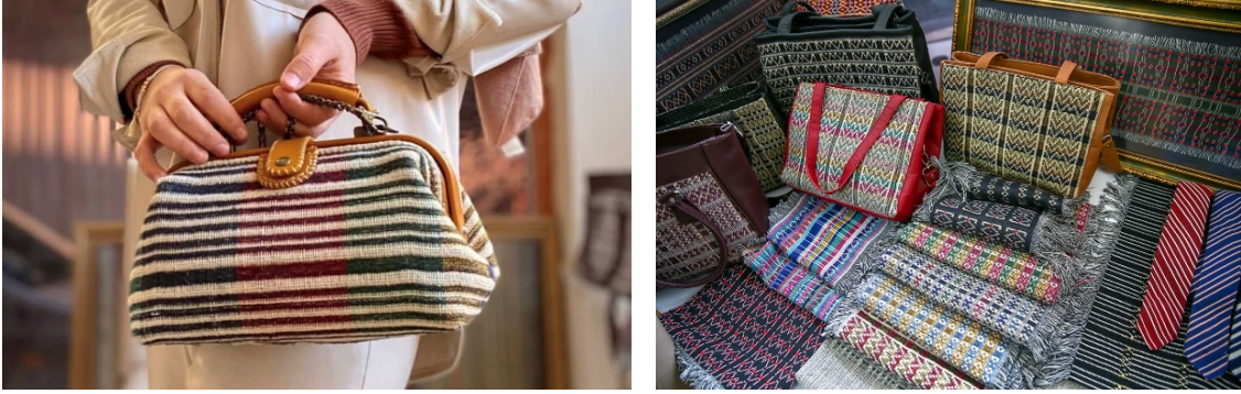
Şekil 8. Nurefşan Yaylak ve Atölyesi (Fidan ve Ayvalı, 2021).

Saim Bayrı Beledi dokumalarının nasıl dokunduğunu ve tüm tasarım ve üretim tekniklerini süreç içerisinde kızı Gülnur Yaylak ve torunu Nurefşan Yaylak'a da öğretmiştir. Bugün Beledi dokumaları Ethem Tıyrıdak'ın 2019 yılında vefatı nedeniyle Gülnur Yaylak tarafından Tire Belediyesi ve Tire Ticaret Odası'nın desteği ile Tire Belediyesi Kent Müzesi'nde, Nurefşan Yaylak tarafından KOSGEB desteği ile kurmuş olduğu kendi atölyesinde yaşatılmaya ve gelecek kuşaklara aktarımının devam ettirilmesine çalışılmaktadır.