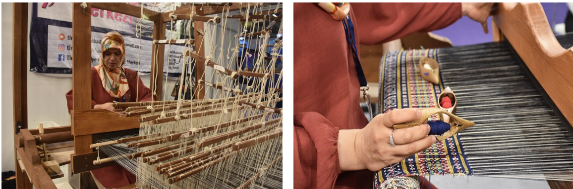
Şekil 9. Gülnur Yaykal tarafından verilen beledi dokuma eğitimi (Fashion Prime'da Tireye Özgü, 2019).

Saim Bayrı'nın kızı Gülnur Yaylak ise Usta Öğretici Belgesine sahip olması nedeniyle Tire Belediyesi Kent Müzesi'nin ücretli çalışanı olarak Beledi dokumaları üretmektedir ve zaman zaman gelen kursiyerlere