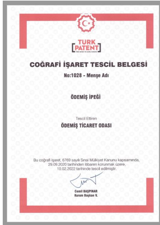
Şekil 5. Ödemiş İpeği Coğrafi İşaret Tescil Belgesi, (Ödemiş Ticaret Odası, t.y.).