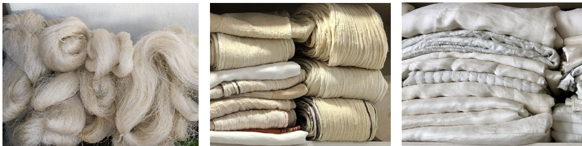
Şekil 2. a) İpek iplik çileleri, Ödemiş İpek Mağazası, 2022. b) Ödemiş ipekli kumaşları, pembezar, yağlık vb. Ödemiş İpek Mağazası, 2022. c) Günümüz ev tekstili ipekli kumaşları, Ödemiş İpek Mağazası, 2022.

İpek böcekçiliği yetiştiriciliği zahmetli bir bakım süreci ile evlerde iş paylaşımı ile üretilmiştir. İpek böceklerinin koza yapım aşamasına kadar sağlıklı bir bakım süreci gerekirken bu ihtiyaç taze dut yapraklarının temini ile sağlanmıştır. Bu nedenle her ailenin kendine ait dut bahçeleri olmuştur. Üretilen ipekler, iplik olarak satılabildiği gibi dokunmuş kumaş olarak da satılmıştır. İplik çilelerinin bir kısmı ise ihtiyaç halinde satılmak üzere sandıklarda bekletilmiştir. Aile ekonomisinde, ipekböcekçiliğinin başlıca avantajları arasında 35-40 günde sonuç vermesi, diğer tarımsal faaliyetlerin işgücü ihtiyacının az olduğu bir dönemde yapılması ve üreticinin ürünü nakit olarak değerlendirmesi sayılabilir (Özkavruk Adanır vd., 2013). Bu nedenle yöre halkının bir nevi kenarda beklettiği altın akçesi olan bu ipek iplik çileleri her zaman paraya dönüştürülebilir nitelikte değerli olmuşlardır. Çünkü genç kızlar, çeyiz hazırlama süreçlerinde yağlıklarını, peştemallerini, çarşaflarını, örtülerini kendi ürettikleri ya da satın aldıkları ipek ipliklerle dokumuşlardır (bkz. Şekil 2a).