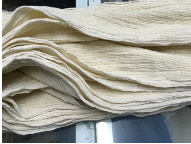
Şekil 3. %100 İpek pembezar kumaş topu, Ersoy İpek.

pembezar (bkz. Şekil 3), ipek mendil (yağlık), peştamal, idare bezi, çiğ çarşaf (bkz. Şekil 4a ve Şekil 4b), puşi, bürdü, bürümcük, göynek bezi olarak bilinen kumaşlardır (Sezgin, 2000, s. 253, 254; Yaşar ve Batur, 2016, s. 436). Bu kumaşlar atkı ve çözgüsü ipekten üretildiği gibi pamuk ile de dokunmuştur. Kumaşlar genel olarak 40 cm eninde dokunmuşlardır. Pembezar, bürdü bürümcük gibi çeşitlerinde atkı ipliği olarak yüksek bükümlü ipek iplik kullanıldığından kumaşların enleri yıkandıktan sonra daralmakta 20 cm'e kadar düşmektedirler. Yüzyıllar boyunca 40 cm veya 20 cm eninde olan geleneksel ödemış ipeklileri, kullanılacak alana göre iki, üç veya dört boy yana dikilerek gömlek, başörtüsü, çarşaf vb. olarak kullanılmıştır.