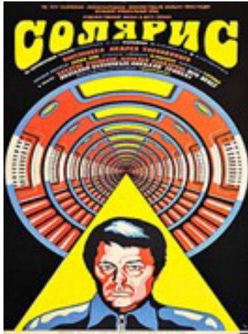
Solaris Film Afışı

Stanislav Lem'in aynı isimli romanından uyarlanan Solaris'in çekirdeğinde, tuhaf olayların yaşandığı ve bu olayların hiçbir rasyonel açıklamasının yapılamadığı bir gezegen olan Solaris vardır. Solaris evreni sislerle örtülü bir gezegendir. Bu gezegen tuhaf bir okyanusla kaplıdır ve bu tekinsiz okyanus düşünebilen, hareket eden, algı yaratabilen, “omnipotent” bir varlıktır. Kendini “keşfe” gelen insanoğluna, onların geçmişinden ve bilinçlerini oluşturan vicdanlarından birer ziyaretçi göndererek onları anlamaya çalışır. Bu dışsal varlık adeta insanı anlamının yolunun onun kalbinden ve vicdanından geçtiğini anlamıştır.