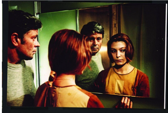
Solaris'ten Bir Sahne