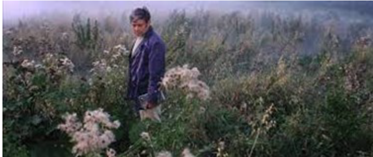
Solaris’ten Bir Sahne

Filmde Tolstoy ve Dostoyevski’nin sözlerinden yapılan göndermeler, filmin şiirsel niteliğini güçlendirirken vermek istediği mesajı da ortaya çıkarır. “İnsanın insana ihtiyacı vardır.” Kelvin, filmin sonlarına doğru insanı ve utancını sorgularken; insanın kurtuluşunun utancında olduğunu söyler. Bunda Hari’nin intiharı ve Kelvin’in içine düştüğü boşluk önemli etkenlerdir. Bir amaç için Solaris’e gönderilmiş Kelvin, hiç ummadığı durumlarla bu gezegende karşılaşır ve gemideki diğer bilim adamlarının aksine, Solaris’i yok etmek için çabalamaz, onu anlamaya çalışır çünkü sevdiği kadını geri kazanmak ister.