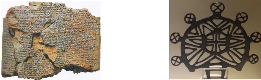
Şekil 3. Kadeş Antlaşma Metni'nin Kopyası

Günümüzde Hititlere ait en önemli bilgilere Başkent Hattuşa’da (günümüzde Çorum ili Boğazköy çevresi) yapılan arkeolojik kazılardan ulaşmaktayız. Gerçek’e göre (2020:1) Arkeolojik kazılar ve yüzey araştırmalarında tespit edilen pişmiş toprak, metal, taş malzemelerle beraber orthostat, stel, kaya anıtları üzerindeki tasvirler ve yazıtlar, Hitit Uygarlığı’nın tanınmasında önemli katkılar sağlamışlardır.