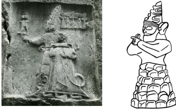
Şekil 1. Tanrı Şarruma'nın Kral Tudhaliya'yı Kucaklama Sahnesi

ister istemez bunun etkisine girmişlerdir (Çağlayan, 2017: 29). Bu etkinin o dönemde Anadolu'da yaşamını sürdüren Hattilerden kaynaklı olduğu düşünülebilir.