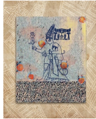
Şekil 20. Naile Çevik, Hitit Serisi II, Karışık Teknik , 35x50cm., 2022