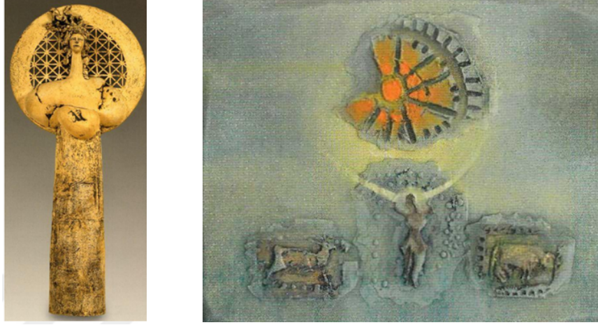
Şekil 13. Hitit Güneş Kursu ve Ana Tanrıça Çalışması , Erdiñç Bakla, Seramik.