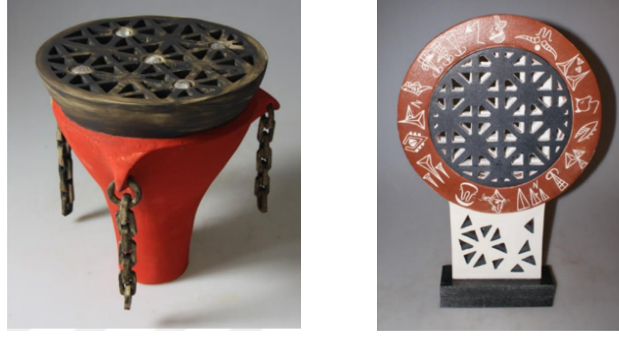
Şekil 15. Güneş Kursu ve Hiyeroglif Yazıların Seramiğe Aktarımı , Meryem İcenli, Serbest Şekillendirme, 50x30x7 cm., 2016