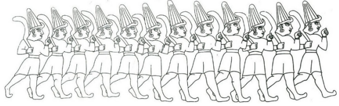
Şekil 9. Oniki Tanrı Kabartması, 13. Yüzyıl, Yazılıkaya