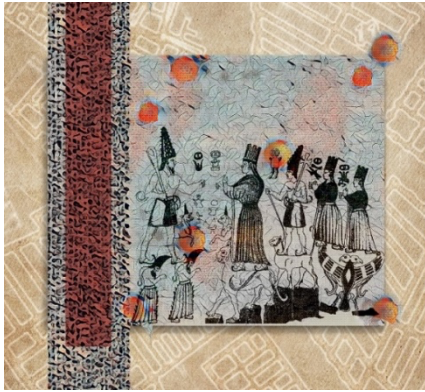
Şekil 19. Naile Çevik, Hitit Serisi I, Karışık Teknik , 40x40cm., 2022

Naile Çevik, Şekil 19 ve 20'de Yazılıkaya Hitit Kaya Tapınağı'nda yer alan duvar kabartmalarından esinlenmiştir. Bu kabartmaları, dönemin insanların kendilerini ifade etme biçimi olarak da değerlendirmek mümkündür. Şekil 19'de kompozisyonun sol tarafında ve Şekil 20'de ise alt tarafında stilize edilmiş çivi yazıları kullanılmıştır. Boşluk/doluluk sanatsal düzenleme öğeleri bakımından değerlendirildiğinde oldukça önemlidir. Dolu alanlar, boş alanları tamamlarken, tüm mekânı bir bütün olarak oluşturmaktadır (Bingöl ve Durlu Özkaya, 2020: 180).