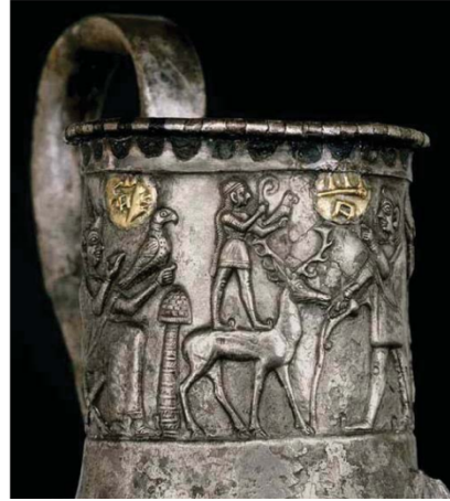
Şekil 6. Geyik Biçimli Gümüş Riton, Detay