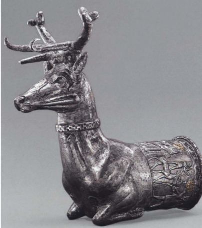
Şekil 5. Geyik Biçimli Gümüş Riton, M.Ö. 14-13. Yüzyıl

Güneş birçok uygarlıkta önemli bir simge konumundadır. Hititlerde Güneşin doğuşu kutsal bir olay olarak yorumlanmıştır. Hitit kralları gün doğumunda güneşe dönerek günlük dini törenlerini yapmışlardır ve Güneş Tanrıçası Arinna, özellikle bereketle ilişkilendirilmiştir (Eyuboğlu, 1981: 455; Uncu, 2013: 355-356). Bu noktada güneşi simgeleyen daire formu Hitit güneş kursları önemli ve üzerinde durulması gereken arkeolojik buluntular arasında yer almaktadır (Şekil 4). Güneş kursları ya da güneş sancakları, güneşi ifade eden dairesel biçimin etrafına yerleştirilmiş öğelerden oluşmaktadır. Örneğin; ses çıkarması için sallanan parçalar ve geyik, kuş, ağaç figürleri vardır. Ayrıca güneşi simgeleyen bu sancakların taht biçimindeki mobilyalara takılmasının yanı sıra dini törenlerde ve at koşum takımlarında kullanıldığı düşünülmektedir (Çağlayan, 2017: 146).