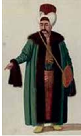
Sır Kâtibi 136