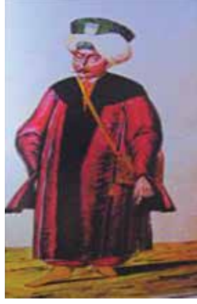
Sır Kâtibi 134 ve Yamağı 135