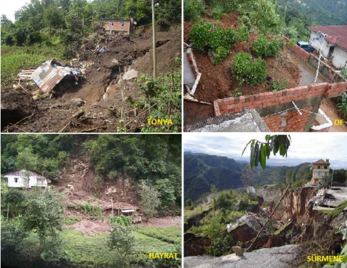
Resim 1. Trabzon ilçelerinde meydana gelen heyelanlar