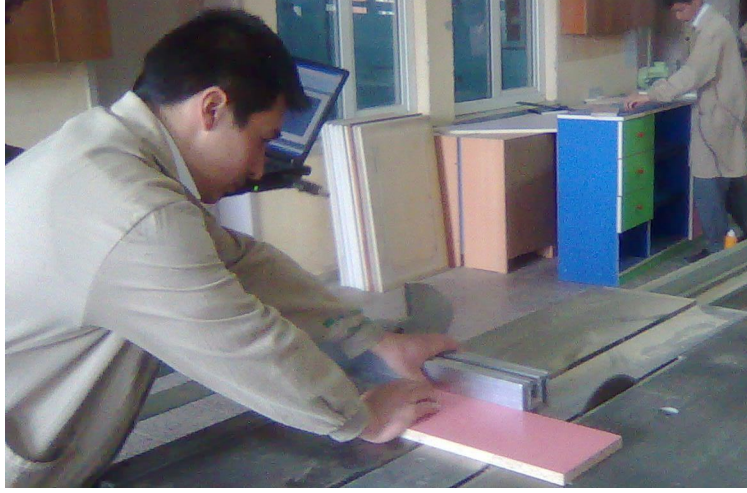
Şekil 3. Gürültü ölçümü yapılırken

Gürültü ölçümlerinde temel olarak iki farklı cihaz kullanılır. Bunlar, anlık gürültü ölçüm cihazı ve uygun dozimetrelerdir. Bu çalışmada anlık gürültü ölçüm cihazı ile belirli bir noktadaki ses basınç seviyesini ölçerek desibel cinsinden sonuçlar elde edilmiştir. Ölçümler, çalışanların kulak hizasından ve cihazın 1m uzağından ses basıncı emilimini önleyecek şekilde yan durarak, mikrofon gürültü kaynağına dönük olarak yapılmış ve çalışanın işlem periyodu boyunca birlikte hareket edilmiştir. Kararlı gürültünün olduğu durumda anlık gürültü cihazı ile yaklaşık 1 dk. ölçüm alınması yeterli olmuştur (Şekil 3).