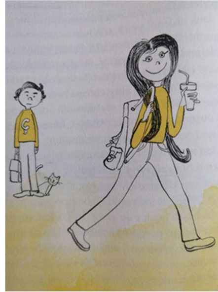
Resim 8: İncelenen eserde sayfa 28'deki görsel