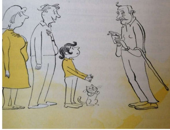
Resim 4: İncelenen eserde sayfa 56'daki görsel

Sayfa 56'da yer alan görselde, Ali'nin bilgisayarını almak için tek başına dedesinin evine gittiği ancak dedesinin bilgisayarını kaybettiği bölümün görseli yer almaktadır. Ancak burada da Ali'nin annesi Ayla Hanım ile babası Rıza Bey'in olmamasına rağmen onların da çiziminin yapıldığı görülmektedir.