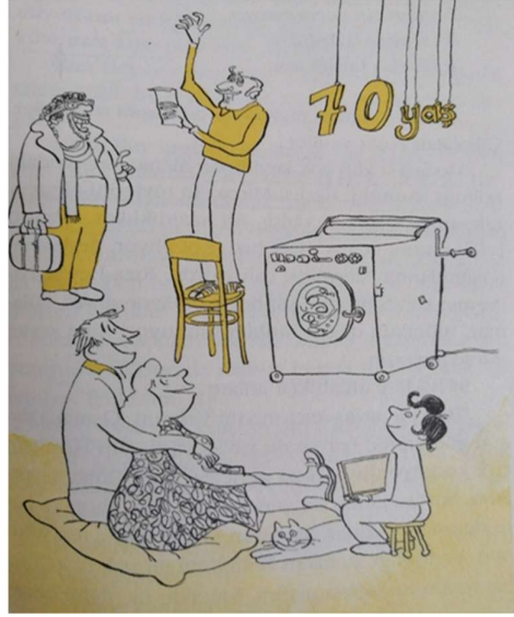
Resim 3: İncelenen eserde sayfa 45'teki görsel

Sayfa 56'da yer alan görselde, Ali'nin bilgisayarını almak için tek başına dedesinin evine gittiği ancak dedesinin bilgisayarını kaybettiği bölümün görseli yer almaktadır. Ancak burada da Ali'nin annesi Ayla Hanım ile babası Rıza Bey'in olmamasına rağmen onların da çiziminin yapıldığı görülmektedir.