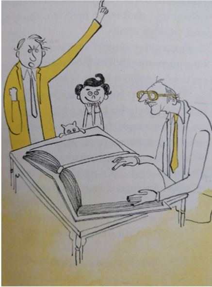
Resim 7: İncelenen eserde sayfa 21'deki görsel

Nitekim Ak'ın yazılı olarak sunduğu romanı görsel olarak da zenginleştirebildiği görülebilmektedir. Öyle ki yazarın içeriğe verdiği önem kadar çizgilerine de önem verdiği açıkça ortadadır.