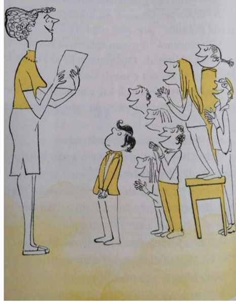
Resim 5: İncelenen eserde sayfa 62'deki görsel

Sayfa 78'de yer alan görselde, Ümitsu'nun ayağında sandalet olduğu söylenilmekte ancak ayağında normal bir ayakkabı olduğu görülmektedir. Ayrıca üzerinde Sedat Bey'in bir kere giyip, çöpe atmış olduğu kıyafetlerinden biri olan mavi puanlı gömlek vardır ve yine sarı renkle renklendirilmiştir; biraz bol bir görünümü ise sağlamıştır.