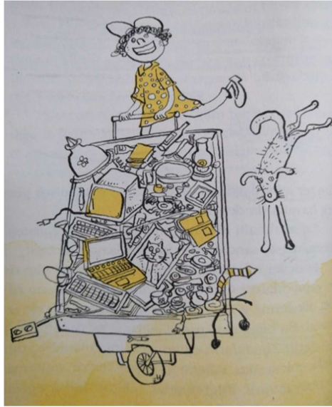
Resim 6: İncelenen eserde sayfa 78'deki görsel

Sayfa 78'de yer alan görselde, Ümitsu'nun ayağında sandalet olduğu söylenilmekte ancak ayağında normal bir ayakkabı olduğu görülmektedir. Ayrıca üzerinde Sedat Bey'in bir kere giyip, çöpe atmış olduğu kıyafetlerinden biri olan mavi puanlı gömlek vardır ve yine sarı renkle renklendirilmiştir; biraz bol bir görünümü ise sağlamıştır.