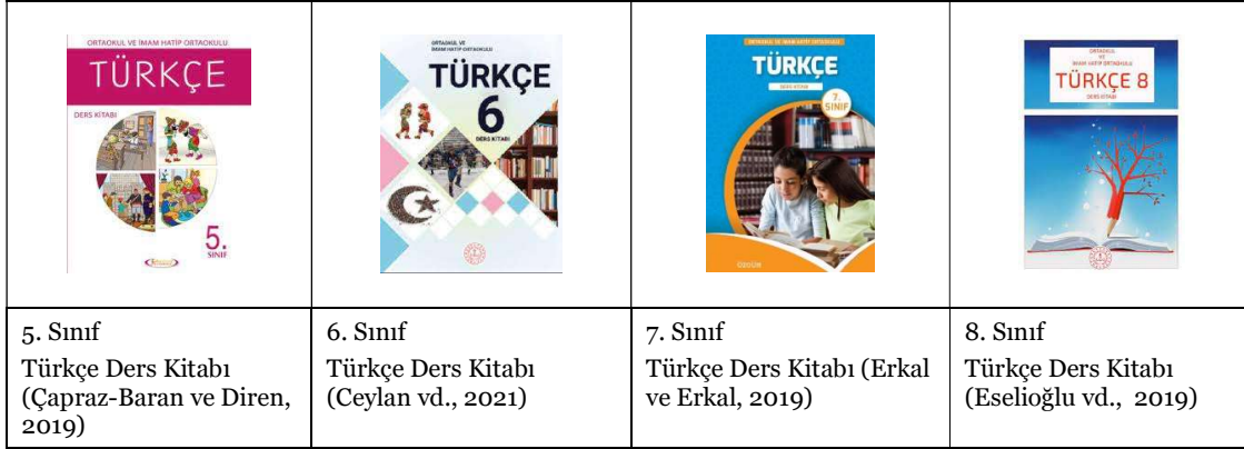
Görsel 3. Araştırmada kullanılan Türkçe ders kitapları

Boyacı, Güner ve Babadağ, 2017, s. 177-178). Bu çalışmada da 2020-2021 eğitim-öğretim yılında kullanılan 5. Sınıf Türkçe Ders Kitabı (Anıttepe Yayıncılık), 6. Sınıf Türkçe Ders Kitabı (Millî Eğitim Bakanlığı), 7. Sınıf Türkçe Ders Kitabı (Özgün Yayınları) ve 8. Sınıf Türkçe Ders Kitabı (Millî Eğitim Bakanlığı) inceleme nesnesi olarak alınmış ve bunlardan elde edilen veriler içerik analizi yöntemiyle analiz edilmiştir.