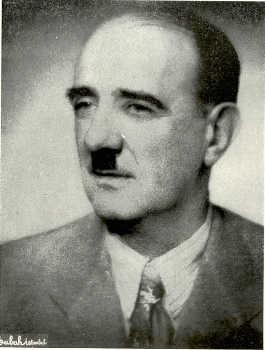
ORD. PROF. DR. M. FUAD KÖPRÜLÜ 4 Aralık, 1899 — 28 Haziran, 1966