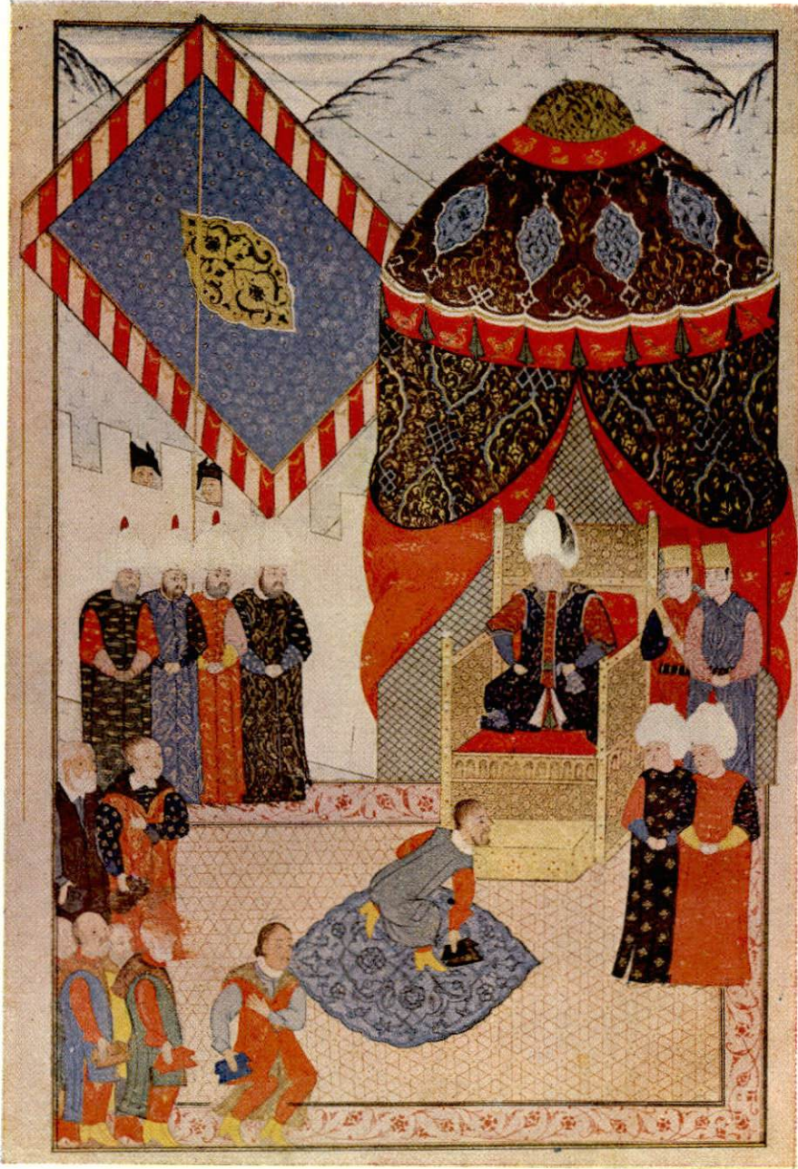
Kanunî Sultan Süleyman'ın Sigetvar seferine giderken Erdel beyi'ni kabulü, Bak. Feridün Ahmed, Nüzhetu'l-Ahbar der Sefer-i Sigetvar , v. 16 b, TSMK, Hazine 1339.