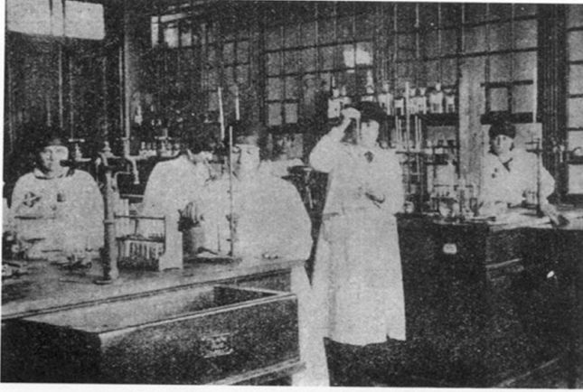
1922'de Darülfünun Fen Fakültesi Kimya Laboratuvarının kızlar bölümü.

Belge 1'de haftanın belirli günlerinde kadınlara verilen derslere girecek hocaların ve derslerin gerçekleşeceği günler gösterilmiştir. Kız öğrenciler için dersler Pazartesi, Çarşamba, Perşembe ve Cumartesi günlerinde yapılmaktadır. Derslerin içeriği ise sağlık, tarih, iktisat ve fen bilgisi ile ilgilidir.