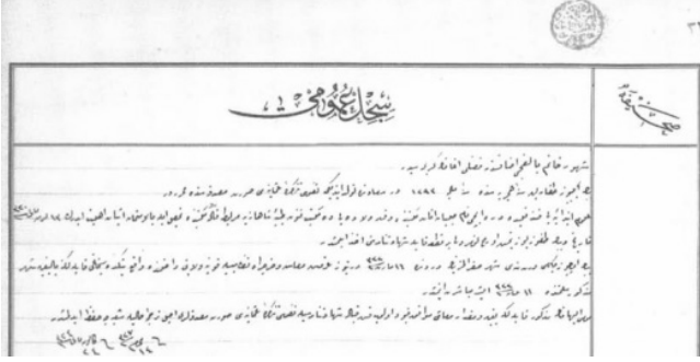
Belge 5: Ebe mektebinden mezun Şehver Hanım'ın sicili.

Belge 5'de Ebe Mektebi'nden mezun olan Şehver Hanım'ın bazı bilgileri bulunmaktadır. . Belge şu şekilde sadeleştirilebilir: