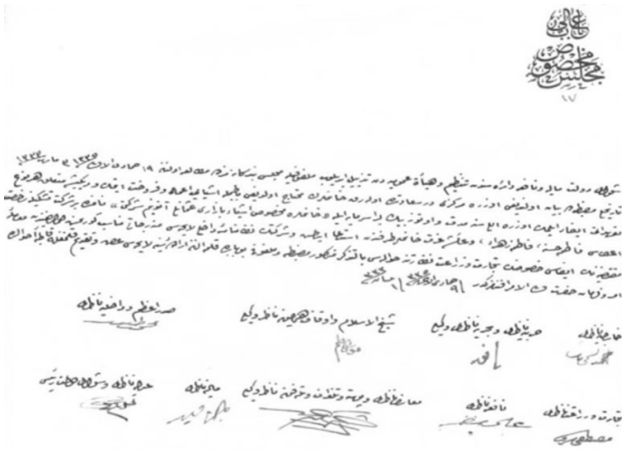
Belge 6: Üç kadının bir araya gelerek şirket kurması

"Şehver Hanım, balıkçı esnafından Fazlı Ağa'nın kızıdır. Bin iki yüz doksan beş hicri yılında 1293 mali yılında İstanbul'da doğduğu Osmanlı Nüfus İdaresi'nce tasdik olunmuştur. İlköğrenimini Fındıklı'daki Dereiçi adlı Kız Okulu'nda ve Askerî Tıp Okulu'na bağlı Kabile Mektebi'nde tüm sınavlarını vererek 13 Teşrin-i Sani [1] 320 tarih ve bin dokuz yüz yetmiş üç numaralı ebelik diplomasına maaş hakkı kazanmıştır. Bin üç yüz yirmi dört senesi, şehrin fethinin dördünde (İstanbul) 16 Mart [1] 322 dört yüz kuruş maaş ve yol harcırahı ile Konya ili dâhilinde bulunan Niğde sancağı ebeliğine tayinle adı geçen şehirde 11 Nisan [1] 322 tarihinde görevine başlamıştır. Yukarıda adı geçen söz konusu ebeliğe tayin ve maaş miktarı kayıt altına alınmış olup ebelik diplomasıyla Osmanlı nüfus belgesi suretleri asıllarıyla birlikte şubemizce muhafaza edilmiştir. Fi 14 Muharrem [1]327 / fi 24 Kanun-ı Sani [1] 324"