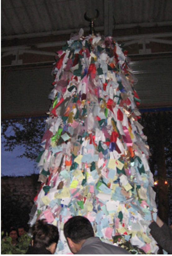
“2006 Ahırkapı Hıdırellez Şenlikleri’nde bulunan bir dilek ağacı”.

Yine eski Hıdırellezlerde olduğu gibi şenliklere gelenler yeni bir yıla dair “dilek”lerini, kağıtlara yazmakta ve bu kağıtları gül fidanlarının dibine bırakmakta ya da organizasyon ekibi tarafından hazırlanan ve “dilek ağacı”nı simgeleyen “nahıl”lara asmaktadırlar. Dilek kağıtlarının asıldığı bu nahıllar sabaha karşı eski İstanbul Hıdırellezlerinde olduğu gibi denize atılmaktadır.