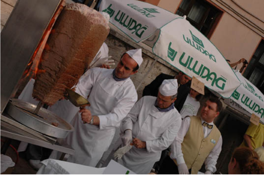
“2005 Ahırkapı Hıdırellez Şenlikleri”***

Örneğin 2010 yılında yapılan şenliklerde Fatih semtinde bulunan Türk ve İstanbul yemek kültürünü yaşatmaya çalışan “Hocapaşa”, “İstanbul Gurme”, “Sultanahmet Lezzetleri” ve “Ahırkapı” vb. marka olmuş, tanınan lokantalar bölgede stant açmıştır. Bu yiyecek ve içeceklerden dileyenler ya uygun fiyatlar karşılığında ya da ücretsiz olarak alabilmektedirler. Böylece şenliklere katılan semt sakinlerinin, yerli ve yabancı turistlerin yiyecek ihtiyacı karşılanmakta, hem de Türk yemek kültürünün tanıtımı yapılmaktadır.