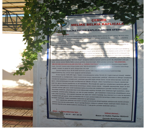
12. Fotoğraf: Melike Belkis Efsanesi'nin yazılı olduğu tabela