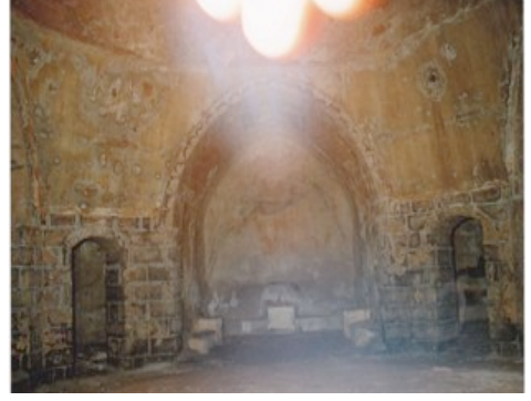
8. Fotoğraf: Saray Hamamı'nın İçi