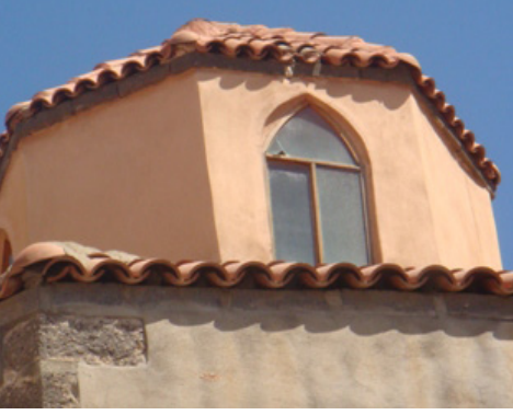
5. Fotoğraf: Saray Hamamı'nın üst bölümü