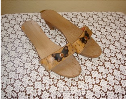
3. Fotoğraf: Gelinin hamam takunyası