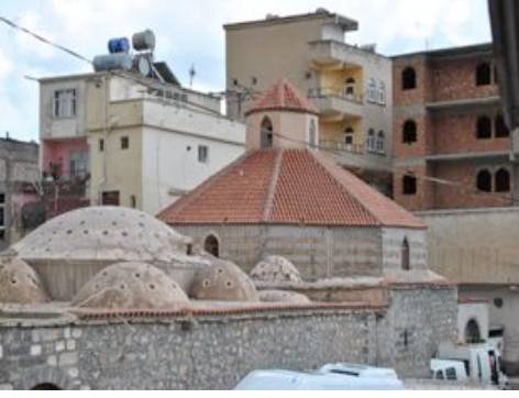
7. Fotoğraf: Saray Hamamı