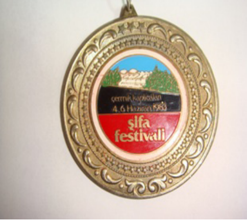
11. Fotoğraf: 1983 yılı festival madalyası