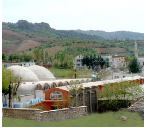
14. Fotoğraf: Melike Belkis Hamamı