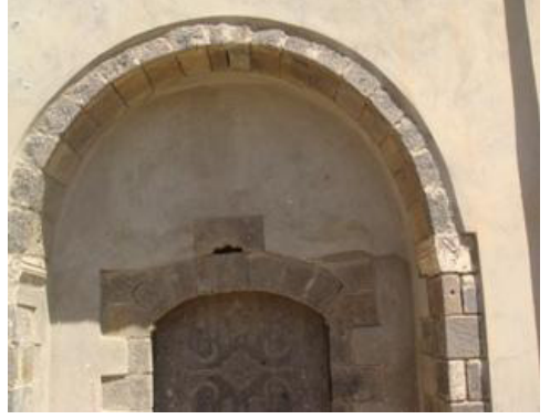
6. Fotoğraf: Saray Hamamı'nın giriş kapısı