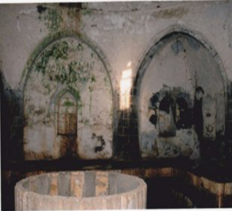
9. Fotoğraf: Saray Hamamı'nın İçi