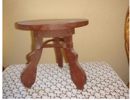
2. Fotoğraf : Gelin kürsüsü