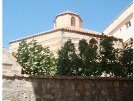
4. Fotoğraf: Saray Hamamı