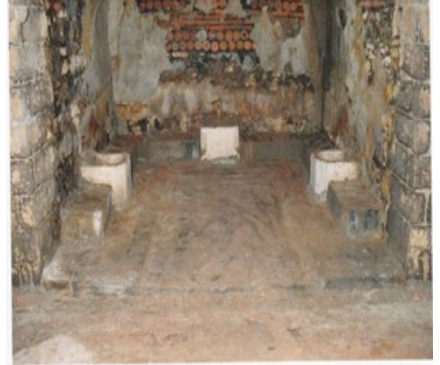
10. Fotoğraf: Saray Hamamı'nın İçi