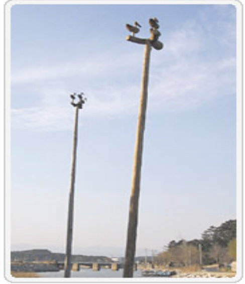
Şekil 1: ICOM 2004 Seoul Amblemi: Sotdae

Eski Türk boylarının kutsal sembollerinin hep doğan ve kartal türünden kuşlar olduğu (Ögel, 1993:593), Orta Asya Türk inanışlarında kartalın tanrı sembolü olduğu, Türk boylarının kendilerine birer yırtıcı kuşun ongun olarak seçtikleri bilinmektedir (Çal, 2011:236). Türk mitolojisine ve bu konuda yapılan alan araştırmalarına bakıldığında kuşlara ve kuş türlerine ilişkin farklı inanışlar vardır. Göktürk ve Uygurlarda kartal ve