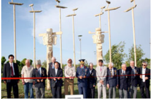
Şekil 1: Eskişehir Kent Park Sotdae ve Jang-Seung Heykelleri

alınarak toplumun birimleri oluştuğundan beri Sotdae bir köy koruyucusu olarak kabul edilmiştir. Sotdae kuşlarının kafalarının yönü değişkenlik gösterir. İnsanlar Sotdaeleri tarım yapabilmek için daha ılımlı bir hava veya kuzeyden direkt yağış getirmesi umidiyle diktirdiler. Bazen Sotdaelerin yüzünü, kuşların kötü ruhları alıp götürdüğüne emin olmak için köyün dışına çevirirler. Ayrıca Sotdae daha sonra, kutlama ve anma sembolü