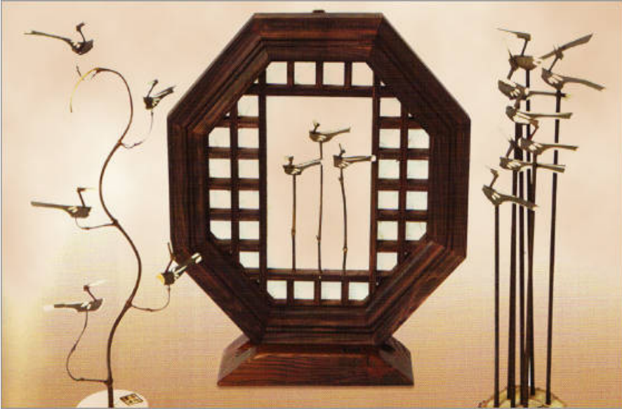
Şekil 8: Hediyelik Eşya Olarak Sotdae

( http://www.korea-fans.com/forum/konu-neungkang-sotdae-art-museum.html )