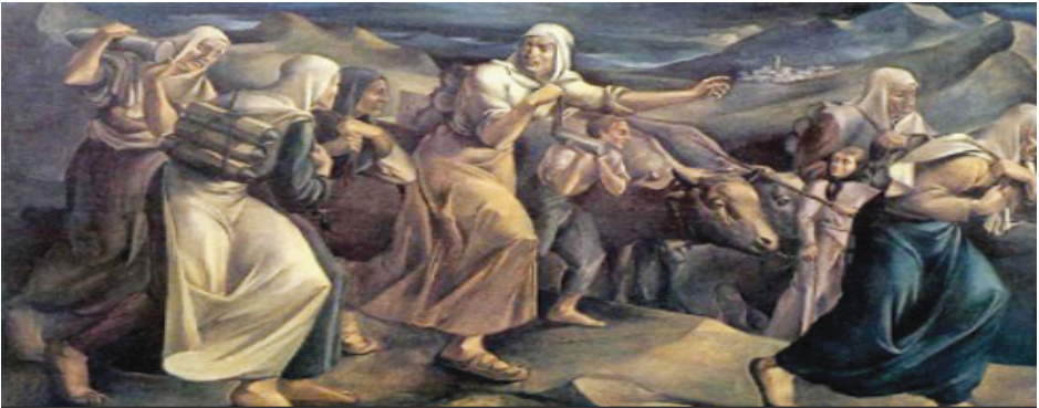
Cephane taşıyan kadınlar, Halil Dikmen

Şekil 6: B Yayınevi Tarafından Hazırlanan 5. Sınıf Sosyal Bilgiler Ders Kitabı “Gerçekleşen Düşler” Adlı 6. Ünite Geçen Aile Teması İle İlgili Örnek Bir Materyal