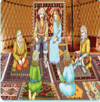
Kurultaya, boy beyleri ve hatun da katılır.

Şekil 7: A Yayınevi Tarafından Hazırlanan 6. Sınıf Sosyal Bilgiler Ders Kitabı “İpek Yolunda Türkler” Adlı 6. Ünite Geçen Aile Teması ile İlgili Örnek Bir Materyal