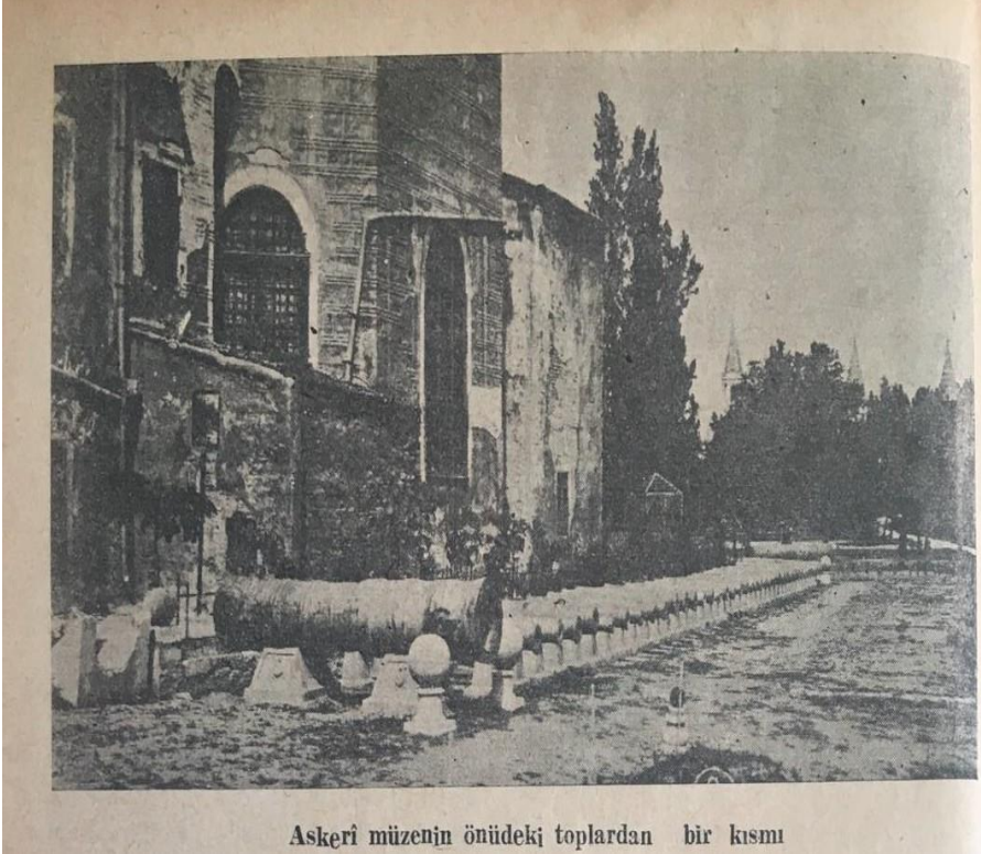
Askerî müzenin önündeki toplardan bir kısmı

Ek 13: Aya İrini önünde sergilenen, en başta Fâtih Sultan Mehmed'in İstanbul'un fethinde kullandığı tunç topun bulunduğu Osmanlı topları (İbrahim Hakkı Konyalı, Tarih Hazinesi , Sayı 13 (1951), c. 2, s. 644.