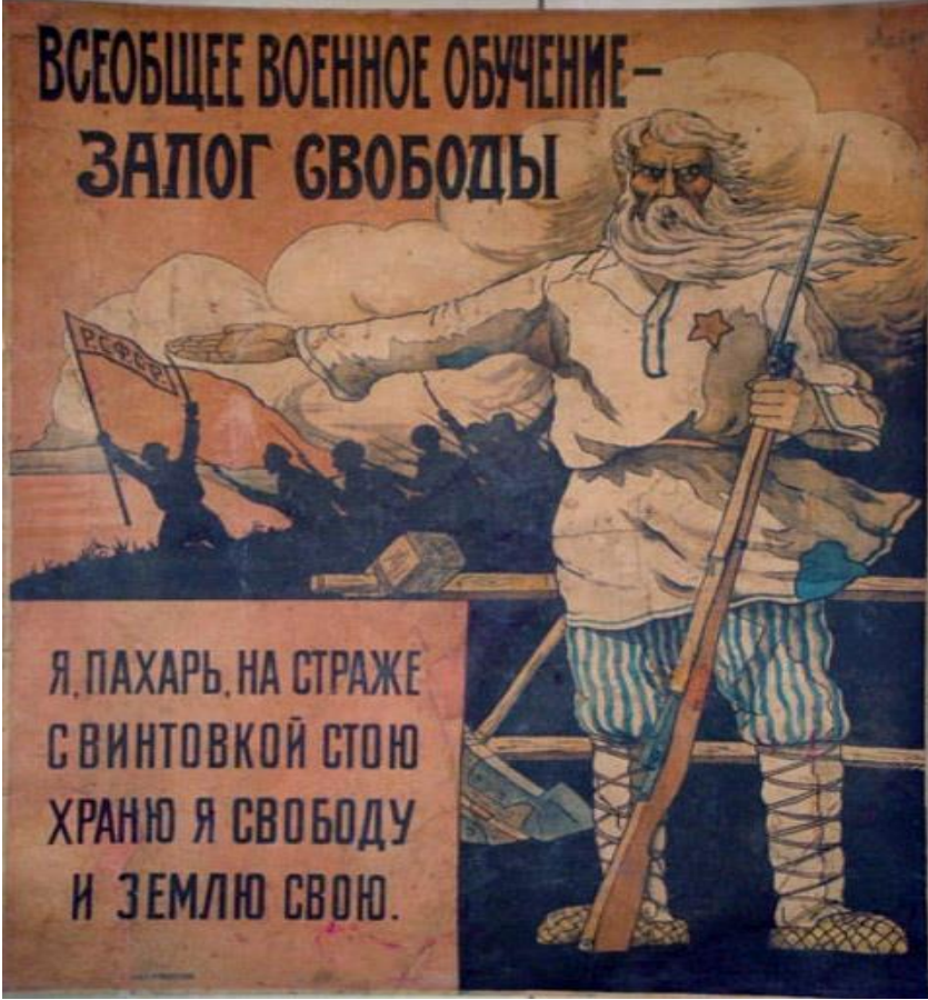
Ek 3: “Vsevobuç Özgürlük Sloganıdır” temalı propaganda afişi

(Kaynak: “Vsevobuch is the Watchword of Freedom (1919)”, International Institute of Social History , The Chairman Smiles, 2001; http://soviethistory.msu.edu/1917-2/red-guard-into-army/red-guard-into-army-images/#bwg15/251 ) (Erişim tarihi: 02.01.2018)