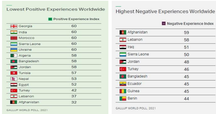
Tablo 1. Gallup Global Emotions 2022

Tüm bu veriler gözetildiğinde Kaybolan Bağlar 'ın yazarı Johann Hari'nin depresyonun hakiki nedenlerini, yitirdiğimiz toplumsal hasletlerin bir sonucu olarak okuması oldukça manidardır: