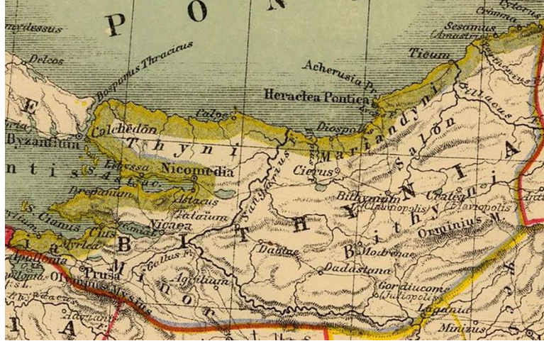
H. Kiepert (1903)

Roma Cumhuriyet Dönemi’ne kadar antik yazarların anlatımlarından ve sikkeler üzerindeki ifadelerden de öğrendiğimiz kadarıyla kent Bithynion olarak adlandırılmaktadır. (Plin.nat. V, 149; Strab. XII, 565; Wort, 1889: 117vd.). Bölgenin önemli 12 kentinden biri olan kent, MÖ 74 yılından itibaren Roma egemenliği altına girmiş ve Julio-Claudia hanedanlığı döneminden itibaren Klaudiopolis adıyla anılmıştır (Becker-Bertan, 1986: 2 vd.; Wilcken, 1897: 542). İmparator Hadrianus Dönemiyle birlikte kentin adı Hadrianon Klaudiopoleion olarak değiştirilse (RE III.1 1897: 542; Becker 1986: 1 vd.) de halk arasında Klaudiopolis ismi kullanılmaya devam etmiştir (Marek, 2002: 31-32.). Kent, Geç Antik Çağ’da oluşturulan Honorias Eyaleti’ne de başkentlik yapmıştır (Bingham, 1834: 329) Bu süreçte Nikomedia ve Krateia gibi kentlerin de içinde bulunduğu yetmiş askeri kentten biri olmuştur (Kan, 2019: 23).