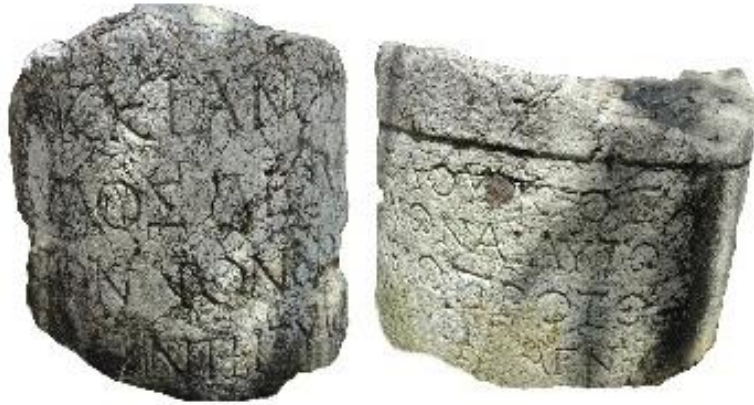
Orijinal. Yazarlara ait (2022)

Böylelikle Klaudiopolis stadyumundaki bedensel agonların yukarıda sözü edilen kategoriler çerçevesinde gerçekleştirildiği şüpheye yer bırakmayacağı şekilde anlaşılmaktadır.