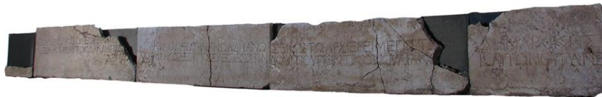
Orijinal. Yazarlara ait (2022)