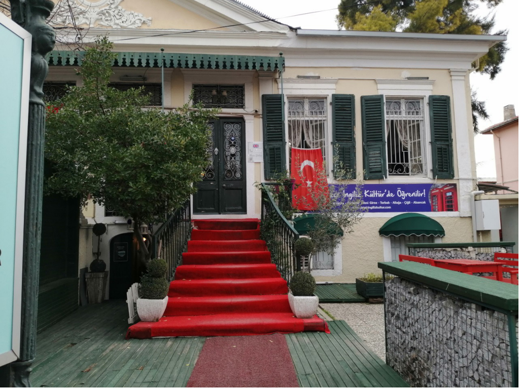
Şekil 16. İngiliz Kültür Özel Dil Okulu

Neredeyse dünyanın her yerinde açılan yabancı dil öğrenme okullarının, küresel şekilde yansımaları olan Amerikan Kültür ve İngiliz Kültür Dil Okulları Buca'da tarihi çevredeki yapı stokunu değerlendirerek bu bölgede hizmet vermektedirler. Bu yapıların işlevi küresel markalar tarafından yenilenerek kendi amacına uygun olarak düzenlenmiştir.