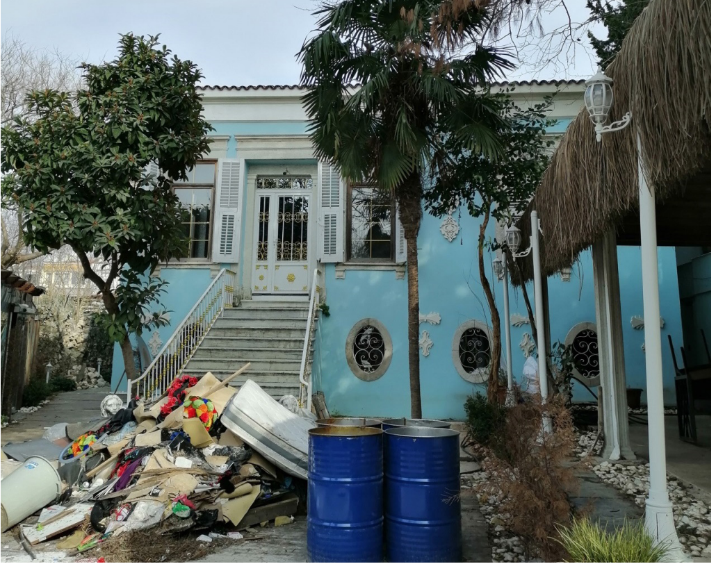
Şekil 7. Levanten Köşklerinden Kendine Özgü Örneklerinden Olan Yeniden İşlev Kazanan Köşk 1857 Adlı Kafe

282 Ada 26 Parselde bulunan Tınaztepe Mahallesi Belediye Caddesi mevkiindeki bu konut kâgir olarak inşa edilmiştir. Tarihi konut günümüzde kafe olarak hizmet vermektedir. Öncesinde yapının bahçe olduğu düşünülen alanında bugün yarı açık-kapalı mekân inşa edildiği gözlenmiştir. Bu mekân kütle büyüklüğü bakımından Levanten köşkünü baskılamaktadır. Somut kültürel mirasın yeniden kullanarak yaşatma amacından saparak kafe işlevi ön plana çıkmaktadır.