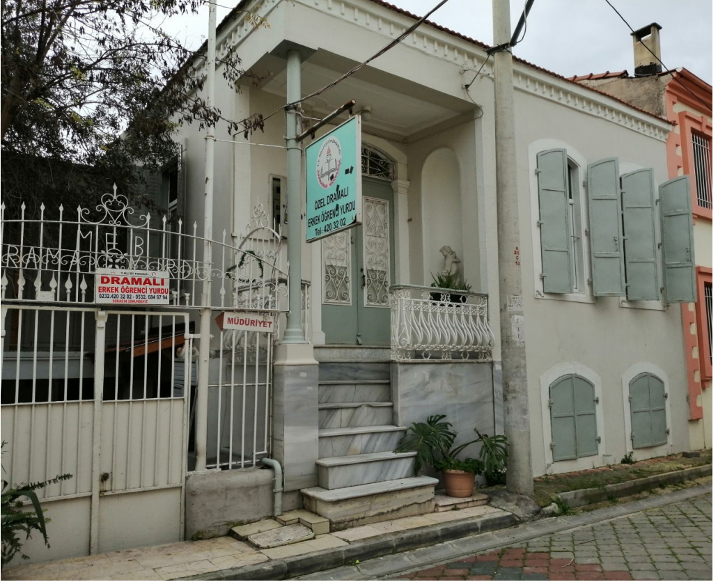
Şekil 11. Tarihi Konutun Yurt İşlevli Kullanımı

İnönü Mahallesi 104 Ada 5 Parselde Kuyusu olan kâgir bir konuttur. Ev Halk, Lale, Dutlu mevkiindedir. Sade cephe düzeni yapı girişindeki küçük bir tabela haricinde büyük oranda özgün kalmıştır. Özgün korkuluk-kepenkleri ve demir kapısı tarihi doku ile uyum içindedir.