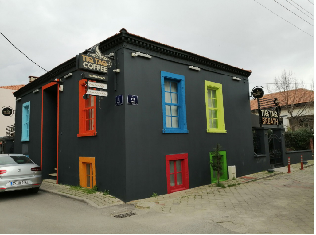
Şekil 10. Bodrum+Zemin Kat Tekil Levanten Konut Örneğinin Kafe İşlevli Kullanımı

İnönü Mahallesi 137 Ada 1 Parselde bulunan kâgir ev, 9 Eylül İstiklal mevkiindedir. Renkleri ile özellikle cazibe oluşturma amacına gidilmiş olan bu konutta ise bahçesine ve yapının cephesine yapılan uygulamalar göze çarpmaktadır. Marka değeri, ekonomik kaygı gibi değerler ön plana çıkarak kültürel mirası yaşatma, koruma ve tarihi dokuyu sürdürme kaygılarından uzaklaşmıştır.