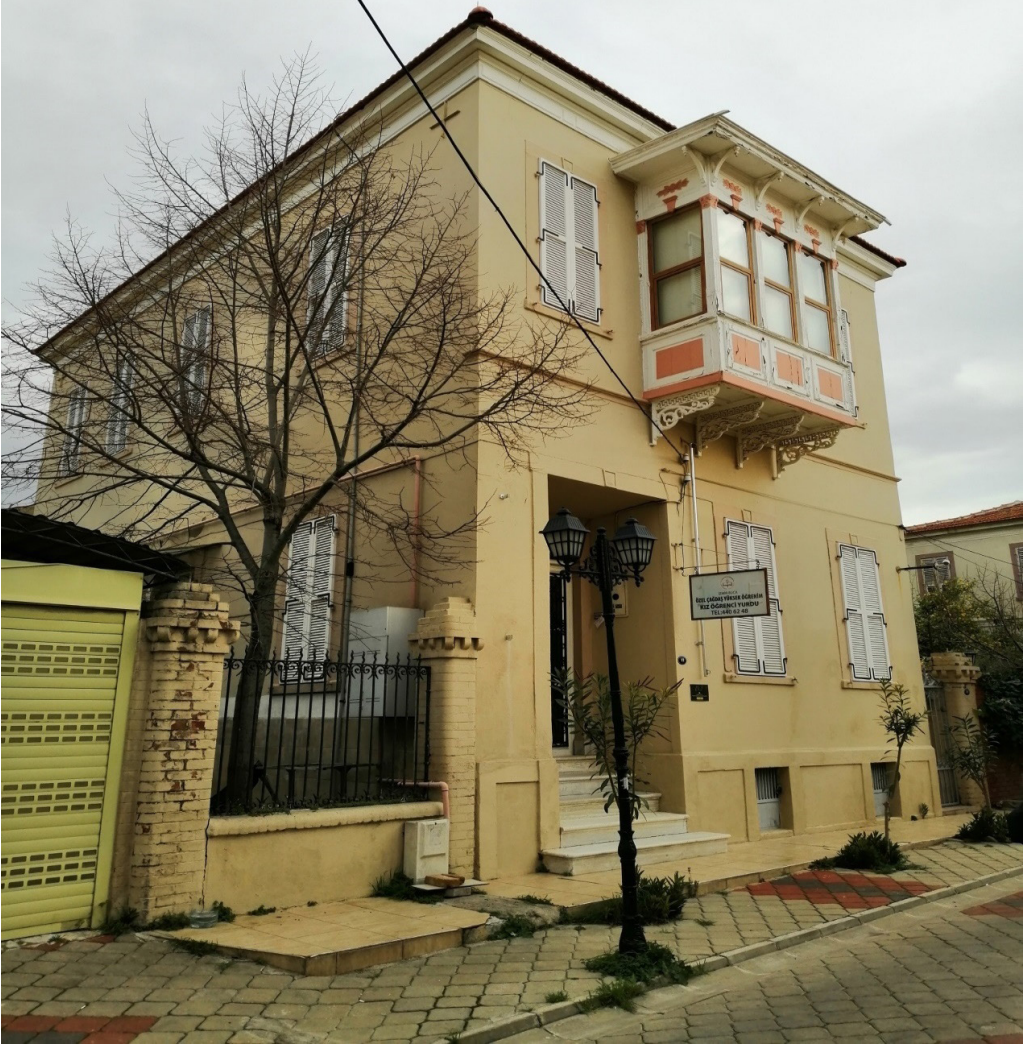
Şekil 12. İki Katlı Levanten Konutların Yurt İşlevli Kullanımı

İnönü Mahallesi 105 ada 13 parselde Kuyulu Kagir ev, Dutlu mevkiindedir. Cephe giriş kısmındaki küçük Milli Eğitime bağlı olduğunu bildiren tabela haricinde büyük bir müdahale gözlemlenmemiştir. İki katlı Levanten konut kimliğine özgün cumbası dikkat çekmektedir.