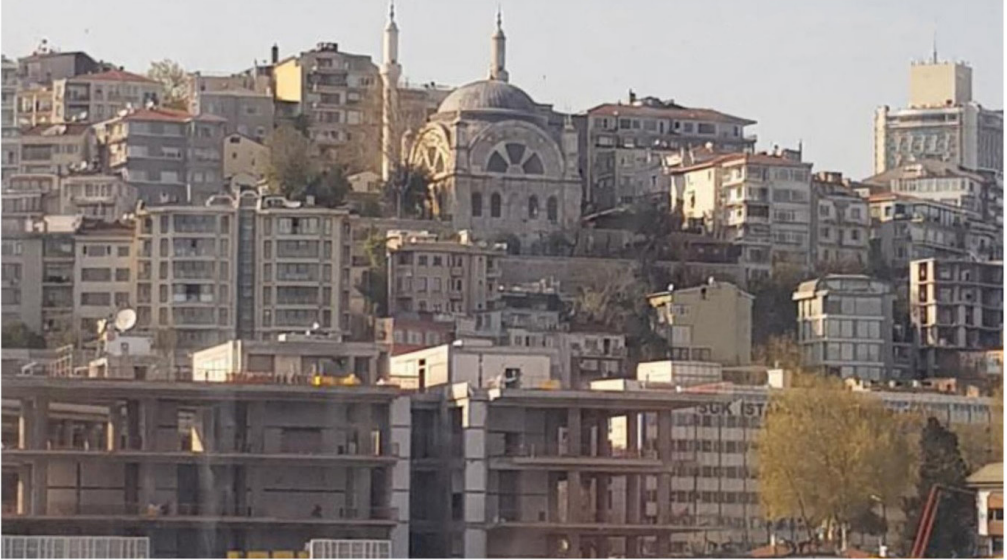
Şekil 2. Cihangir Değişimi (Görsele Twitter üzerinden ulaşılmıştır, https://twitter.com/hayalleme/status/1254797107996897282/photo/1 )

Ekonomik dinamikler ele alındığında birçok parametreyle beraber 1950'lilerin sonunda Cihangir'in terk edilmekte olduğu anlaşılmaktadır. "1970'li yıllarda Boğaziçi Köprüsü'nün yapımıyla Galata'dan Mecidiyeköy'e kayan iş merkezleri Beyoğlu ve çevre semtlerinin gelişimini büyük ölçüde engelleyerek, Cihangir'i kimsesiz ve bakımsız bir semt haline getirmiş, semtin yerli sakinlerinin de büyük bir kısmı daha nezih buldukları başka semtlere taşınmışlardır... 1980'li yılların sonlarına doğru Beyoğlu'nun