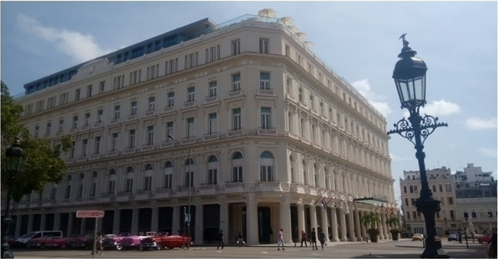
Şekil 4. Havana Tarihi kent merkezinde yeniden işlev kazanmış bir yapı