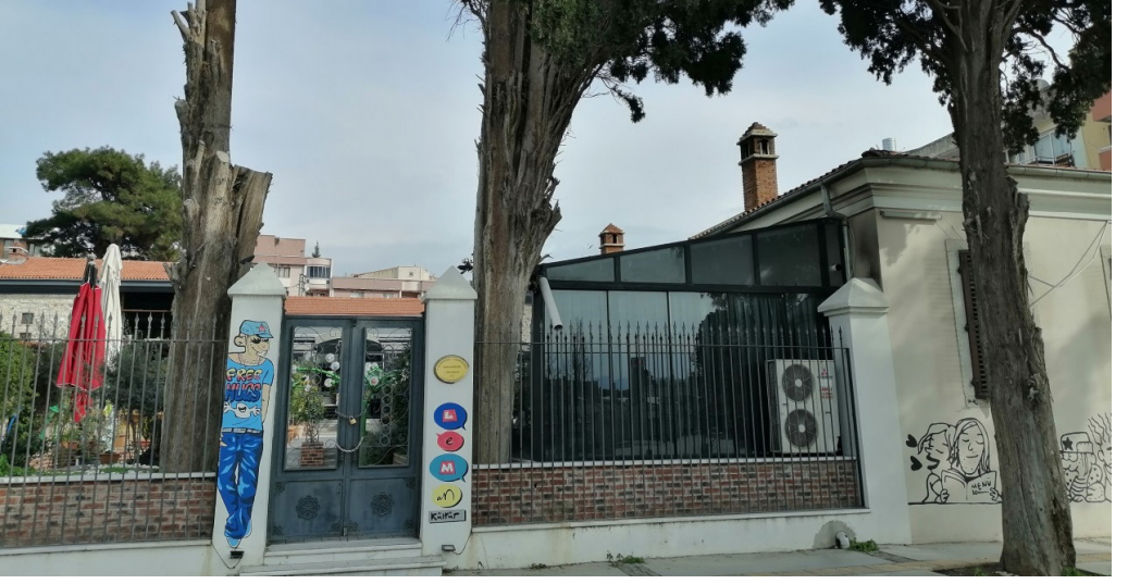
Şekil 6. Yapıya Ek Yarı Açık Alan