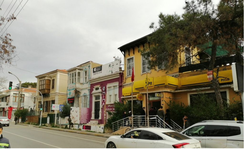
Şekil 23. PTT Yapısı Günümlz Kullanımı ve Sokağın Görüntüsü

Alan çalışması sırasında tespit edilen başka bir sorun ise pandemi ile özellikle yeniden işlevlendirilmiş bu konutların çoğunun yine ekonomik nedenlerle kullanım dışı bırakılmasıdır. İçinde yaşanmayan âtil durumda bırakılan her tarihi çevre yok olma tehdidi altında kalmaktadır. Yeniden kullanım işlevi olarak kafe-restoran-özel yurtlar ve okullar pandeminin karantina sürecinde âtil hâle gelmişlerdir. Özellikle kafe restoranların bu süreçte kapatılıp terk edildiği örneklerde de görülmektedir.