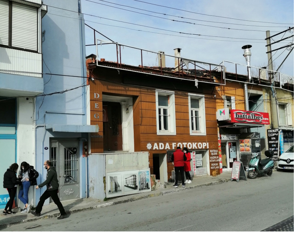
Şekil 20. Ada Fotokopi

Tınaztepe Mahallesi 282/9 ve 282/8 de bulunan kâğır evlerin günümüz kullanımında cepheye yüz veren zemin kattaki mekânlar kırtasiye dükkanı olarak işlev kazanırken üst kattaki alan depo olarak kullanılmaktadır. Özellikler 282/9 ada/parselde bulunan Ada Fotokopinin yer aldığı yapı, cephe kaplamasıyla tanınmaz hâle gelmiştir.