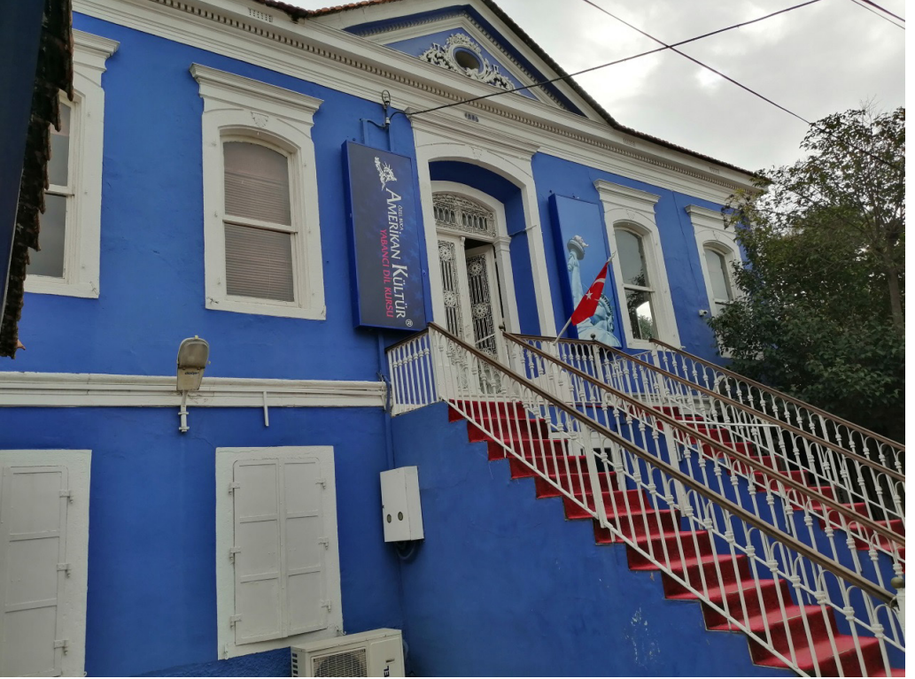
Şekil 15. Amerikan Kültür Özel Dil Okulu

İnönü Mahallesi 107 ada 11 parselde bulunan Amerikan kültür dil kursu olarak hizmet veren kuyu ve ahşap bir dükkâna havi kâgir bir konut özelliklerine sahiptir. Yine aynı cadde üzerinde 107 ada 9 parselde bulunan İngiliz Kültür özel dil kursu olarak kullanılan bina kâgir yapım sisteminde inşa edilmiştir. Bu iki kültür varlığı da İstasyon mevkiinde bulunmaktadır. Üçgen alınlıklı tekil konut örneklerinden olan konutların cephe süslemeleri korunduğu ve yapının ön cephesine asılan tabela haricinde büyük bir değişiklik gözlemlenmemiştir.