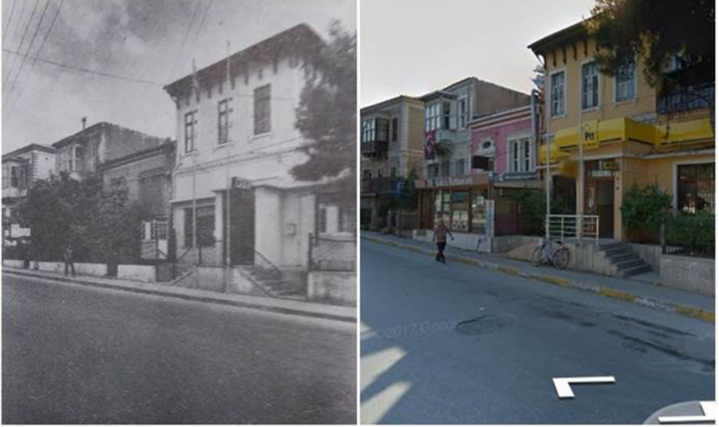
Şekil 22. PTT Kamu Hizmet Binasının Eski ve Google Görselfe Birleştirilmesi

İnönü Mahallesi 102/4 ada/parsel de bulunan kuyulu kâgir ev bugün PTT binası olarak hizmet vermektedir. Geçmiş fotoğrafına ulaşılan yapıdaki değişim açıkça görülmektedir. Ön cepheye eklenmiş büyük giriş kütlesi yapının algılamasını zorlaştırmaktadır.