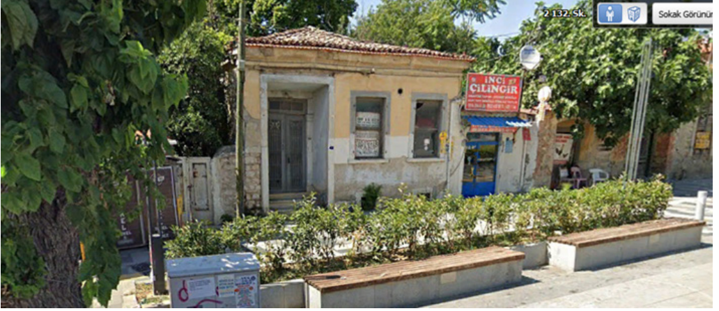
Şekil 18. Aynı Parseldeki Konutun Müdahale Öncesi Google Street Görüntüsü (2016)