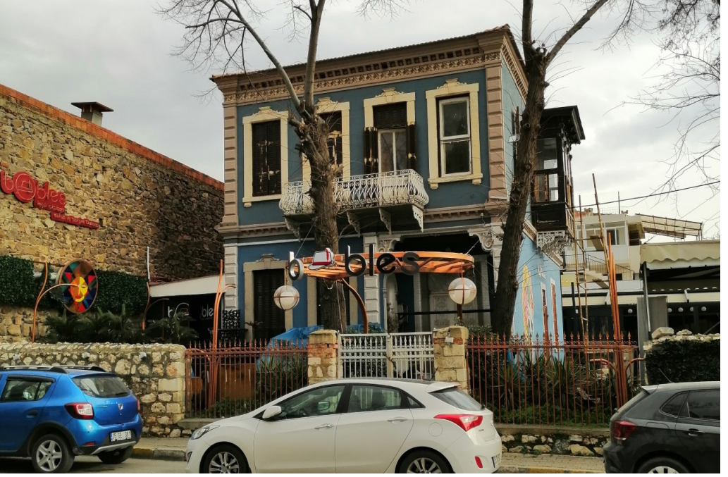
Şekil 9. Yaygın Levanten Konutlarından Ayrık Nizamlı Süslemeli Bir Konut Örneğinin Kafe Olarak Yeniden Değerlendirilmesi

İnönü Mahallesi 96 Ada 5 Parselde bulunan kâgir konut, İstasyon Caddesi mevkidedir. Yaygın iki katlı Levanten konut örneklerinden olup Sini Köşk'ün karşısındadır. Konutun, kafe işlevine bağlı olarak gördüğü yeni müdahalelerle ticari bir rant aracına dönüştüğü görülmektedir. Yan yola bakan cephe tehlike arz ettiğinden bir çelik iskeleyle desteklenmektedir. Yapıda ek müdahale yapılmamıştır ancak çevresindeki gölgeleme için kullanılan tenteler yapının algılanmasını zorlaştırmaktadır.