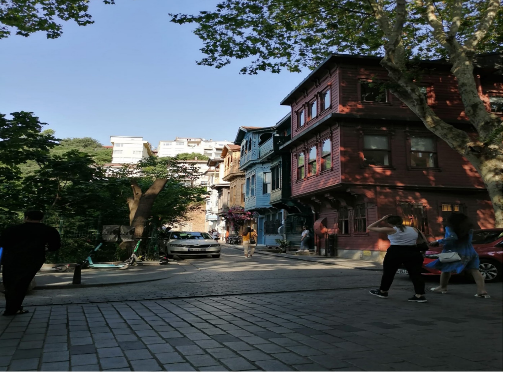
Şekil 1. Kuzguncuktan Bir Sokak Tarihi Konut Dokusu ve Çevresindeki Yeni Doku Örnekleri Sol Üst Kısımda (İstanbul-Kuzguncuk)

değerlerini koruma çabalarıyla gerçekleşmiştir” (Uzun, 2022: 92).