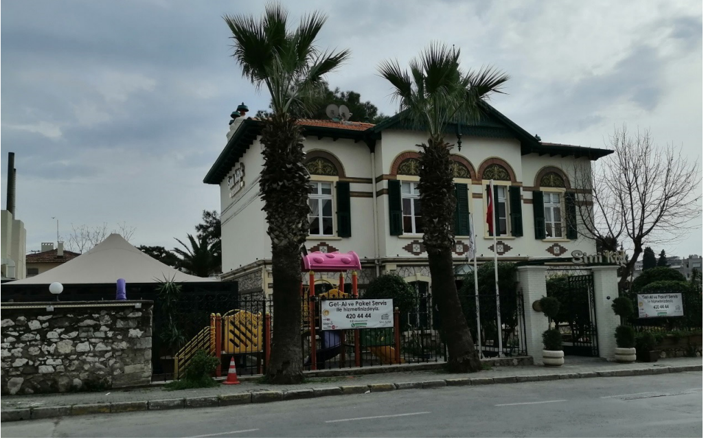
Şekil 8. Sini Köşk Adında Restoran İşlevli Büyük Ölçekli Konut Yapısı