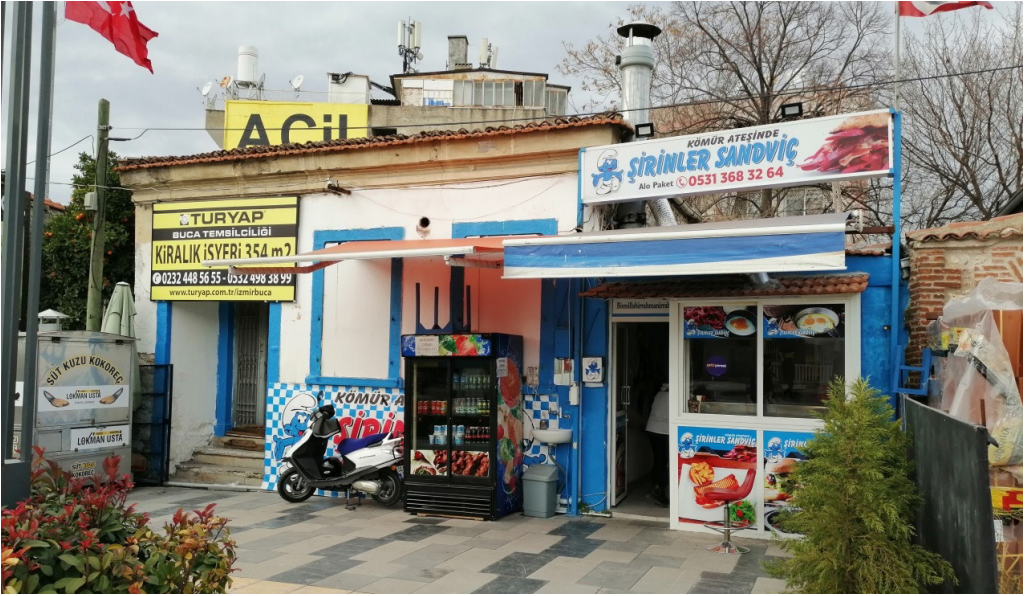
Şekil 19. Şekil 18'deki Konutun Müdahale Sonrası Görünümü