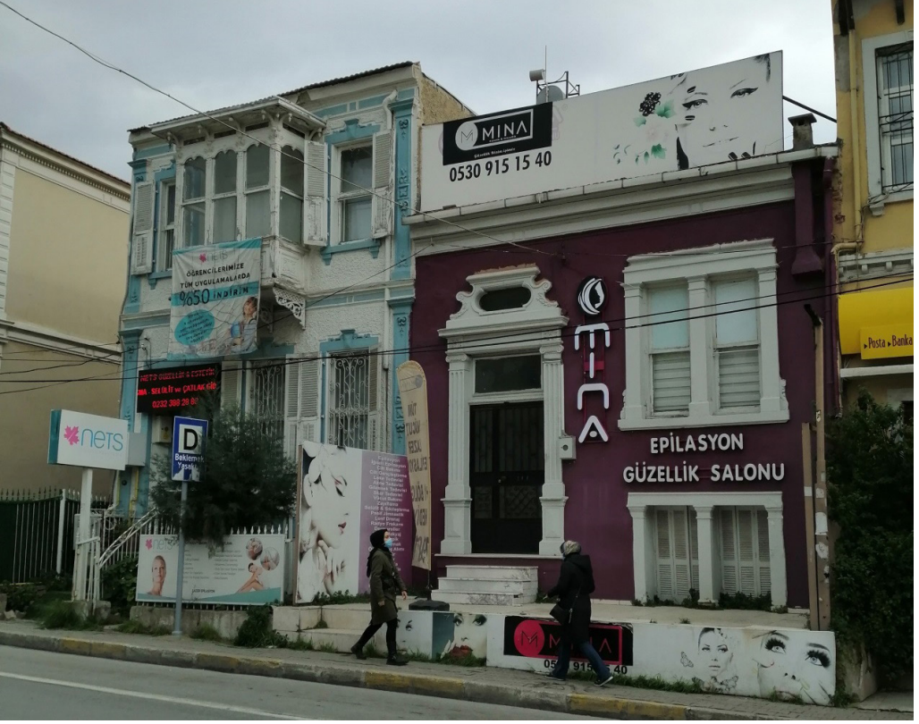
Şekil 17. Levanten Konutların Çeşitli Örneklerinin Güzellik Salonu İşlevinde Kullanımı