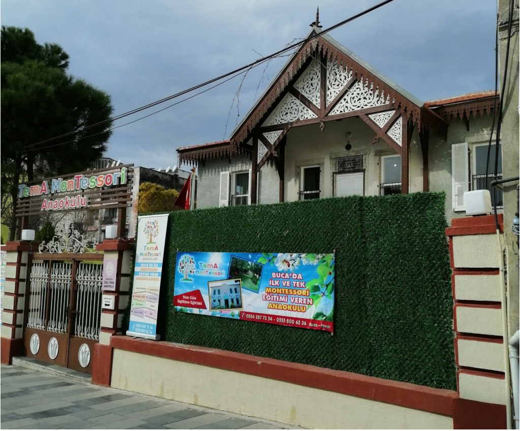
Şekil 14. TemA Anaokullarından Bir Örnek-Bahçe Düzeni ve Bahçe Duvarındaki Müdahaleler.

İnönü Mahallesi 120 Ada 15 Parselde bulunan iki katlı köşk İstasyon mevkiindedir. Yapının saçak altı süslemeleri dikkat çekicidir. Yapının bahçe girişindeki kapıdaki büyük tabela yapının algılanmasını güçleştirmektedir.