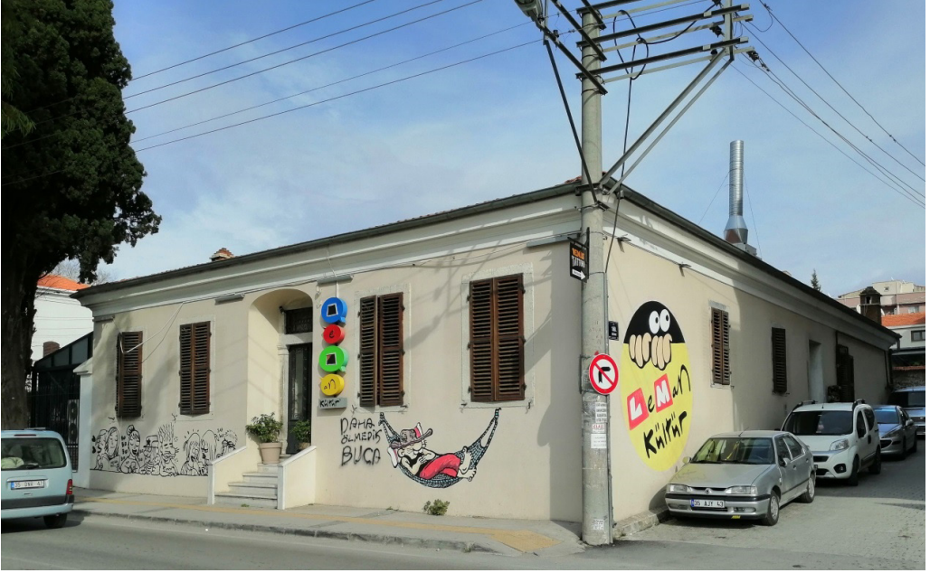
Şekil 5. Leman Kültür Olarak Yeniden İşlev Kazanan Tek Katlı Kâgir Konut

Buca ilçesi Kocatepe Mahallesi Belediye Caddesi Yeni yol mevkiinde bulunan 221 ada 1 parseldeki kâgir yapı günümüzde Leman Kültür Kafe/Bar olarak hizmet etmektedir. Cepheye yapılmış yarı açık mekânın kütlesi yapının özgünlüğünü bozmaktadır. Mekânın markası, günümüz kullanımındaki işlevi kültürel mirasın önüne geçmektedir.