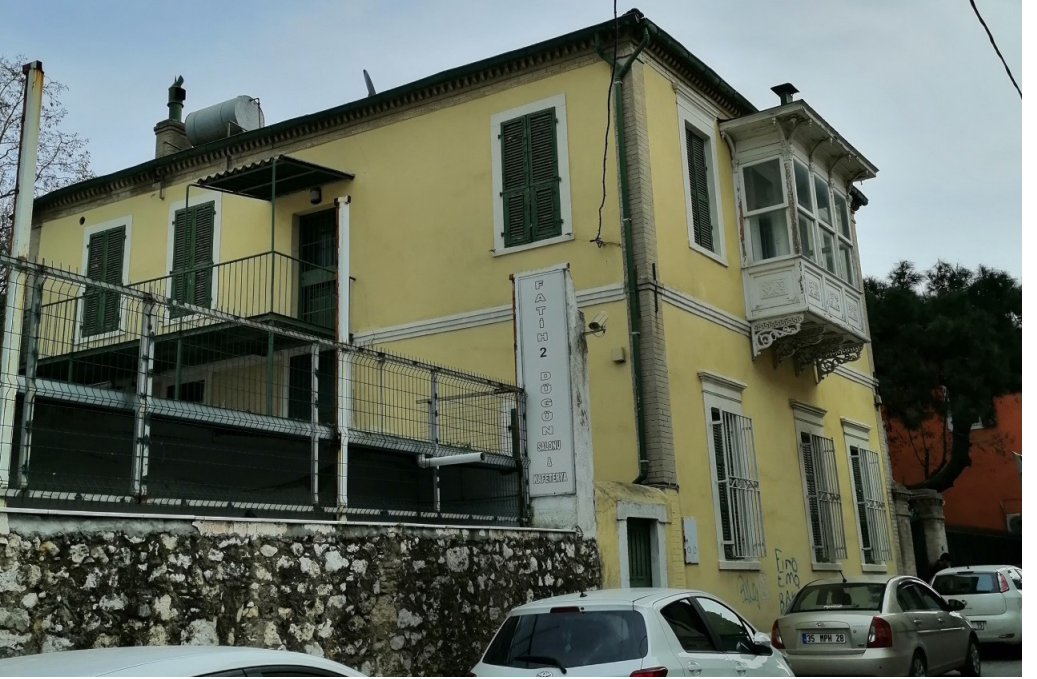
Şekil 21. Büyük Ölçekli İki Katlı Yaygın Levanten Konutu Örneğinin Düğün Salonu İşlevli Kullanımı

Mekânın yeniden kullanımda gelecek kişi sayısının fazlalığı, gürültü kirliliği, araçlardan gelecek olan titreşim ve egzoz kirliliği yeni işlevin ne kadara hatalı olduğunu basit sorunlardır. Fiziksel olarak müdahalenin az olduğu görülmektedir, ancak aldığı yeni işlev kazanç getirisi bağlamında düşünüldüğü anlaşılmaktadır. Bu işlev tarihi bir yapı için ciddi bir tehdittir. Burada öne çıkan soylulaştırma kavramını baskın olarak görmekteyiz.