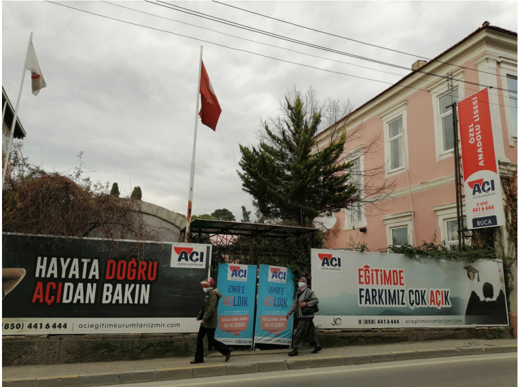
Şekil 13. Özel Açı Lisesi Tarihi Konutun Bahçesi Spor Yapısı ve Bahçe Duvarındaki Müdahaleler.

İnönü Mahallesi 127 Ada 7 Parseldeki bodrum+ iki katlı kâgir ev Soğukkuyu mevkiindedir. Yapının cephesinde açıklıkların kullanıma göre bozulması, yapı bahçesindeki ek yapının tarihi yapının önüne geçmesi mimari açıdan koruma anlayışına ters düşen müdahalelerdir. Ayrıca reklam amaçlı olarak bahçe duvarındaki dev poster soylulaştırmanın göstergeleri arasında sayılabilir.