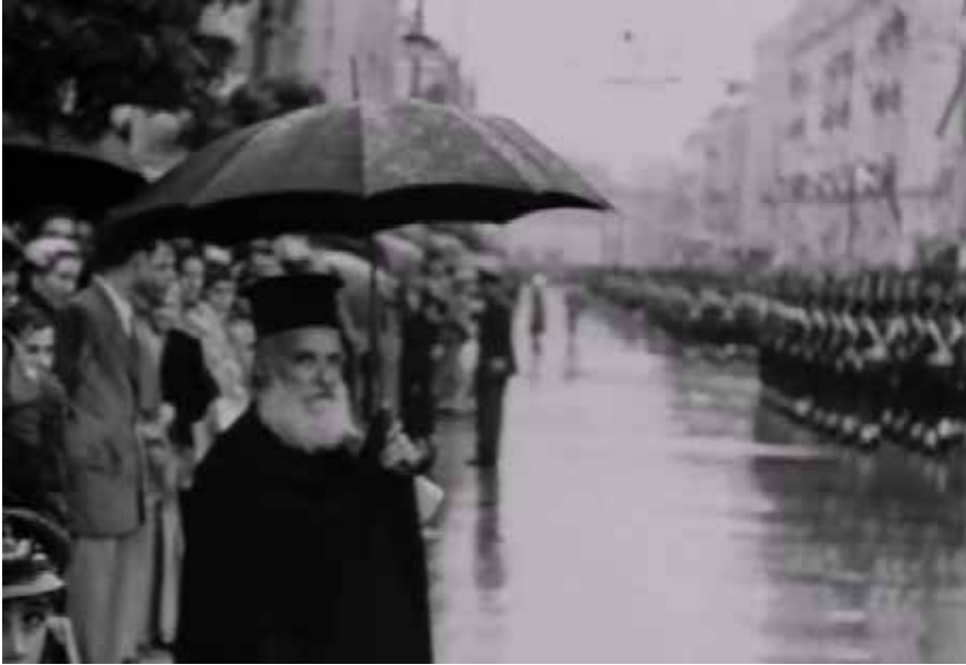
Görsel 10 Din ve Militarizm ilişkisi

Michael Cacoyannis militarist baskıyla dinsel baskıyı (Görsel 10) içiçe kullanmıştır. İronik bir şekilde bu yapıları Stella filminde olduğu gibi eleştirel bir üslupla göstermiştir. Akdeniz sinemasının görsel kodları içinde din, toplum ve devlet üçlemesinin varlığı bu görselle belirgin durumdadır. Bu filmdeki eleştirel bakış dinle devlet ilişkisini bir özgürlük meselesi olarak da tartışmaktadır. Filmin biçimsel olarak görüntü yönetiminde üst açıları kullanım tarzı minyatür ya da ikonalar formunda oryantalist bir tavırla kullanılmıştır. Filmde üst açılarla (Görsel 11) hem Rebetiko müzik sahneleri hem de erkeklerin Yunan halk danslarını sergilediği sahneler yönetmenin biçimsel ve içeriksel anlayışını göstermektedir. Çekilen bu sahneler ile Yunan mitolojisinde önemli bir yere sahip olan antik heykellere gönderme yapacak biçimde bir sunum, ve Akdenizli bir üslupla anlatım söz konusudur.