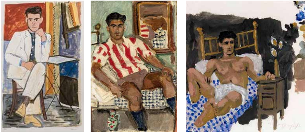
Görsel 3 Ressam Yannis Tsarouchis'in erkekleri

Gerçeklik bağlamında yaşanan bu çatışmalar şarkıcı Stella'nın çalıştığı mekan Cennet Tavernası'nı egemenlik altına almak isteyen erkek karakterler üzerinden anlatılmaktadır. Filmin giriş sahnesinde Aleko karakteri Cennet Tavernası'na doğru gitmektedir. Yol üzerinde duvarlarda (Görsel 4) filmin jeneriği yer almaktadır. Bu gidiş bir arayış gibi gözükmektedir. Çünkü bu duvardaki jenerik tıpkı bir kayıp aranıyor ilanı gibi sunulmaktadır. Aleko bu arayıştan habersizdir. Bu arayış aslında hem sevdiği kadını hem de hayatını kaybetmesine neden olacaktır. Aleko, bir bakıma filmde ölümü temsil etmektedir. Stella'yı arayıp bulup konuşmak istediği sırada Stella'nın evinin önünde trafik kazası sonucu hayatını kaybeder. Bu arayışın benzerini Türk Sineması'nda Atif Yılmaz Adı Vasfiye (1985) filminde de (Görsel 5) görmekteyiz