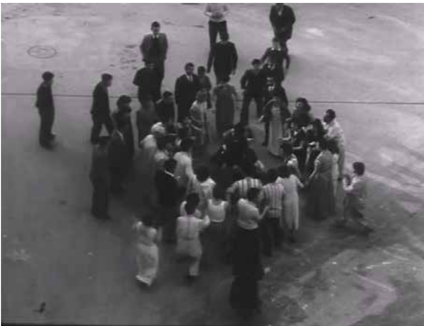
Görsel 11 Üst açı çekim tasarımı