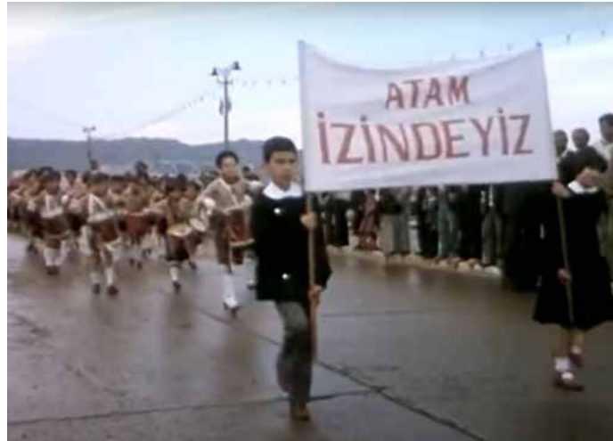
Görsel 7 Kırık Bir Aşk Hikayesi