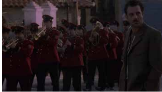
Görsel 6 Vassiliki

II. Dünya Savaşı dönemlerinde birçok devletin göz diktiği Yunanistan toprakları Nazi ülkeleri başta olmak üzere tacize uğramaktaydı. Ve o dönemde İtalyan diktatör Benito Mussolini, Yunanistan'a göz dağı vererek karşı koymadan teslim olmalarını söylemekteydi. Ülkenin gerek mali gerekse de askeri donanım olarak fazla güçlü olmaması masadaki "teslim olma" seçeneğini güçlendiriyordu. Fakat o dönem Yunanistan'ın diktatör lideri Giannis Metaksas 28 Ekim 1940 tarihinde İtalyan Büyükelçinin kendisine ilettiği Arnavutluk'taki İtalyan askerlerinin Yunanistan'a girmesi konusundaki ultiimatoma karşı resmi bir dille bu teklifi reddetti. Bir diğer anlamda "Hayır" demiş oldu. İşte o günden bu yana her 28 Ekim, Yunanların resmi bayramı olarak kutlanmaktadır (Dede, 2017). Metaksas'ın rembetiko müziğini de yasaklandığı unutmamak gerekir. Stella filminde, 28 Ekim Ohi Bayramı'nın en önemli özelliği Akdeniz'de var olan milliyetçilik ve militarist duyguların ön plana çıkarılması özellikle bando kullanımıyla anlatılmaktadır. Bayram ritüellerindeki resmi geçitlerde bandonun kullanımının birçok filmde ritüel olgu olarak veya faşizm eleştirisi olarak kullanıldığını söyleyebilmekteyiz. Örneğin, yönetmen Vangelis Serdaris'in filmi olan Vassiliki (1997) filminde (Görsel 6) ve yönetmen Ömer Kavur'un Kırık Bir Aşk Hikayesi'nde (1981) bu kullanımı (Görsel 7) görmekteyiz.