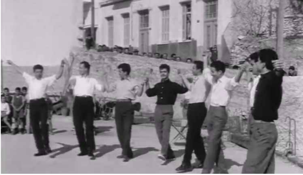
Görsel 1 Sirtaki (Yunan halk dansı) yapan erkekler