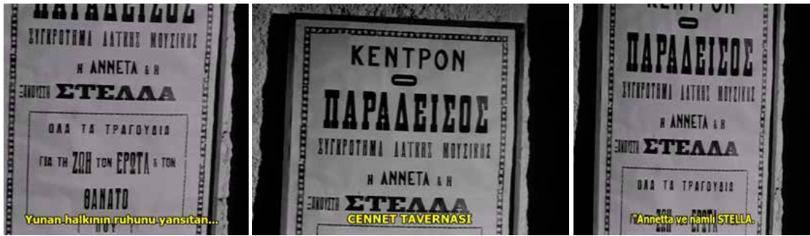
Görsel 4 Yol üzerinde duvarlarda film jeneriği

Gerçeklik bağlamında yaşanan bu çatışmalar şarkıcı Stella'nın çalıştığı mekan Cennet Tavernası'nı egemenlik altına almak isteyen erkek karakterler üzerinden anlatılmaktadır. Filmin giriş sahnesinde Aleko karakteri Cennet Tavernası'na doğru gitmektedir. Yol üzerinde duvarlarda (Görsel 4) filmin jeneriği yer almaktadır. Bu gidiş bir arayış gibi gözükmektedir. Çünkü bu duvardaki jenerik tıpkı bir kayıp aranıyor ilanı gibi sunulmaktadır. Aleko bu arayıştan habersizdir. Bu arayış aslında hem sevdiği kadını hem de hayatını kaybetmesine neden olacaktır. Aleko, bir bakıma filmde ölümü temsil etmektedir. Stella'yı arayıp bulup konuşmak istediği sırada Stella'nın evinin önünde trafik kazası sonucu hayatını kaybeder. Bu arayışın benzerini Türk Sineması'nda Atif Yılmaz Adı Vasfiye (1985) filminde de (Görsel 5) görmekteyiz