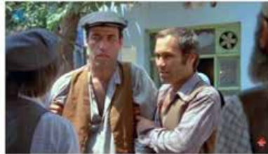
Görsel 6 (Şark Bülbülü, 19'24")