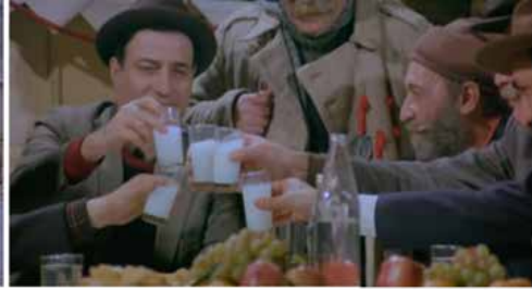
Görsel 13 (Deli Deli Küpeli, 54'30")