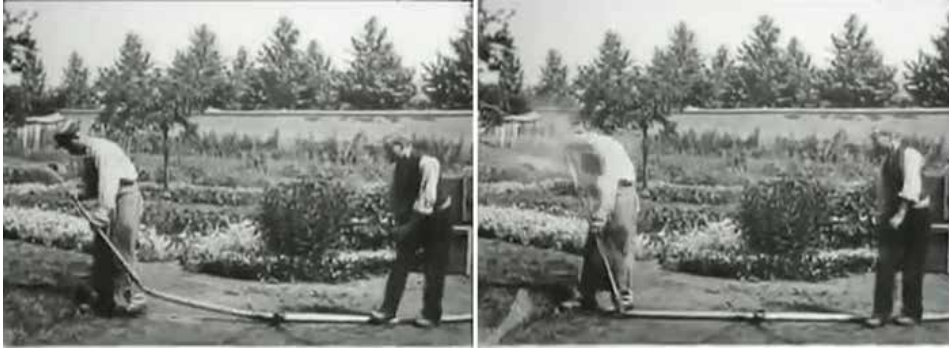
Görsel 1 (Islanan Bahçıvan, 0'11")