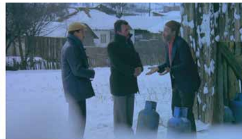
Görsel 11 (Deli Deli Küpeli, 9'55")