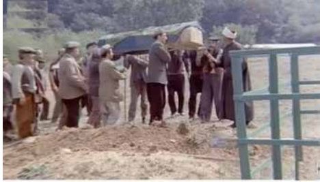
Görsel 8 (Davaro, 34'54")

Sülo öldürüleceğini anladığı için, Memo ile birlikte köylüye oyun kuracaktır. Memo, Sülo'yu kurusıkı tabanca ile vuracak Sülo'da ölmüş numarası yaparak ve köyü terk edecektir. Ancak bir problem vardır. Köylü, Sülo'nun cesedini defnetmeden öldüğüne inanmamaktadır. Kimse yokken mezarın içerisine hortum yerleştirirler. Sülo, köylü gidinceye kadar buradan nefes alacaktır. Ancak unutulmuş "kıble" hesaba katılmamıştır. Hortum, Sülo'nun başının olduğu yere değil, ayaklarının olduğu yere denk gelir.