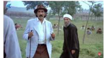
Görsel 7 (Şark Bülbülü, 1.27'32")