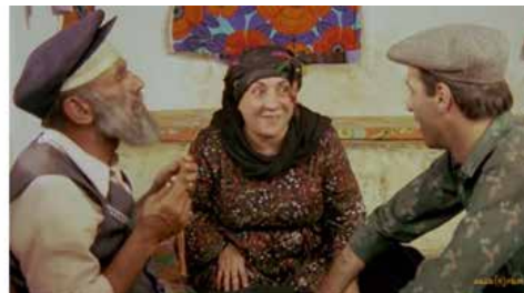
Görsel 4 (Kibar Feyzo, 13'01")