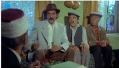
Görsel 5 (Şark Bülbülü, 16'40")

İncelenen filmde ele alınan din görevlisi Hoca rüşvet alan, para için hileli işlerde yer alan, paragöz ve üfürükçü olarak temsil edilmiştir.