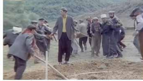
Görsel 9 (Davaro, 36'28")