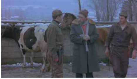
Görsel 12 (Deli Deli Küpeli, 16'14")