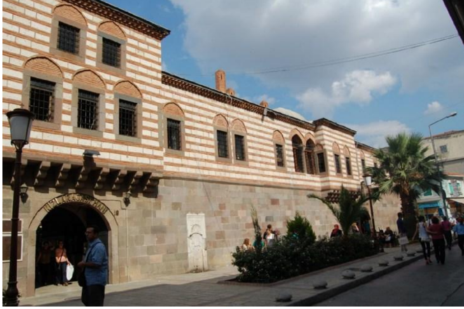
Şekil 8. Kızlarağası Hanı- Kemeraltı yolu

bütünleşmektedir. Şekil 8’de Kızlarağası Hanı’nın Kemeraltı yolu üzerindeki cephesi Osmanlı dönemi hanlarından olduğunu kapı ve pencerelerin mimari tarzında hissettirmektedir.