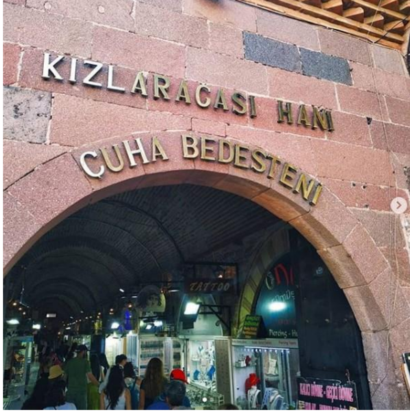
Şekil 6. Kızlarağası Hanı- Çuha Bedesteni