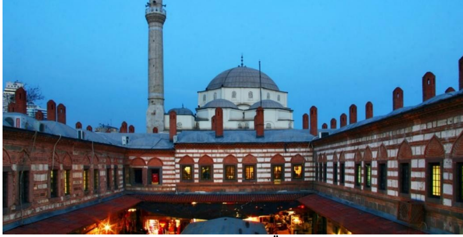
Şekil 4. Kızlarağası Hanı-Üst dış cephe

yaşattığı hatıralar ve hislerdir. Bu hatıra ve hisleri uyandıran unsurlar ise, kent bileşenleri ve onların birbiriyle ilişkileridir.