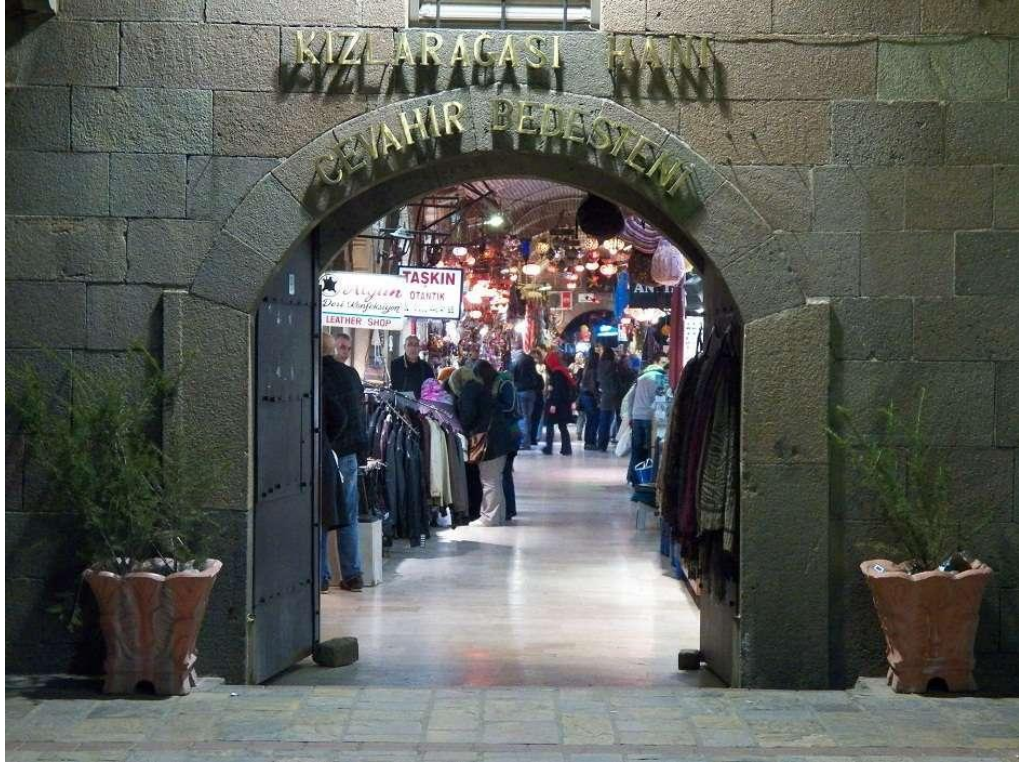
Şekil 5. Kızlarağası Hanı- Cevahir Bedesteni