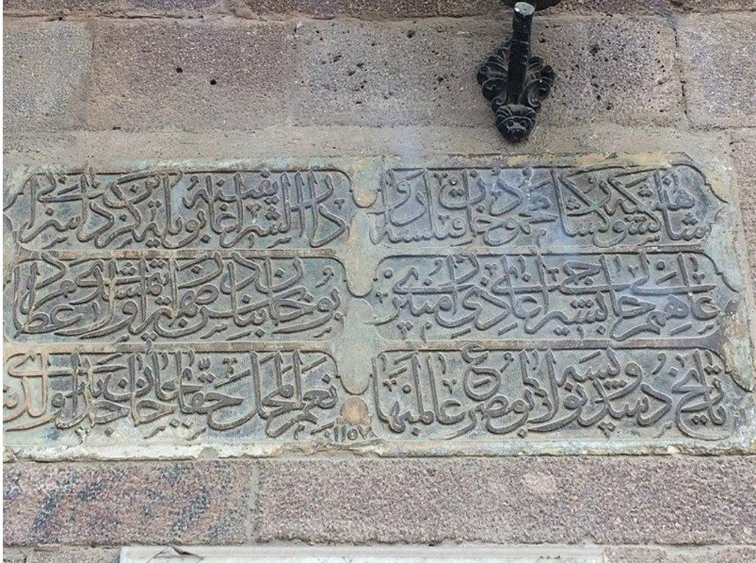
Şekil 2. Kızlarağası kitabe