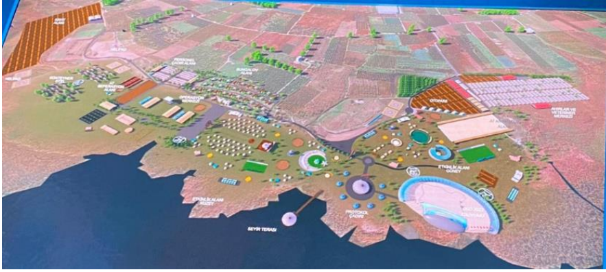
Şekil 2. Göçebe Oyunları İznik Gölü Saha Planı

yönelik çalışmaları ve spor turizmi açısından yeni bir dönüm noktası olarak görülen organizasyonun aynı zamanda göçebe halkların yaşamlarına ve medeniyetine farkındalık oluşturması kültürler arası iletişimde spor turizminin rolünü de vurgulamaktadır.