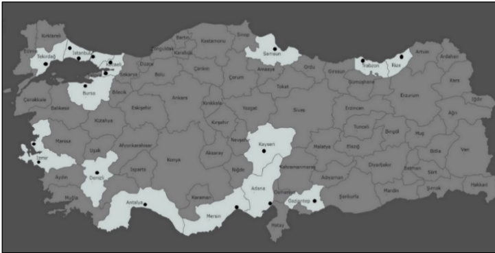
Şekil 1. Türkiye'de serbest bölgelerin dağılımı (T.C. Ticaret Bakanlığı, 2021)