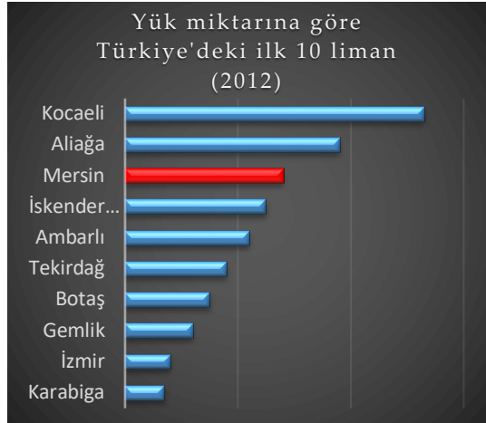
Şekil 2. Yük hacmine göre liman performans sıralaması (T.C. Ulaşım, Denizcilik ve Haberleşme Bakanlığı, 2012)

Ekonomik gelişmeye ivme kazandırsa da son 15-20 yıllık süreçte çok büyük bir sektörel değişim söz konusu olamamıştır. Bu nedenle 2006-2016 yıllarını kapsayan mekânsal inovasyon strateji planına göre Türkiye'nin ilk 10 limanı içerisinde yer alan Mersin limanının avantajlarından daha iyi bir şekilde faydalanmak amacıyla, bilgi teknolojilerine dayalı lojistik sektörünün geliştirilmesi hedeflenmiştir. Ancak Şekil 2 ve Şekil 3'teki verilerden de anlaşılacağı üzere hedeflendiği şekilde pozitif yönlü bir gelişim sağlanamamıştır. Aksine 2012 ve 2021 yıllarına ait liman performans verileri, Mersin limanının ilk 10'daki yerinin zaman içerisinde gerilediğini ortaya koymaktadır. Performans sıralamasına göre 2012 yılında üçüncü sırada yer alan Mersin limanı 2021 yılı verilerine göre beşinci sıraya gerilemiştir.