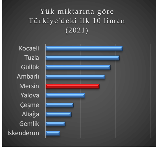
Şekil 3. Yük hacmine göre liman performans sıralaması (T.C. Ulaştırma, Denizcilik ve Haberleşme Bakanlığı, 2021)