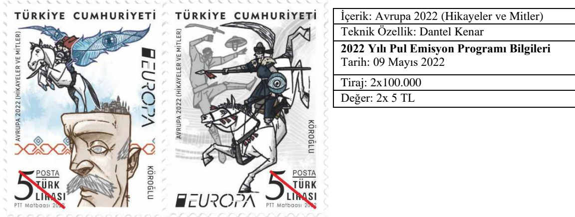
Resim 10: “Avrupa 2022 (Hikayeler ve Mitler)” Pul Tasarımı ve Bilgileri

Tasarımda “Türkiye Cumhuriyeti” yazısı üstte, mavi zeminde ortaya hizalı tek satırda yazılmıştır. “Dünya Çevre Günü İklim Değişikliği” yazısı iki satırda konumlandırılırken tipografiler için siyah renk tercih edilmiştir. Tasarım genelinde serifsiz yazı fontu kullanılmış ve nominal değer farklı tipografik kalınlıklarda tasarlanmıştır. Tasarımda tipografi-görsel ilişkisi irdelendiğinde tipografik tasarımın birbirini desteklediği görülmektedir.