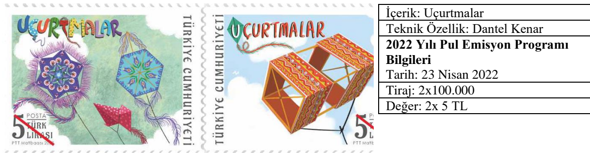
Resim 11: “Uçurtmalar” Pul Tasarımı ve Bilgileri

Tasarımda tipografi değerlendirildiğinde farklı font, punto kullanımları göze çarpmaktadır. Yazı ağırlığı ve kalınlığı vurguya göre şekillenmiştir. Serifsiz yazı fontu tercih edilen tasarımlarda hiyerarşi doğru kurgulanmıştır fakat görsel yoğunluk anlaşılabilirliği olumsuz etkilemektedir. Tasarımda tipografi-görsel ilişkisi irdelendiğinde tipografik tasarımın birbirini desteklediği görülmektedir.