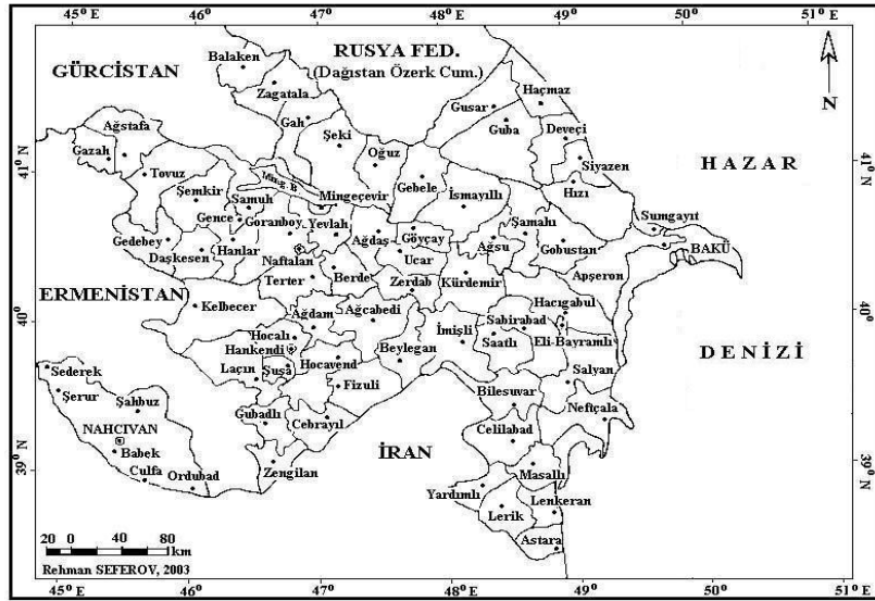
Harita 1. Azerbaycan'ın idari birimler haritası.

Azerbaycan'da dünyanın çeşitli bölgelerinde görülen 11 iklim tipinden 9'nun bulunması*, dinlenme ve sağlık turizmi için en iyi koşulları hazırlamıştır. Azerbaycan aynı zamanda Kafkaslar bölgesinde yıllık güneşlenme süresi en uzun ülkedir. Bununla beraber Azerbaycan'ın yüzey şekilleri de çok farklılık göstermekte olup, yükselti basamakları -28 m ile 4466 m arasında değişmektedir. Böylece ülkenin farklı rölyef şekillerine sahip olması da, turizm açısından çok çeşitli doğal rezervler barındırmaktadır. Bunlara örnek olarak, paleontolojik