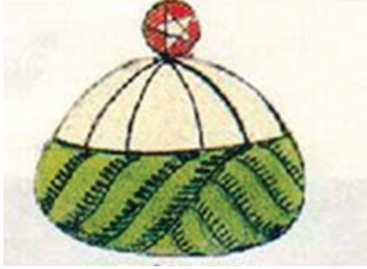
Ahi takke (tac) veya kavuğu