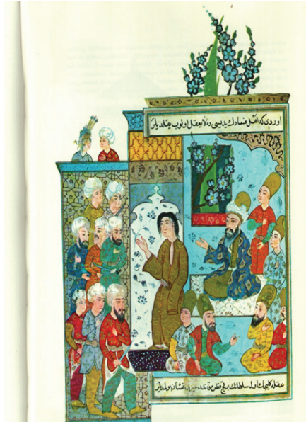
S. Ünver, ( Sevakıb-ı menakıb ) İstanbul 1973, s. 39. (Eli bıçaklı ahi kıyafeti giymiş sekiz kişi, Şemş'i dışarı çağırıyor.)