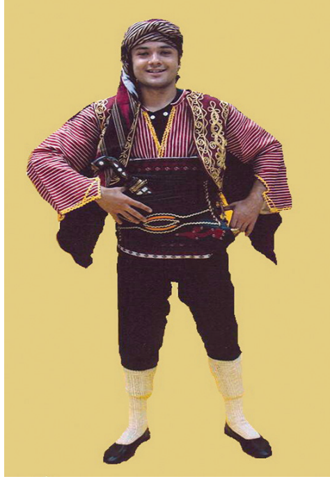
Ahilerin Kiyafetine Benzeyen Seğmen Kiyafeti