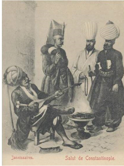
Resim 2. Yeniçeriler