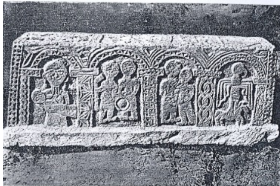
Fotoğraf 16. Azerbaycan, Sisiyan Bölgesi'nden 16. yy'a Ait Sanduka (Rasim Efendiyev'den)