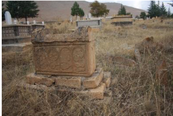
Fotoğraf 20. Gümüşali Köyü Cezveler, Fincan Takımı ve Kahve Kavurma Tavaı