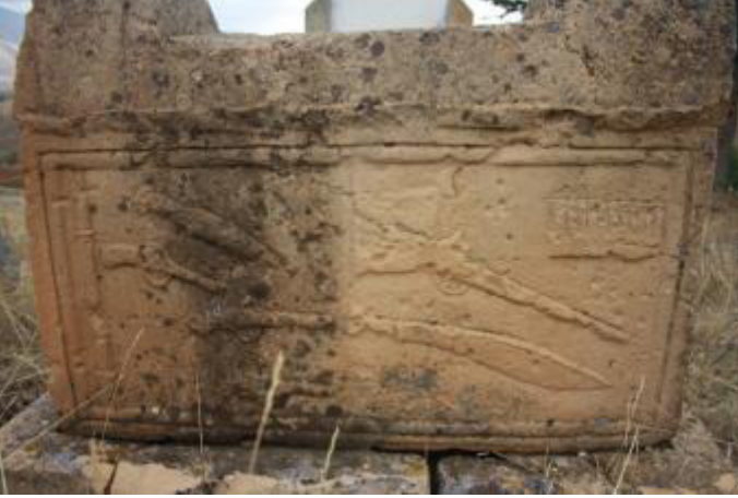
Fotoğraf 17. Gümüşali Köyü, Çeşitli Ateşli Silahlar ve Kesici Objeler

Bıçak, hançer, kılıç gibi kesici aletler ve tabanca tüfek gibi ateşli silahlar Gümüşali ve Karapınar köylerindeki mezar taşlarında yer alır (foto. 17-18). Yan yüzlere yapılan tüfek ve kılıcın yanı sıra ayak taşına işlenmiş tabanca ve tüfek süslemeleri vardır. Bunlar kabartma ve kazıma yöntemi ile yapılmışlardır. Orta ve İç Asya'da oldukça erken tarihlerden itibaren Türklerde ve diğer bozkır topluluklarında, geyikli taş veya sin taşı olarak anılan mezar taşlarının üzerinde balta, kazma gibi aletlerin yanında kılıç, hançer veya bıçak gibi tasvirlerin de yer aldığı çeşitli çalışmalarla ortaya konulmuştur (Çoruhlu, 1997: 61). Bu açıdan bölgenin mezar taşı süslemelerinde kültürel sürekliliği devam ettirdikleri görülmektedir. Ateşli silahların 18. yüzyılda kullanılmaya başlanmasıyla kesici aletlerle birlikte ateşli silahların mezar taşı süsleme programına girdiği ve çokça kullanıldığı bölgesel olarak hazırlanan mezar taşı ile ilgili çalışmalardan anlaşılmaktadır.