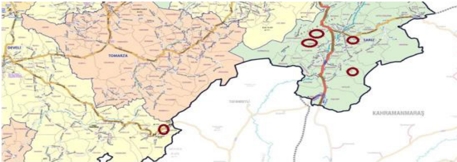
Şekil 1. Kayseri'de Koçgiri Aşiretinin Yerleştiği ve Figürlü Mezar Taşı Geleneği Görülen Köyler

Kayseri'deki bu altı köyün mezarlık yerleşimlerine bakıldığında, figürlü bezemeli ve sanduka formu mezar taşlarının bulunduğu, Sarız'ın Ördekli ve Develi'nin Karapınar köylerinde cem evlerinin mezarlıkla bitişik olduğu gözlenir.