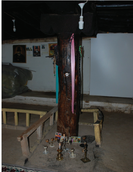
Fotoğraf 7: Kutsal kabul edilen ve Pir Sultan Abdal ile ilişkilendirilen aşşap sütun ve çubuklar