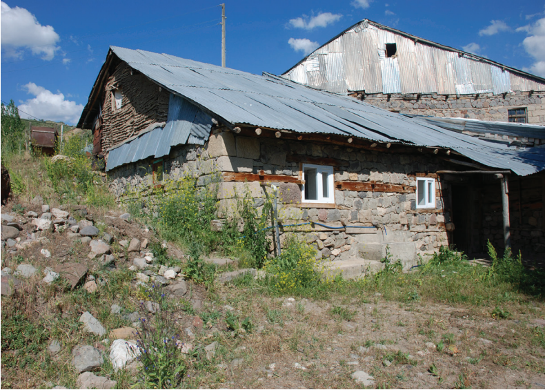
Fotoğraf 1: Pir Sultan Evi genel görünüşü (17.03.2013)