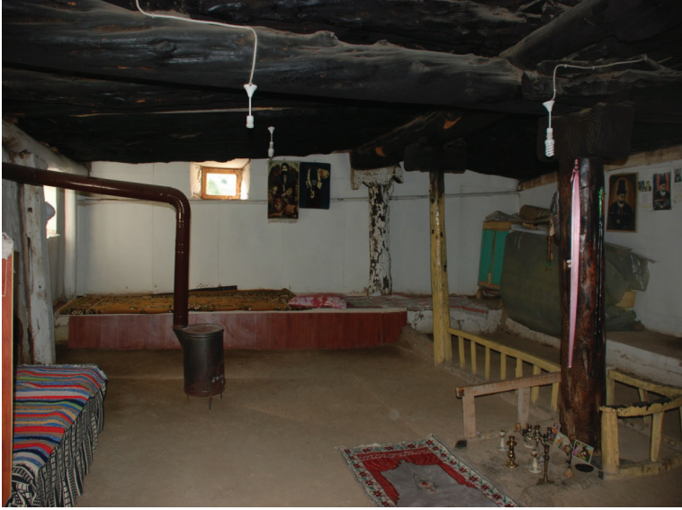
Fotoğraf 6: Yapının dini ritüellerinin gerçekleştirildiği meydan kısmı