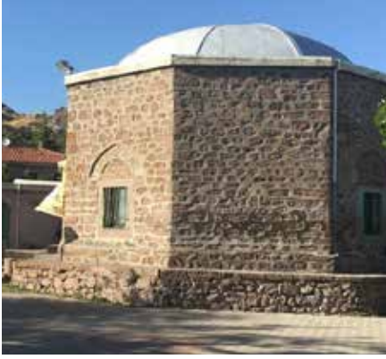
Resim 1: Ankara Hüseyin Gazi Türbesi