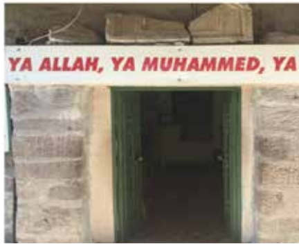
Resim 5: Hüseyin Gazi'nin kabrinin girişinde yer alan kitabe