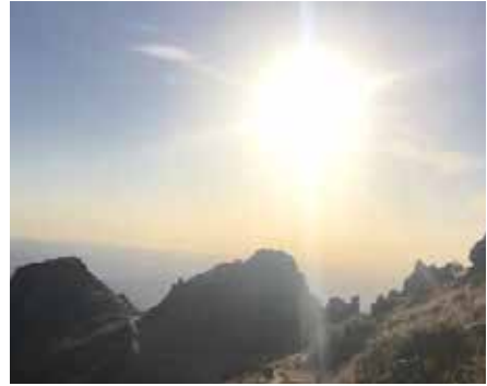
Resim 4: Hüseyin Gazi Mağarası