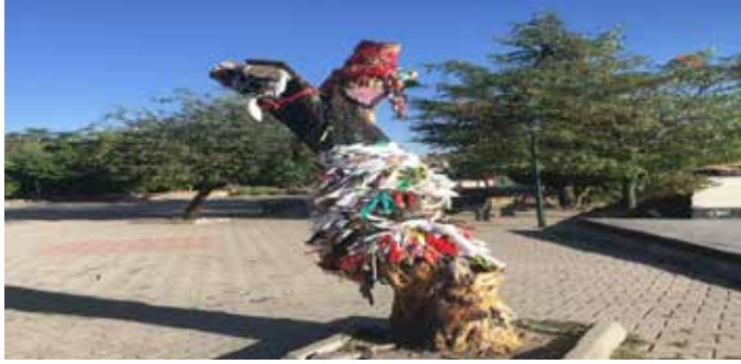
Resim 7: Türbenin bahçesindeki dilek ağacı