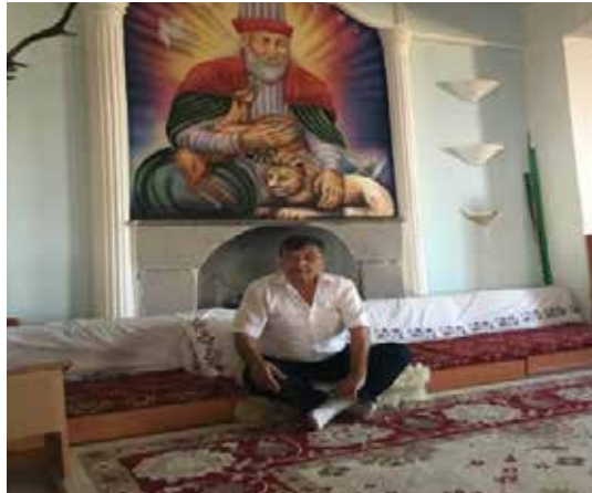
Resim 9: Türbe içerisindeki cemevi