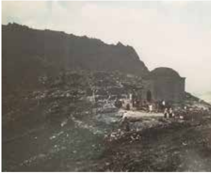
Resim 3: Türbenin 1950'li yıllardaki hali