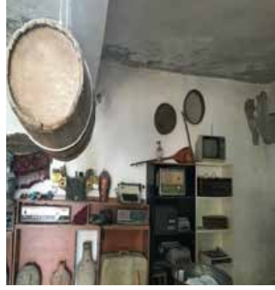
Resim 11: Müzeden bazı eserler