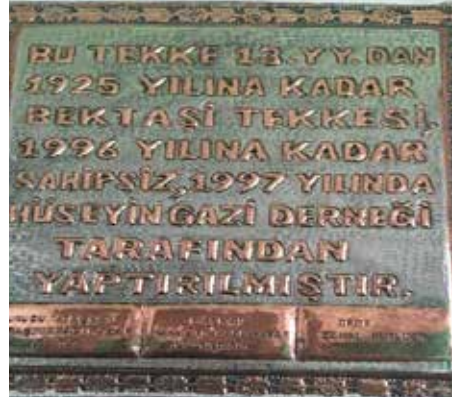
Resim 2: Türbe ve tekkenin tarihçesi