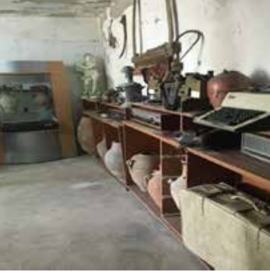
Resim 10: Müzeden bazı eserler