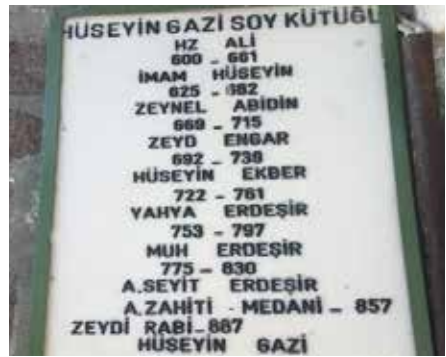
Resim 6: Hüseyin Gazi'nin soy kütüğü