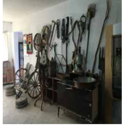
Resim 13: Müzeden bazı eserler