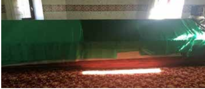
Resim 8:Hüseyin Gazi'nin kabri