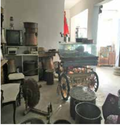
Resim 12: Müzeden bazı eserler