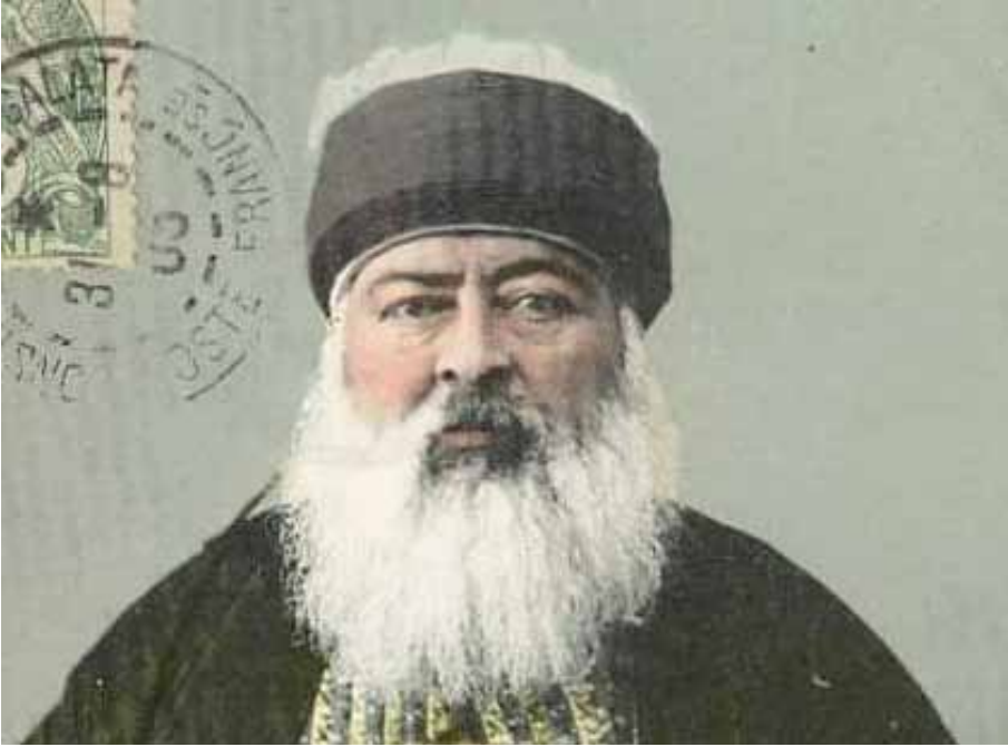
Resim 3. On İki Terkli Tâclı Nuri Baba

yasaklanıp tekkeleri kapatılmış, Bektaşiler takibata uğramıştı. Örneğin Hacı Bektaş Veli tekkesinde bulunan 26 dervişten sekizi sürgüne yollanmış, geride kalanların ise başlarından tâcları atılarak ve kendilerinden Nakşî tarikatı üzere olacakları sözü alınarak tekkede kalmalarına izin verilmişti (BOA, C.EV: 464/23489). Bu dönemde Bektaşilere ait mezar taşlarının tâc kısımlarının dahi kırıldığı rivayet edilmektedir (Ahmed Rıfki, 1327-II: 62). Cevdet Paşa'nın bildirdiğine göre bu dönemde Bektaşiler "Sünni kıyafetine girdiler ve meydanda Bektaşî kıyafetinde kimse kalmadı." (Ahmed Cevdet Paşa, 1309-XII: 183) Bazı Bektaşiler ise, on iki dilimli Bektaşî tâcı yerine dört dilimli tâc giyerek kendilerini gizlemeye çalıştılar (Hasluck, 1928: 49).