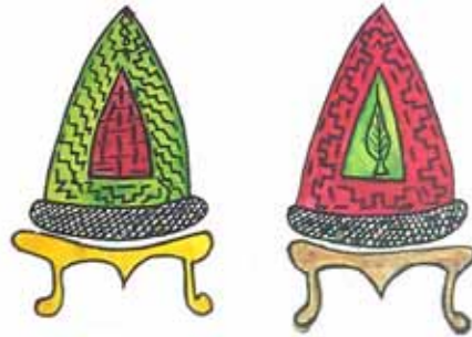
Resim 1. İki Terkli Elifi Tâc Örnekleri

Velayetname'de Hacı Bektaş Veli'nin müritlerinin de elifi tâc giydikleri ve kendisinin Osman