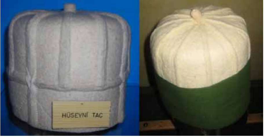
Resim 2. On İki Terkli Hüseyinî Tâc

Bektaşilikte beyaz keçeden yapılan ve on iki terkli tâc fâhr ( fahir ) olarak da isimlendirilmekteydi. Fahr, övünmek ve övünç anlamına gelmekteydi. “Yokluk benim fahrımdır (övüncümdür).” mealindeki hadise dayanarak mutasavvıflar yokluk yolunun yolcuları olduklarını göstermek için başlıklarına bu ismi vermişlerdi (Cebecioğlu, 2005: 240; Atasoy, 2005a: 196). Post makamı sahipleri, yani babalar yeşil tülbentten destârlı fahir giyerlerdi. Muhibler ise yalnız dal tâc denilen destarsız tâc giyerlerdi. Bektaşî tarikatı kollarına göre fâhirlerin şekilleri değişti. Cankuş kolu dokuz, Celâliye kolu yedi, Şâhbâz Veli kolu dört terkli kullanmışlardı. Bektaşî mezar taşlarında bu değişik başlıklara rastlanırsa da genelde başlıklar on iki dilimli fahirlerdi (İşli, 2009: 176).