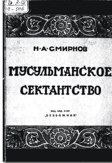
N. A. Smirnov'un "Allahsız" Yayınları tarafından yayımlanan Müslüman Tarihçeleri (Moskova, 1930) adlı kitabı.

"Azerbaycan Dilinde Kitapların Sistemli Kataloğu" bölümündeki 45 no'lu "Ateizm, Din" isimli katalog kutusunda ilk bölüm "Marksizm-Leninizm Din ve Ateizm hakkında" başlığını taşımaktadır. Burada V. İ. Lenin, K. Marks ile F. Engels'in ortak kitapları başta olmak üzere 6 adet kitap bulunmaktadır. Katalogda sonraki bölüm ise "Ateizm ve Serbest fikirliklik" başlığını taşımaktadır. Bu bölümde ise 14 kitap bulunuyor. Katalogda sonraki bölüm "Ateizm Terbiyesi, Ateizm Tebliğatı" başlığını taşımaktadır. Bu bölümde 49 kitap bulunmaktadır. Daha sonraki bölüm "Din" başlığını taşımakla birlikte, içerik olarak ateizmle ilgili kitaplar burada da önemli yer tutmaktadır. Yine Azerbaycan Milli Elmler Akademiyası'nın Merkez Kütüphanesi'nde Rusça yayınlar katalogunda ise ateizmle ilgili pek çok yayın bulunmaktadır. Bu yayınların diğer Sovyet cumhuriyetlerinin kütüphanelerinde de bulunduğunu ifade etmemiz gerekir. Almatı'da, Bişkek'te ve Taşkent'te gördüğümüz Rusça kaynaklar burada da bulunmaktadır.