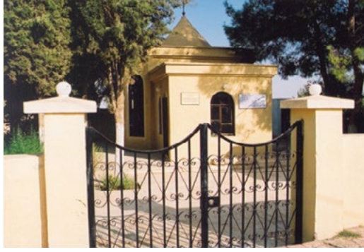
Fotoğraf 5: Kısas'ta Şah Muhammed Türbesi/2010