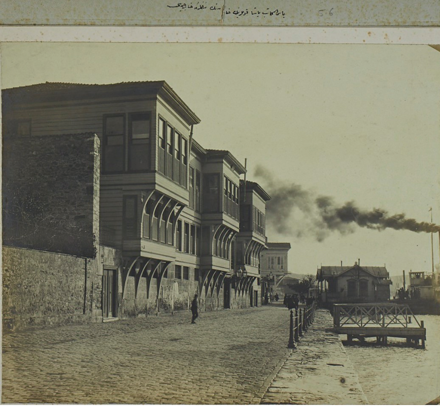
Ek 4: Başkâtib Paşa Kullarının Hanesinin Manzara-i Hariciyyesi (Çiftelahavuzlar).