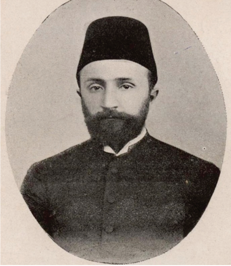
Ek 1: Tahsin Paşa'nın Göreve Başladığı Yıllardaki Hali.