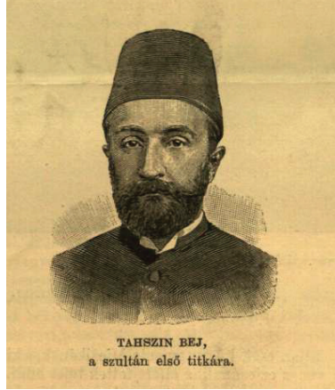
Tahsin Paşa'nın Vasarnapi Ujsag gazetesinde yer alan resmi.

Tahsin Paşa, başkâtiplik görevine getirildikten bir süre sonra Macaristan'da yayımlanan bir gazetede Sultan Abdülhamid'in üst düzey devlet erkânı sayılacak kişilerle birlikte haberi yapıldı. Burada bir fotoğrafının da yer aldığı Tahsin Paşa hakkında şu ifadeler yer almaktaydı: Padişahın son başkâtibi Süreyya Paşa vefat edince onun yerine 35 yaşında olan Tahsin Bey göreve getirildi. Padişahın bütün işlerini bizzat yürüten Tahsin Bey'in siyasî mevkii son derece önemli ve itibarlıdır. Tahsin Bey'in Avrupa dillerine vukufu yok ise de gayet ciddi ve müstakim bir memurdur. Her gün sabah alafranga saat ondan gece yarlarına kadar vazifesıyla meşguldür. Hükümet idaresinin en muhtelif şubelerine ilişkin yazışmaları hazırlar ve bu yazıları ilgili yerlere gönderir 41 .