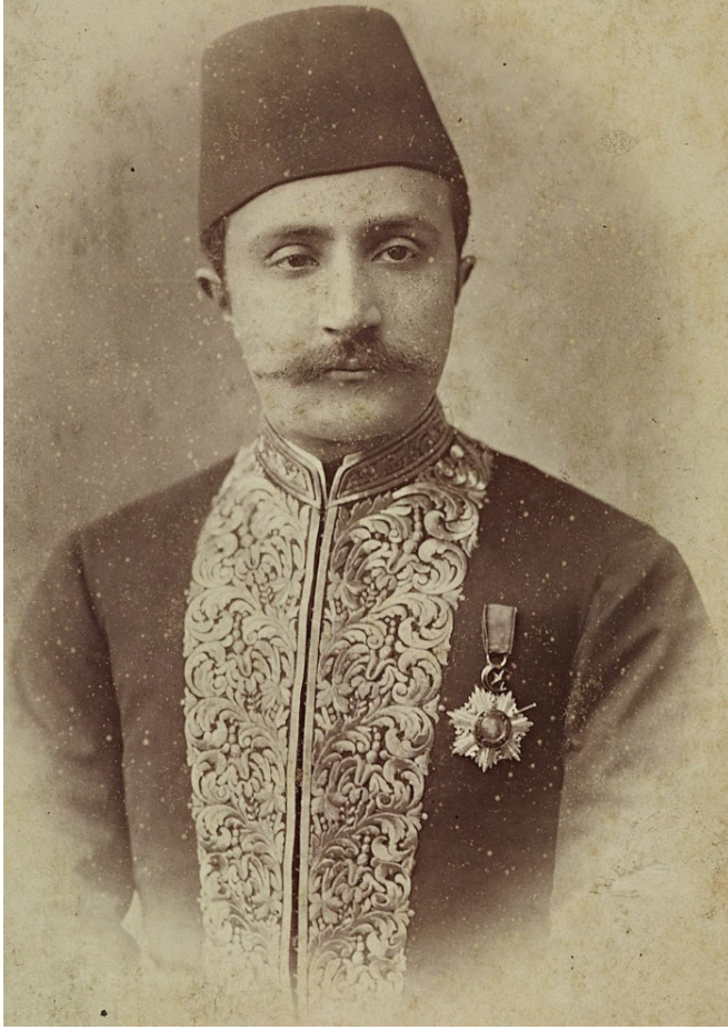
Ek 2: Dâhiliye Kalemінде abd-i kemter-i hazret-i padişahî Tahsin.