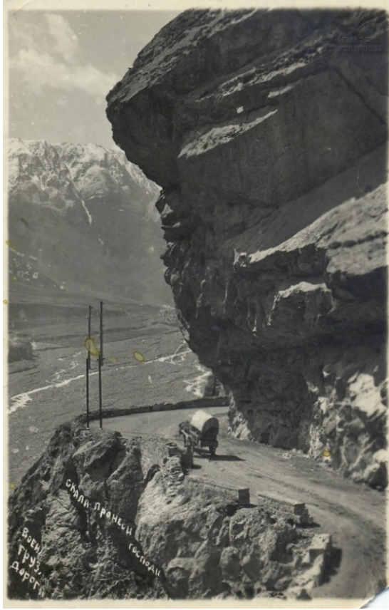
Resim 2: 19. Yüzyılda Gürcü Askerî Yolu'nun Görünümü