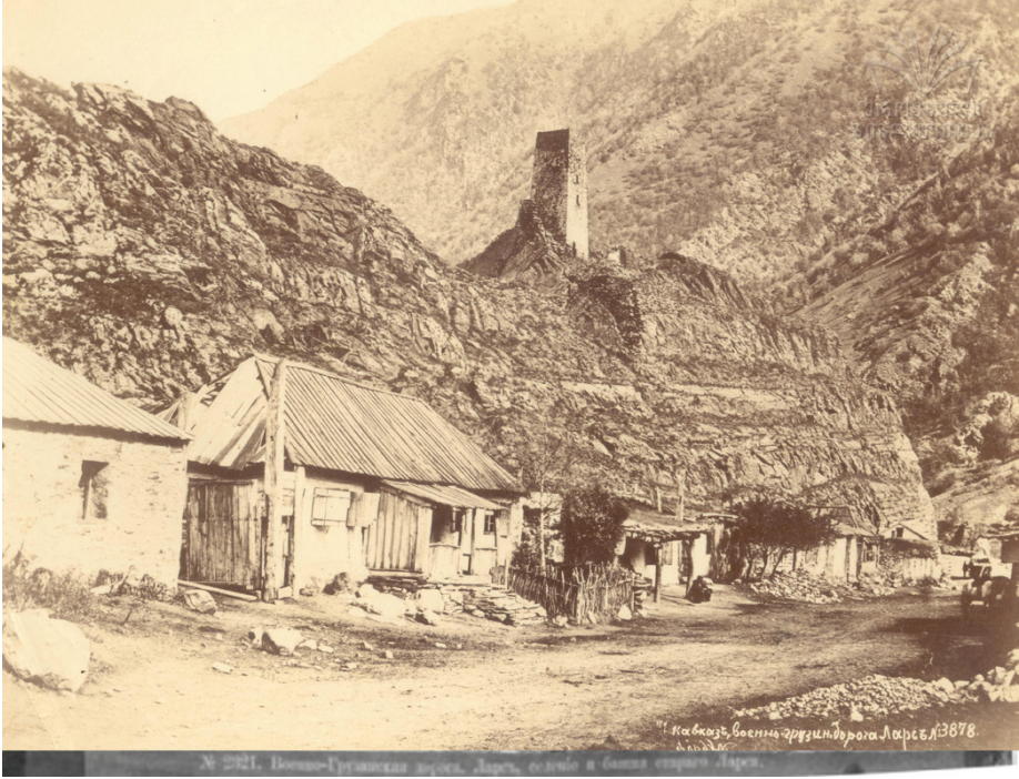
Resim 4: Lars'ta bir Savaş Kulesi