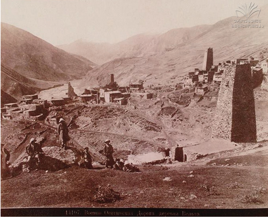
Resim 5: Savaş Kulesi (Osetya)