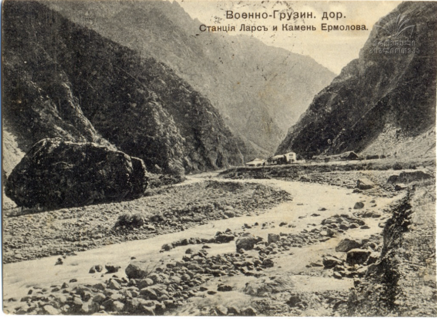
Resim 3: Gürcü Askerî Yolu -Lars İstasyonu ve Yermolov Taşı