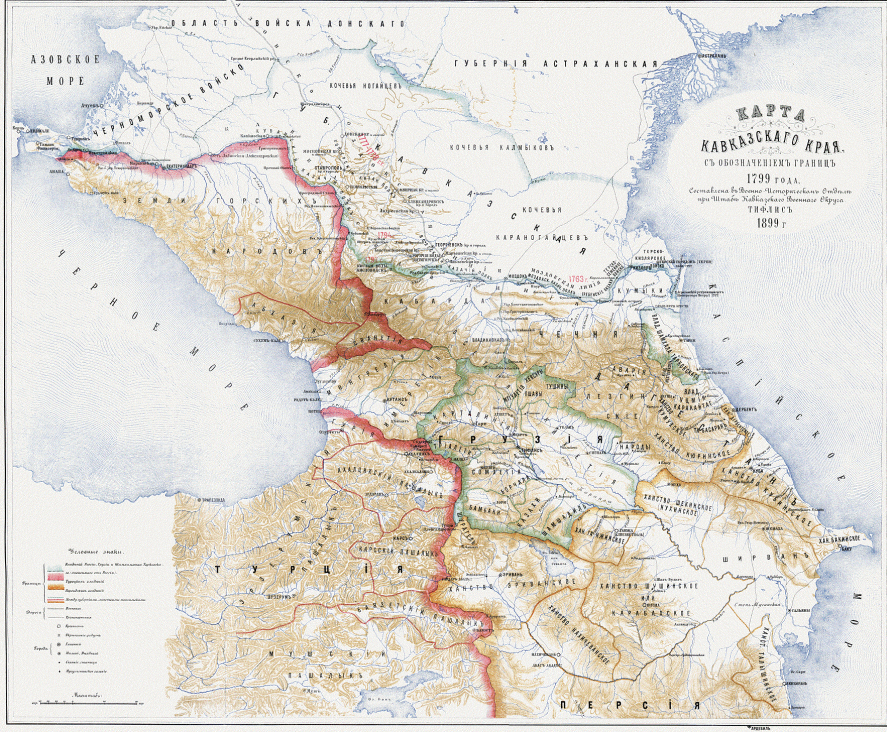
Harita 1: 19. Yüzyıl Başlarında Kafkasya

Kaynak: İstoricheskiy Oçerk Kavkazskih Voyn ot ih Naçala do Prisoedineniya Gruzii k Rossii , Red. V.A. Potto, Tipografiya Kantselyarii Glavnonaçalstvuyşego grajdanskoj çastyu na Kavkaze, Tiflis 1889, s.