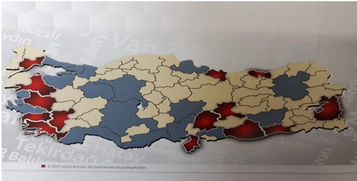
Şekil 1. Mevcut Büyükşehirleri Gösterir Harita

Şekilde 1'de 6360'tan önce mevcut büyükşehir belediyeleri mavi renkle, 6360'tan sonra büyükşehir belediyesi olan iller kırmızı renkle ve her iki durumda da büyükşehir belediyesi olmayan iller sarı renkle gösterilmiştir.