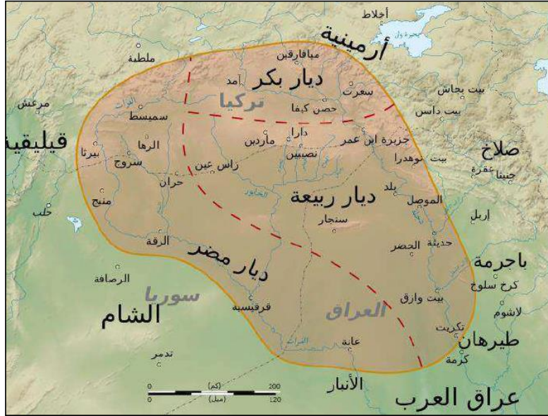
Harita II: el-Cezire'nin Kısımları; Diyar-ı Rebia, Diyar-ı Mudar, Diyar-ı Bekr (Karan, 2018: 503).