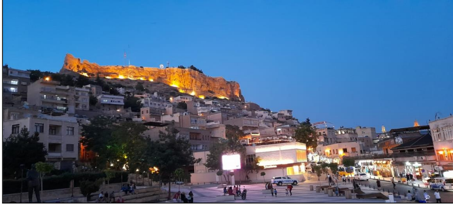
Şekil II: Günümüzde Mardin Kalesi ve üst üste gelecek şekilde kale altında sıralanan evler