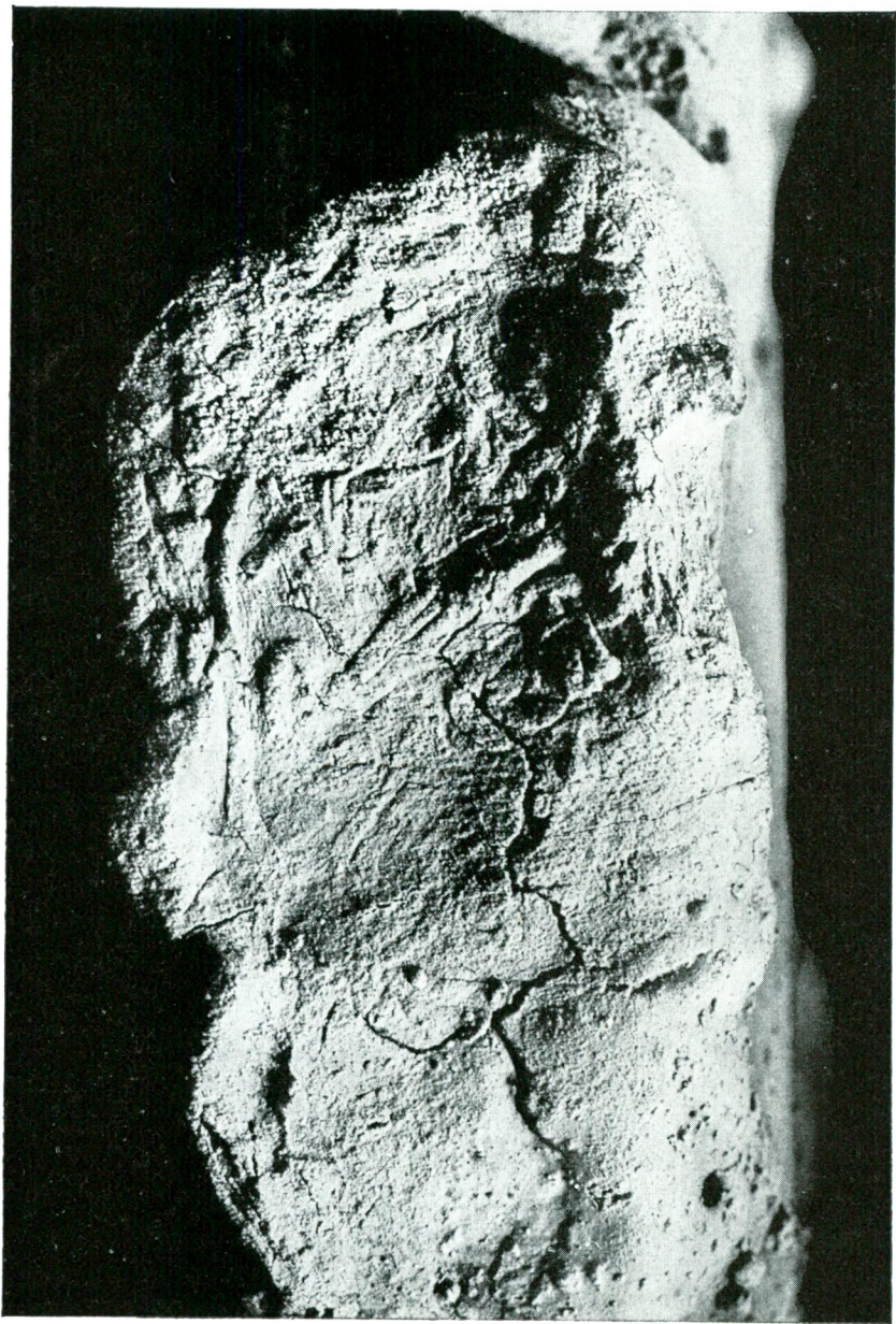
Siegelabdruck des Grosskönigs Tuḫaliya auf einer Tontafel aus Maṣat-Höyük