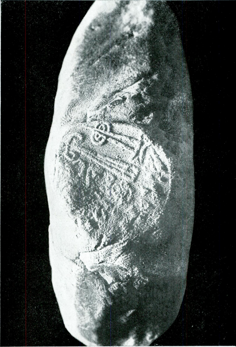
Siegelabdruck des Grosskönigs Tutkaliya auf einer Tontafel aus Maşat-Höyük