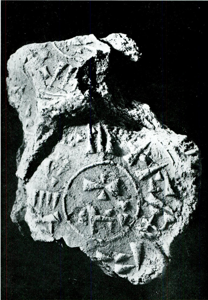
Abdrücke des Tabarna - Siegels aus Maşat-Höyük