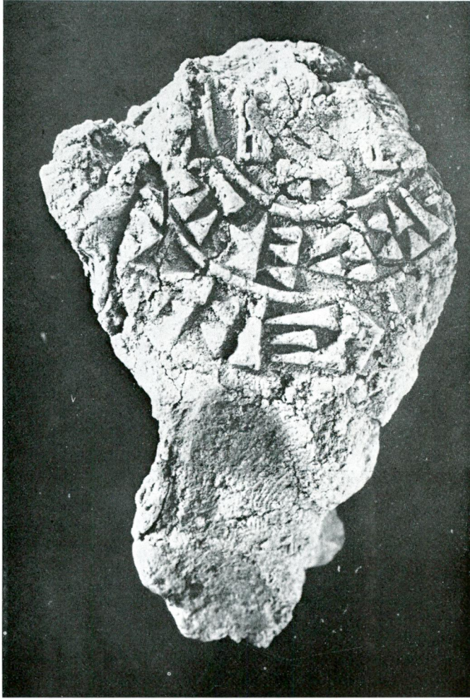
Abdruck des Siegels des Šuppiluliuma I. aus Maşat-Höyük