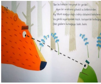
Resim 12. Zararlı Alışkanlıklar