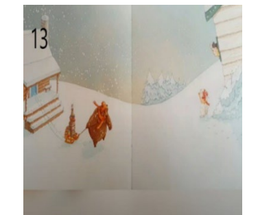
Resim 13. Özveri