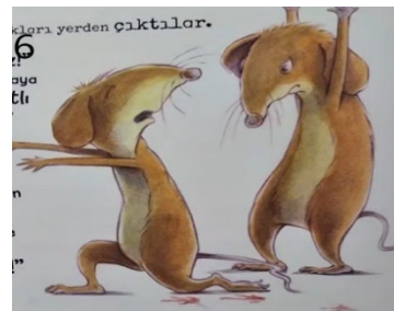
Resim 6. Doğruluk ve Dürüstlük