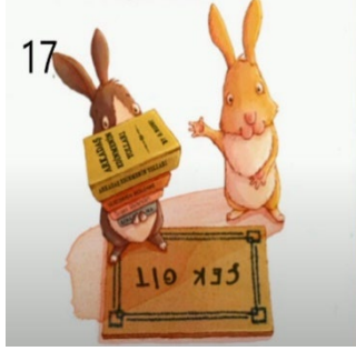
Resim 17. Saygı

Yukarıda resimli çocuk kitaplarındaki bazı görsellere yer verilmiştir. Bu görseller içerisinde 1 numaralı görsel aile birliğine önem verme, 2 numaralı görsel bilimsellik, 3 numaralı görsel çalışkanlık, 4 numaralı görsel dayanışma ve yardımseverlik, 5 numaralı görsel güven ve doğa sevgisi, 6 numaralı görsel doğruluk ve dürüstlük, 7 numaralı görsel cesaret, 8 numaralı görsel sorumluluk, 9 numaralı görsel iyilik yapmak, 10 numaralı görsel merhamet, 11 numaralı görsel misafirperverlik ve hoşgörü, 12 numaralı görsel özgüven, 13 numaralı görsel özveri, 14 numaralı görsel paylaşma ve dostluk, 15 numaralı görsel sabır ve öz denetim, 16 numaralı görsel estetik ve 17 numaralı görsel saygı değerini temsil etmektedir.