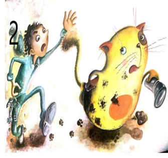
Resim 2. Hırsızlık