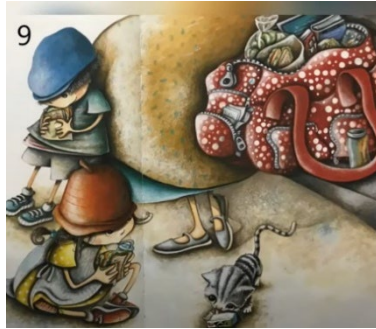
Resim 9. İyilik Yapmak