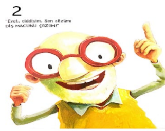
Resim 2. Bilimsellik