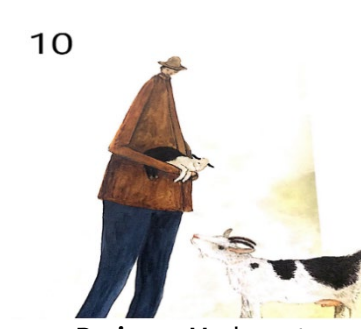
Resim 10. Merhamet