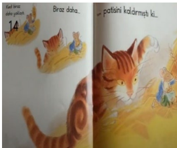
Resim 14. Hainlik

Yukarıda resimli çocuk kitaplarındaki bazı görsellere yer verilmiştir. Bu görseller içerisinde 1 numaralı görsel acelecilik, 2 numaralı görsel hırsızlık, 3 numaralı görsel şiddet ve saldırganlık, 4 numaralı görsel ihmalcilik, 5 numaralı görsel öfke ve nefret, 6 numaralı görsel kibir ve bencillik, 7 numaralı görsel kötülük, 8 numaralı görsel çıkarıcılık, 9 numaralı görsel hilekarlık, 10 numaralı görsel zalimlik, 11 numaralı görsel açgözlülük, 12 numaralı görsel zararlı alışkanlıklar, 13 numaralı görsel tembellik ve 14 numaralı görsel hainliği temsil etmektedir.