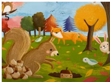
Resim 5. Doğa Sevgisi