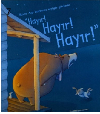
Resim 7. Kötülük