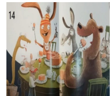
Resim 14. Paylaşma ve Dostluk