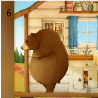
Resim 6. Kibir ve Bencillik