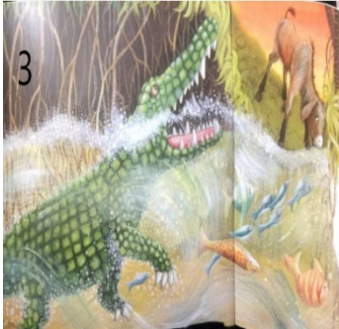
Resim 3. Şiddet ve Saldırganlık