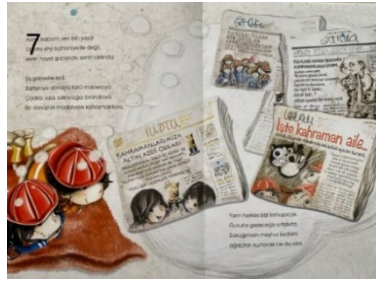
Resim 7. Cesaret