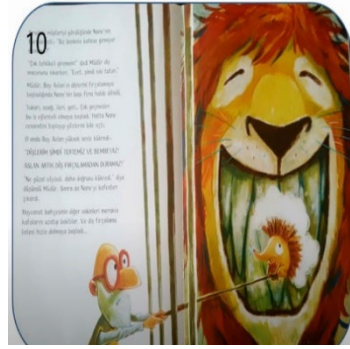
Resim 10. Zalimlik