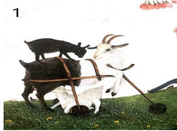
Resim 1. Aile Birliği