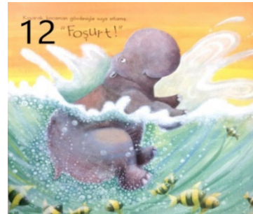
Resim 12. Özgüven