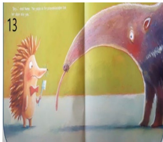
Resim 13. Tembellik