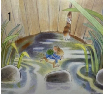
Resim 1. Acelecilik