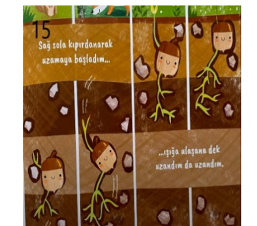
Resim 15. Sabır ve Öz Denetim