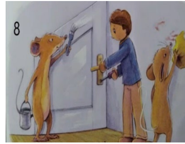
Resim 8. Sorumluluk