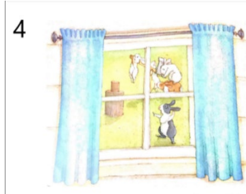
Resim 4. Dayanışma ve Yardımseverlik