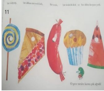
Resim 11. Açgözlülük