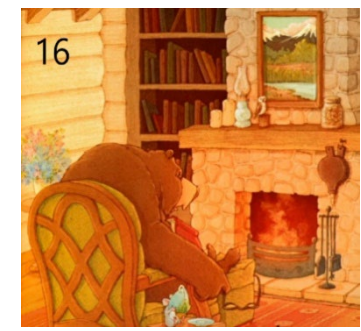
Resim 16. Estetik