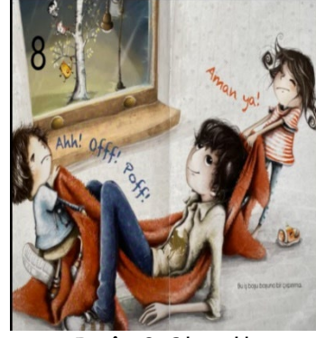
Resim 8. Çıkarıcılık