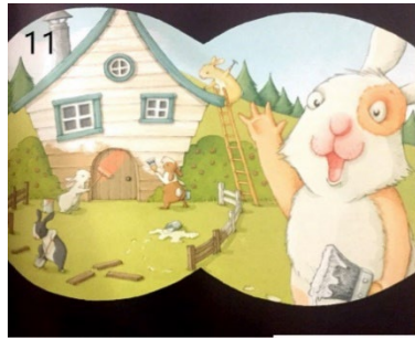
Resim 11. Misafirperverlik