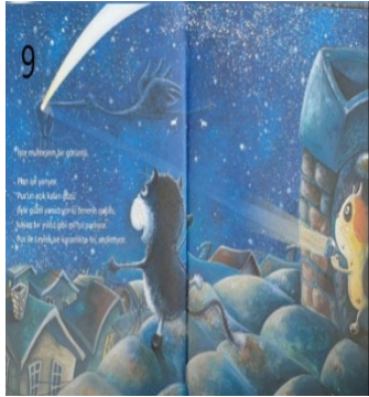
Resim 9. Hilekarlık