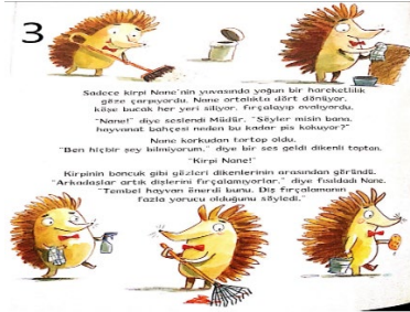
Resim 3. Çalışkanlık